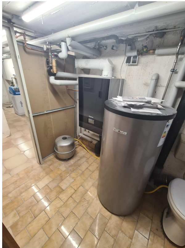
Heizung und Warmwasser