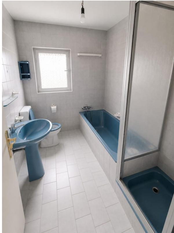
Bad, WC, Dusche