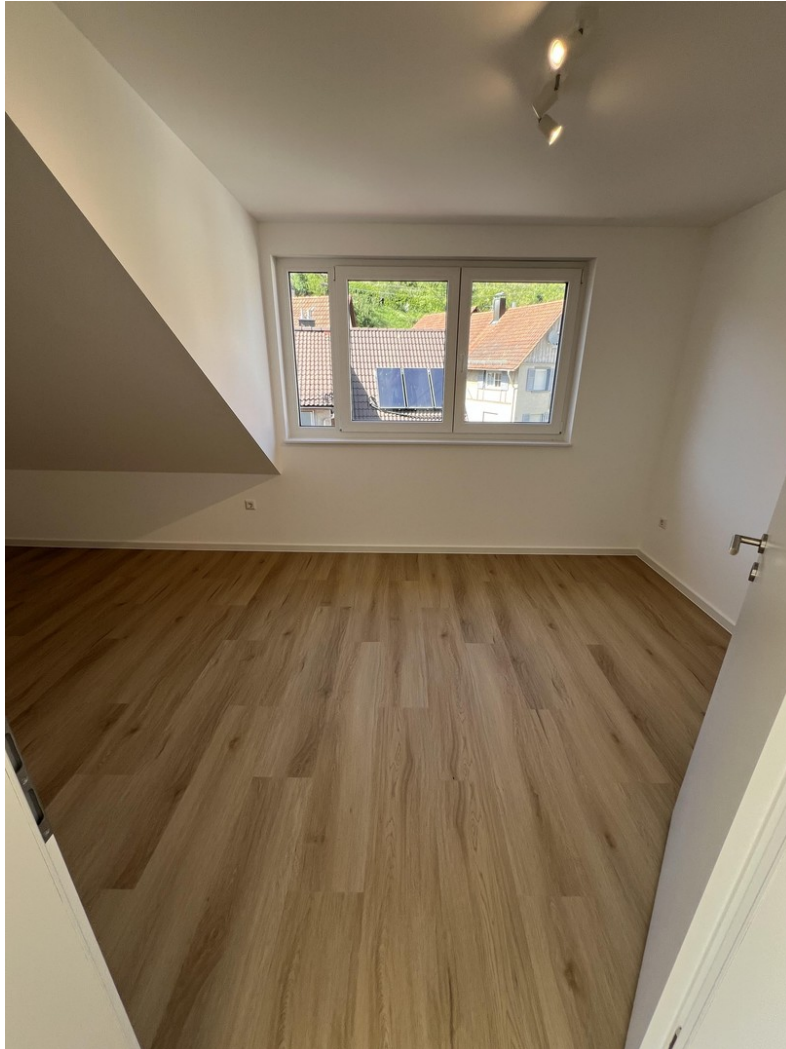
Kinderzimmer - Ansicht 1