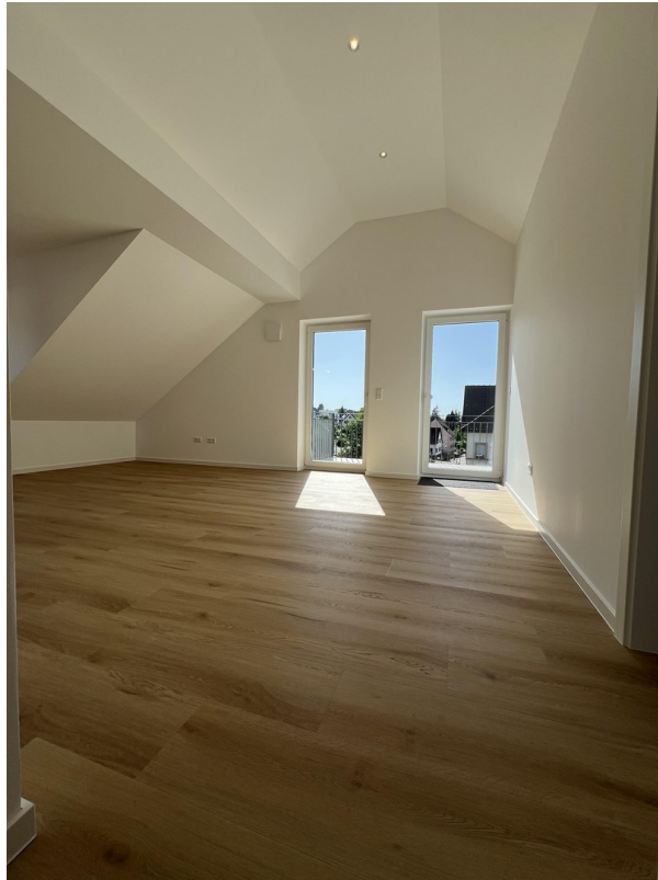
Wohnzimmer, Zugang Balkon