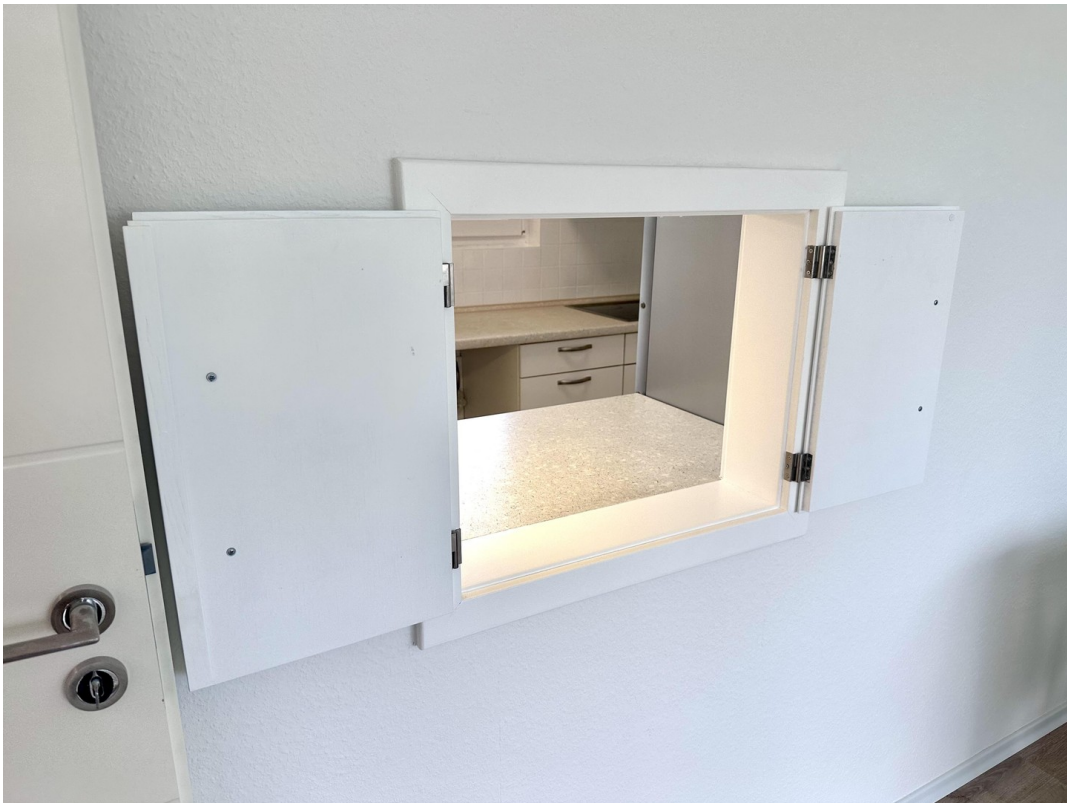
Durchreiche WZ Küche