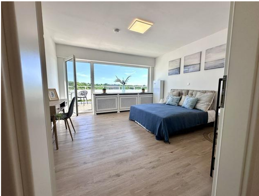
1. Schlafzimmer 1