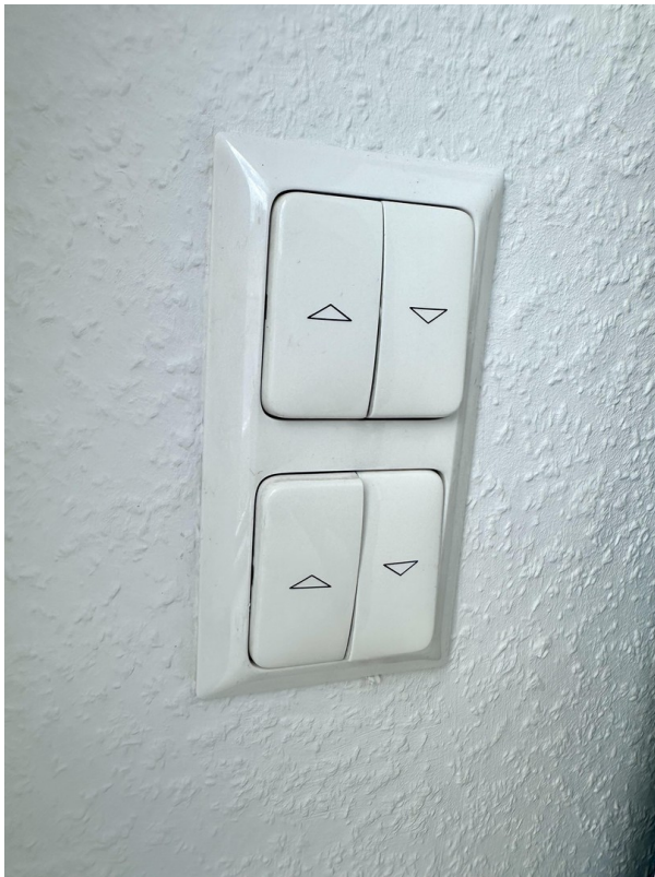
elektrische Rollläden WZ/2SZn