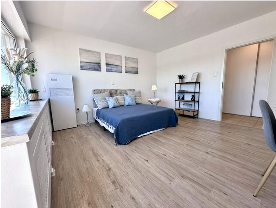
1. Schlafzimmer 2