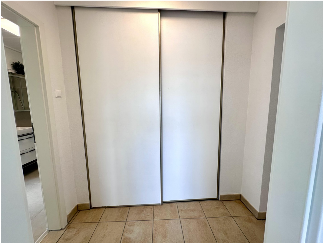
einer der Einbauschränke