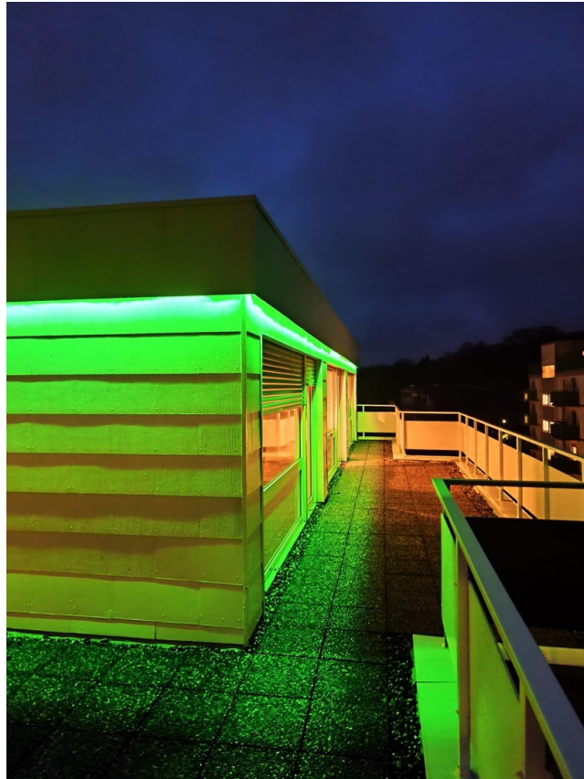
Attika LED grün