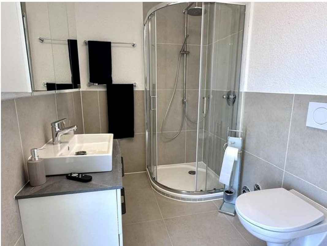
Bad komplett neu 1