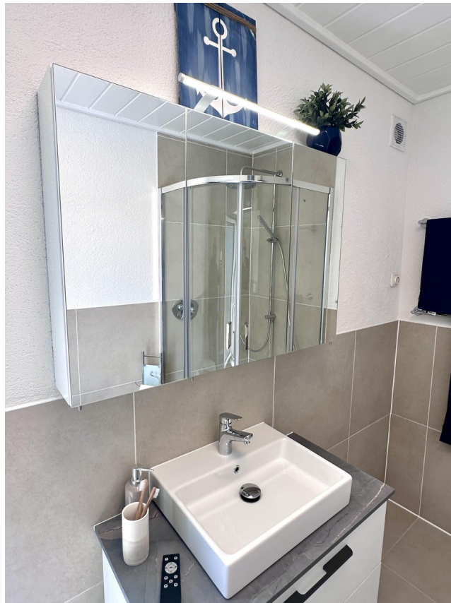
Bad komplett neu 2