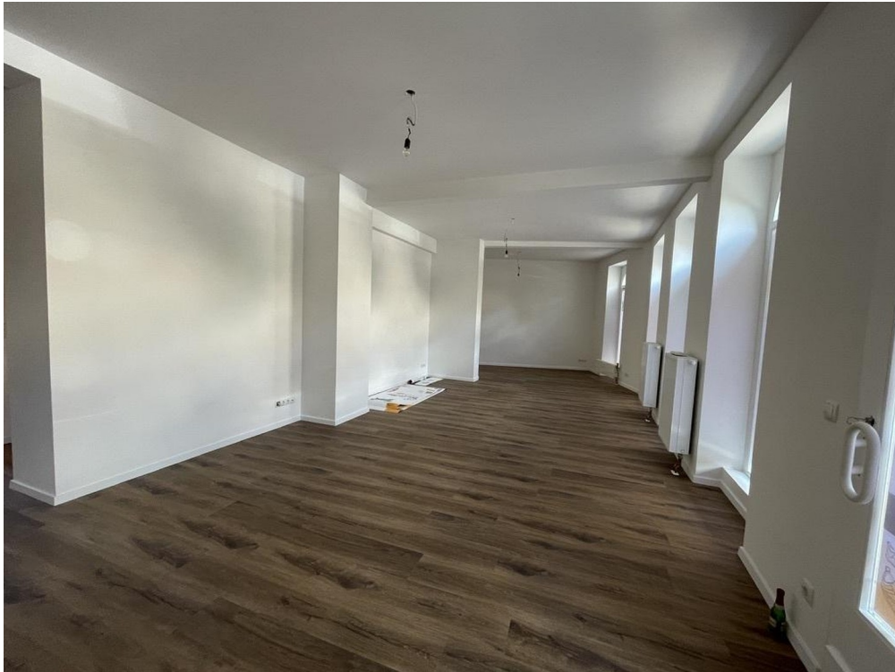
rechte Seite Hauptraum