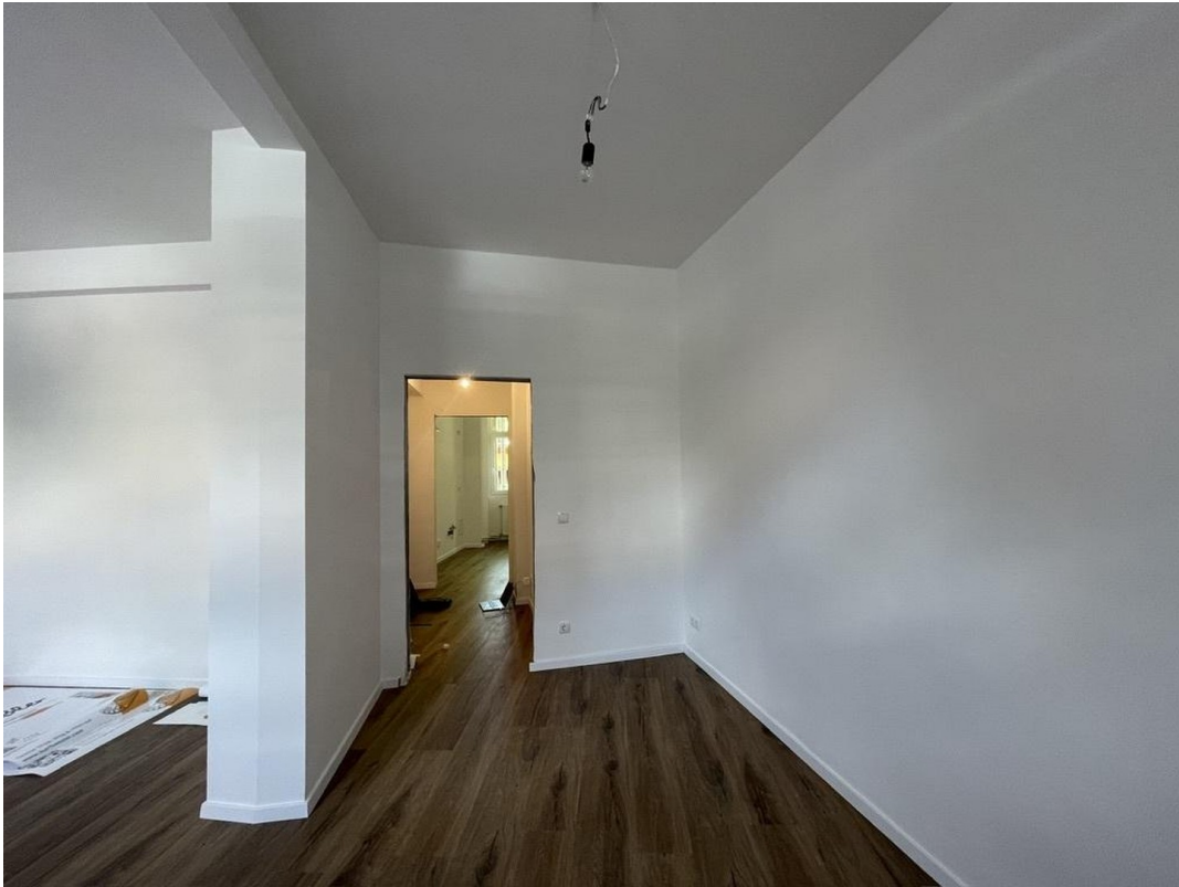
Blick auf die 2. Tür