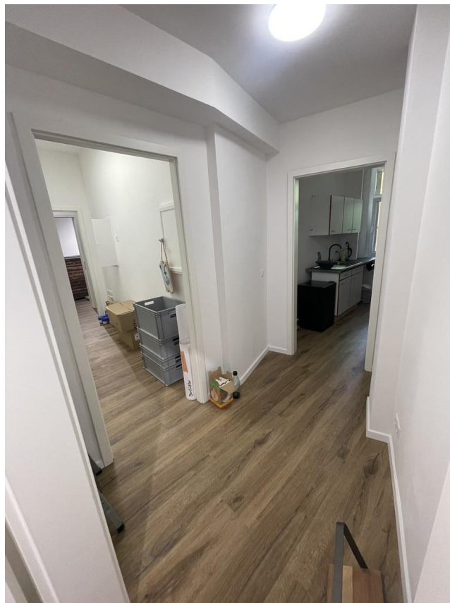
Blick von der 2. Tür n. hinten