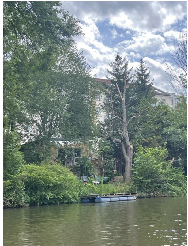
Haus und Steg vom Wasser