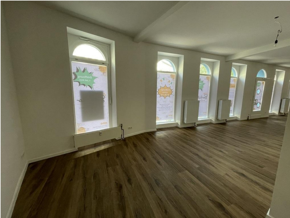
Blick von der 2. Tür n. vorn