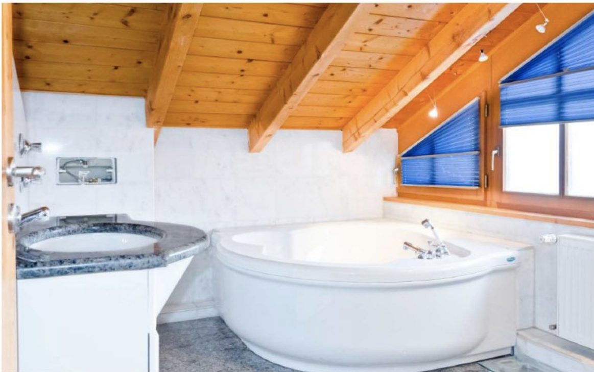
Badezimmer mit Eckbadewanne