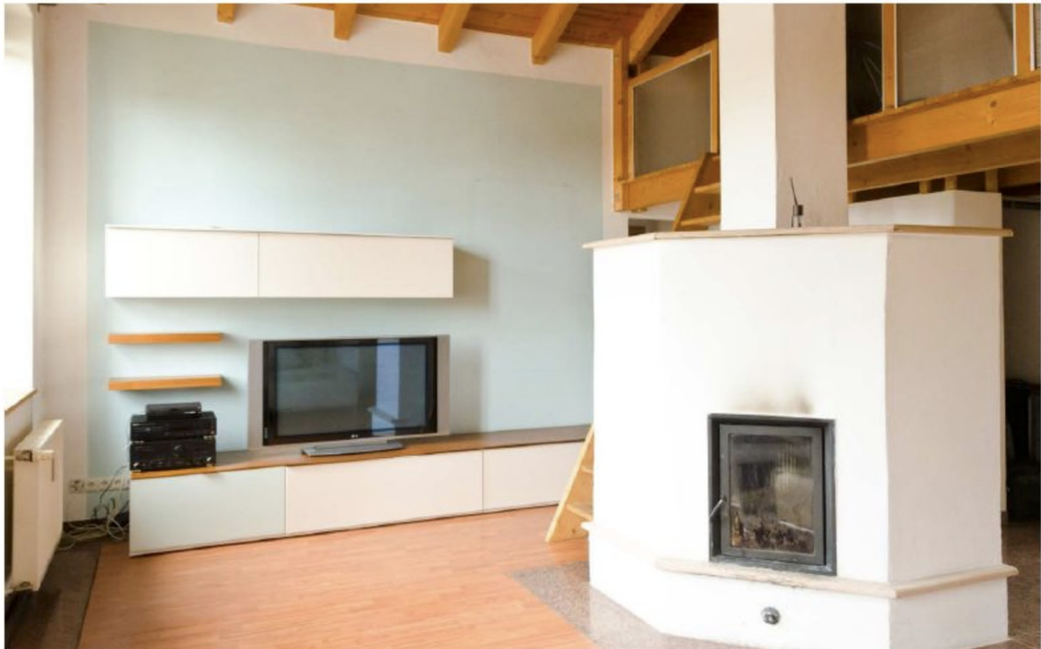
Wohnzimmer mit Holzofen