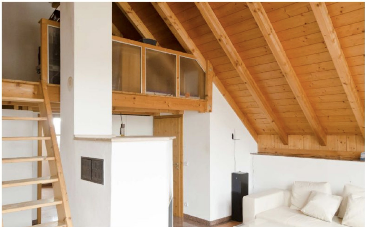
Wohnzimmer mit Galerie