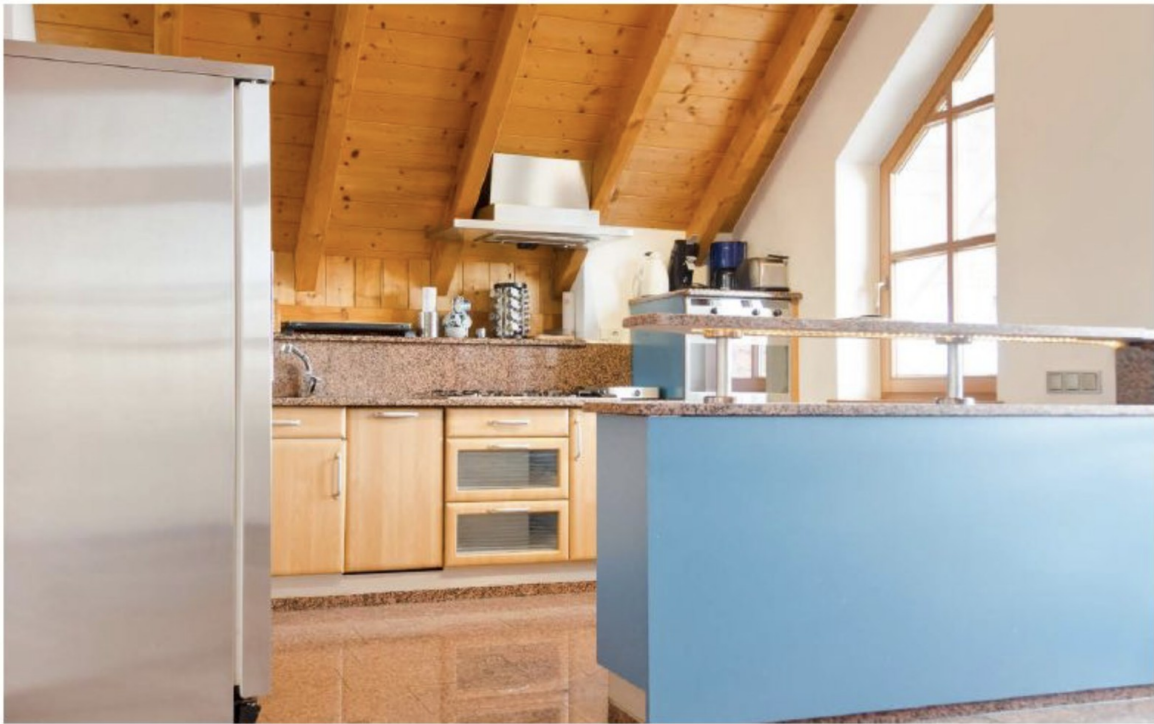
Wohnküche mit Theke