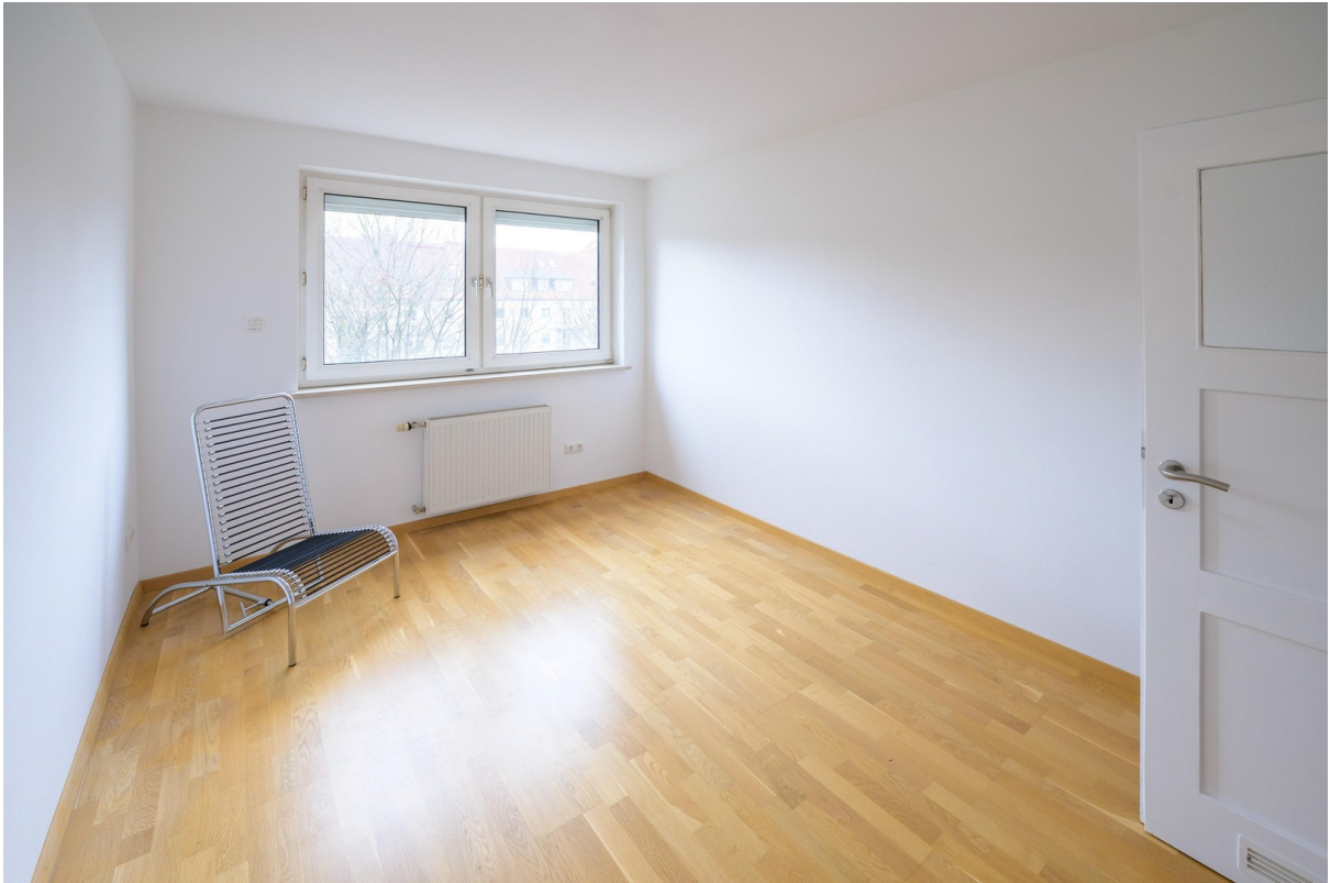
Schlafzimmer 12 m2