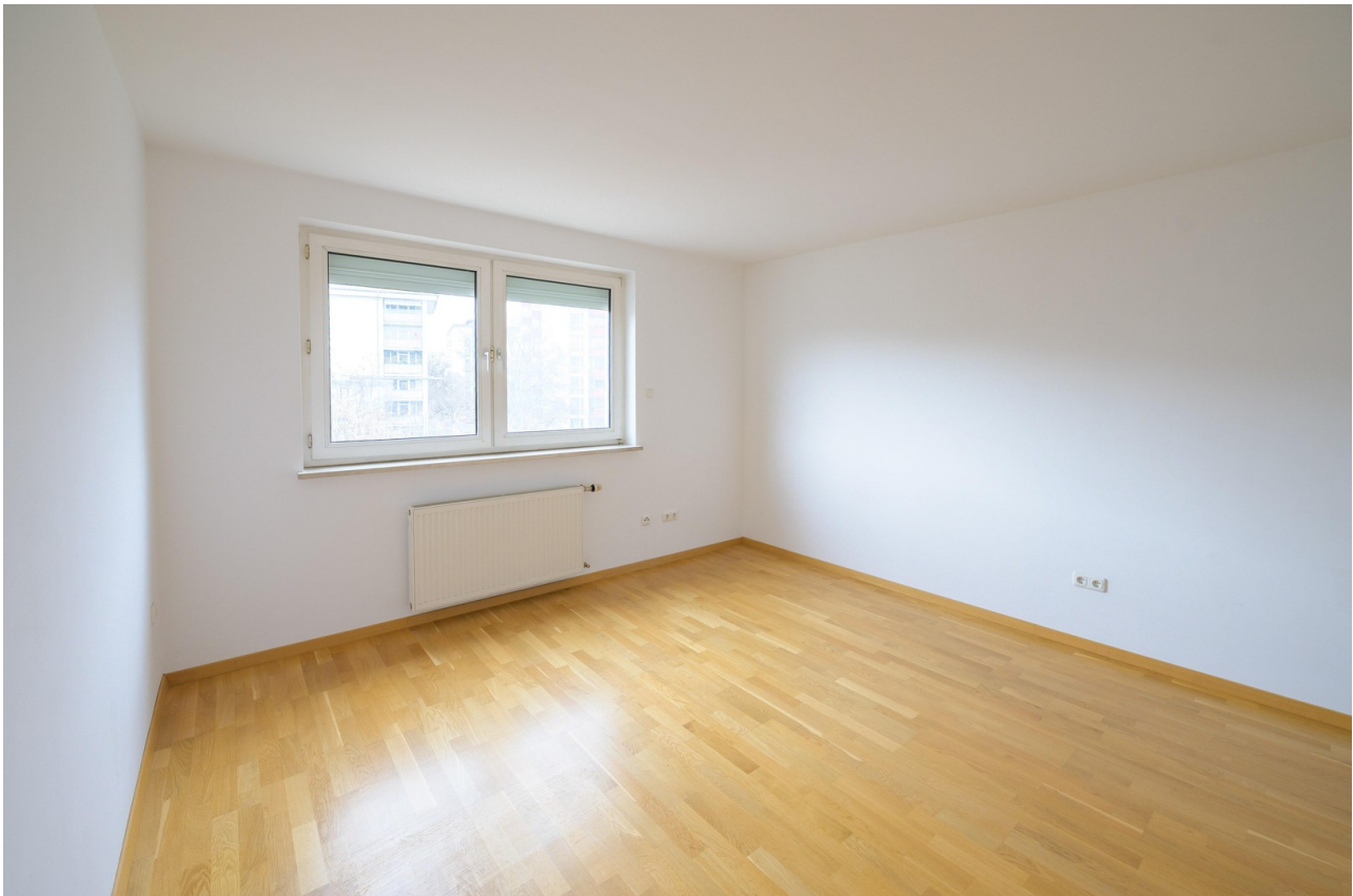
Schlafzimmer 19 m 2