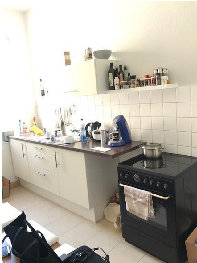
Küche Teil 2