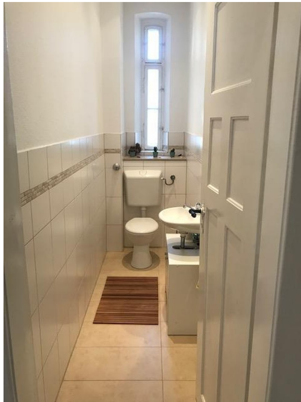
Separates WC /mit Spülbecken