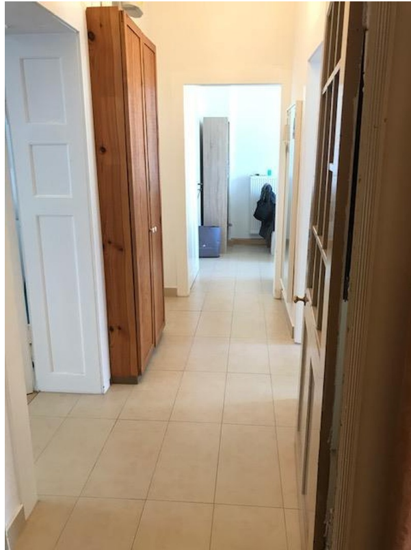
Gang in die Wohnung