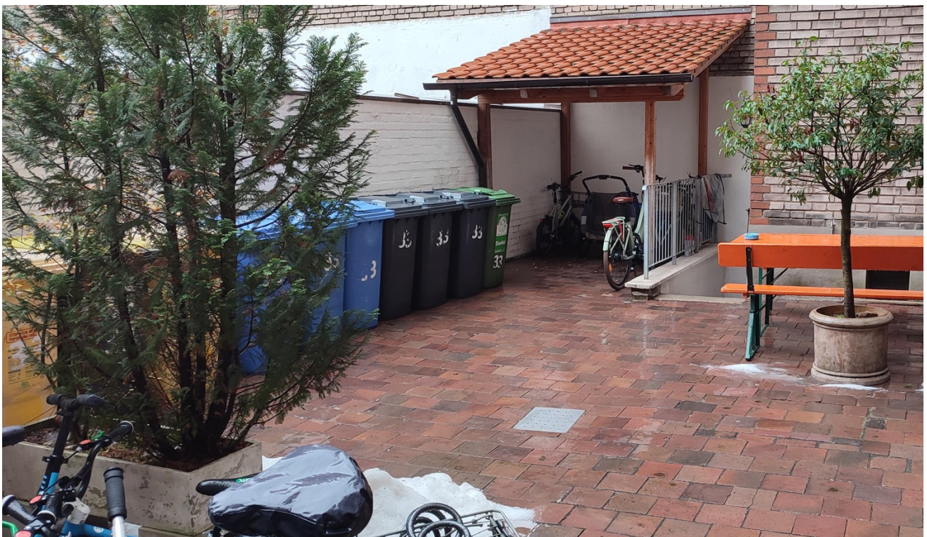
Hinterhof für Fahrräder etc.