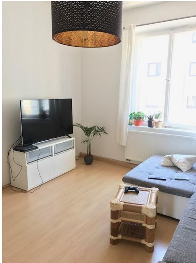
Zimmer 2 Wohnzimmer