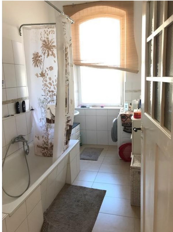
großes Tageslichtbad WM-An.