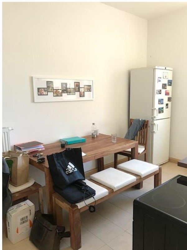
große Küche Teil 1