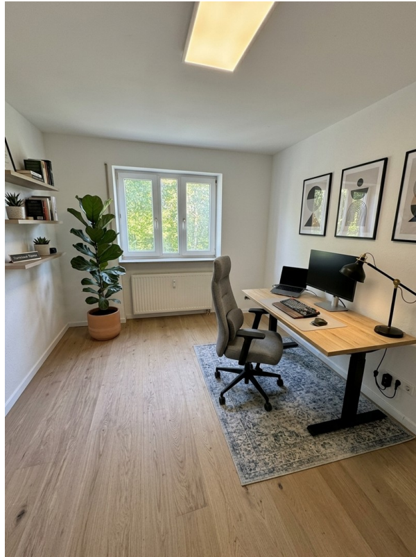
Arbeitszimmer möbliert mit KI