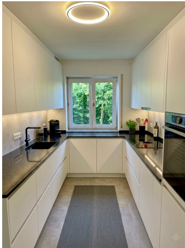
Küche möbliert mit KI