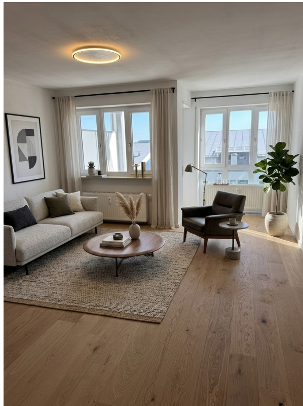
Wohnzimmer möbliert mit KI