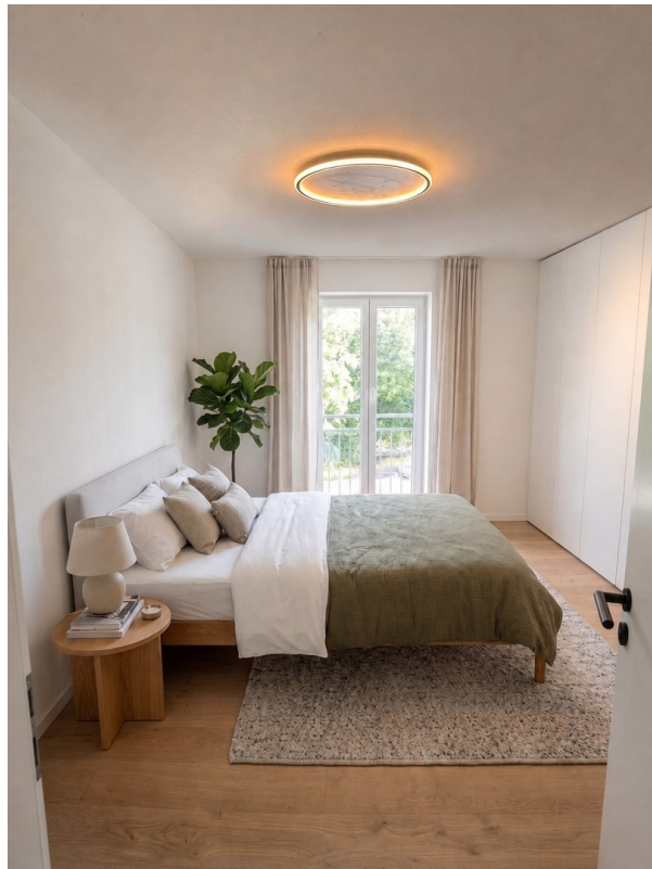
Schlafzimmer möbliert mit KI