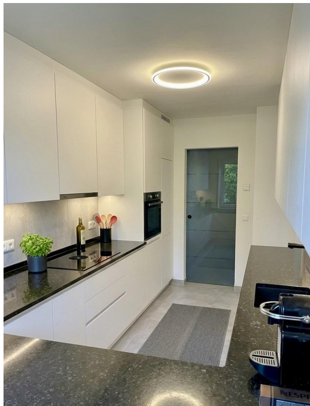
Küche möbliert mit KI