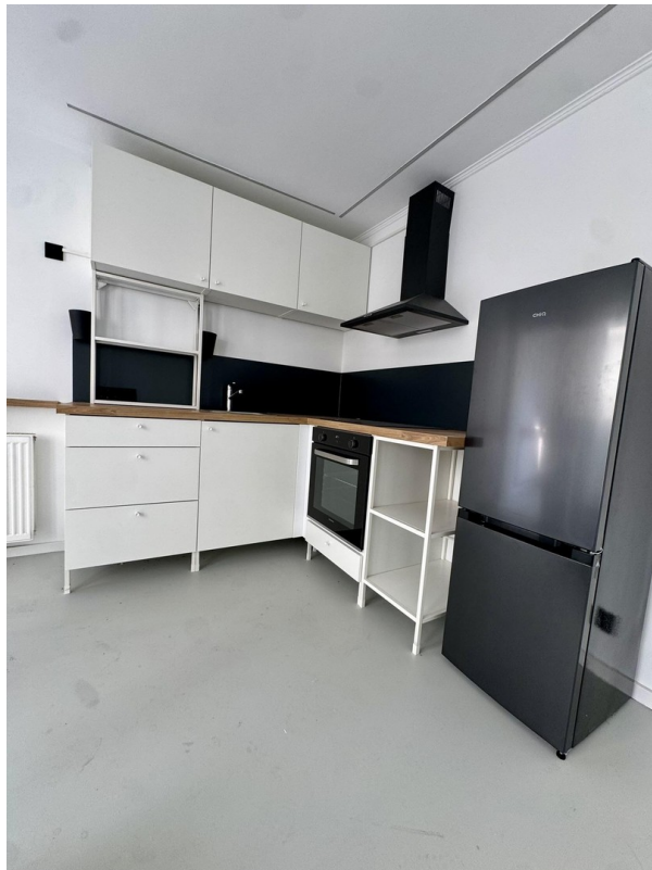
Moderne EBK mit Geräten