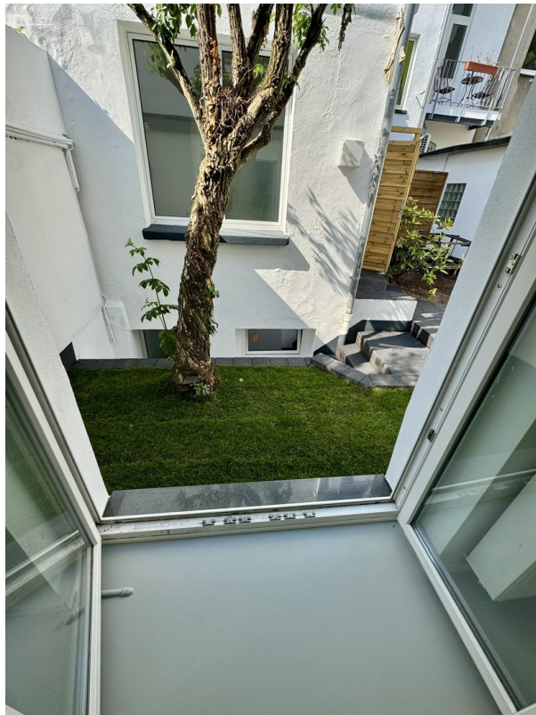
Zugang zum Garten