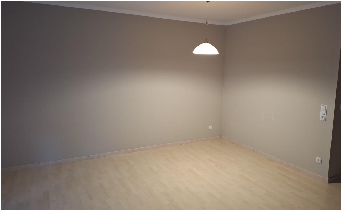
Wohnzimmer & Schlafzimmer