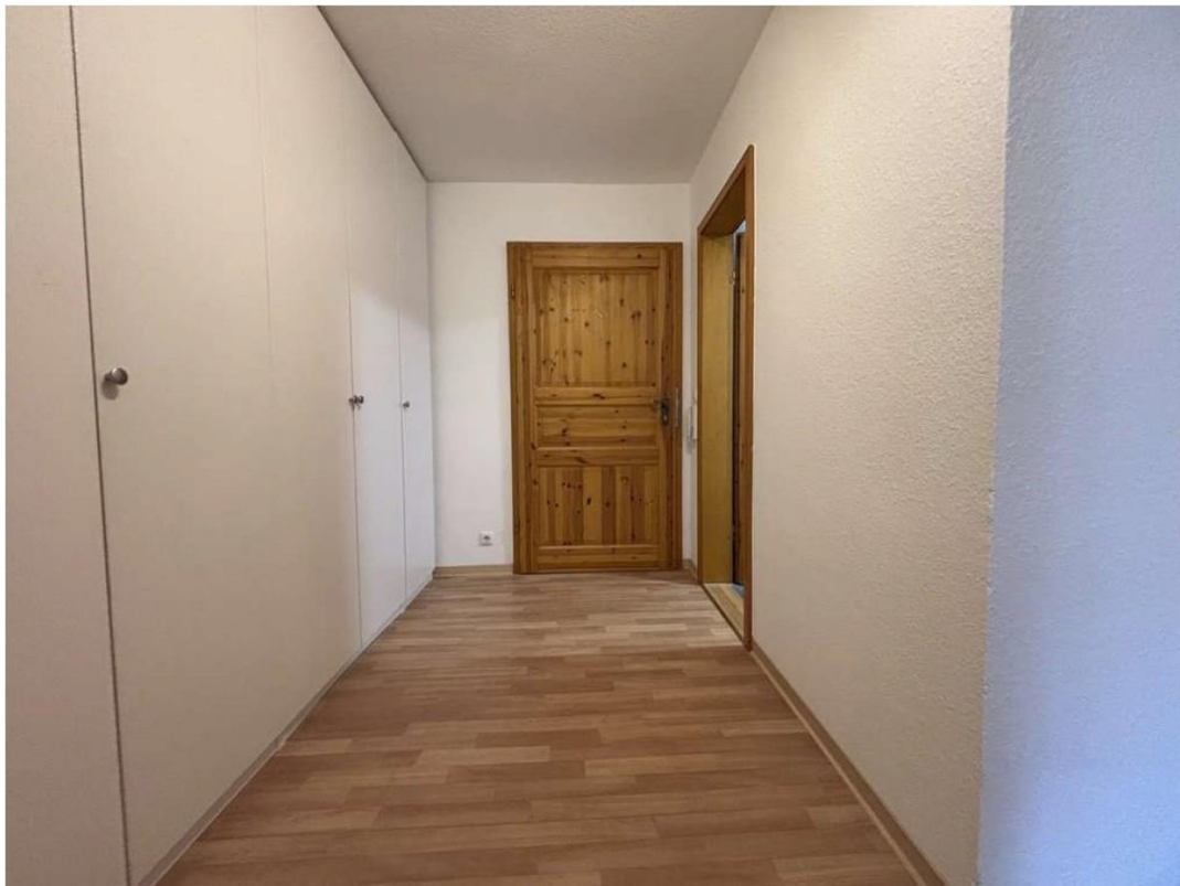
Blick v. Flur auf Eingangstür