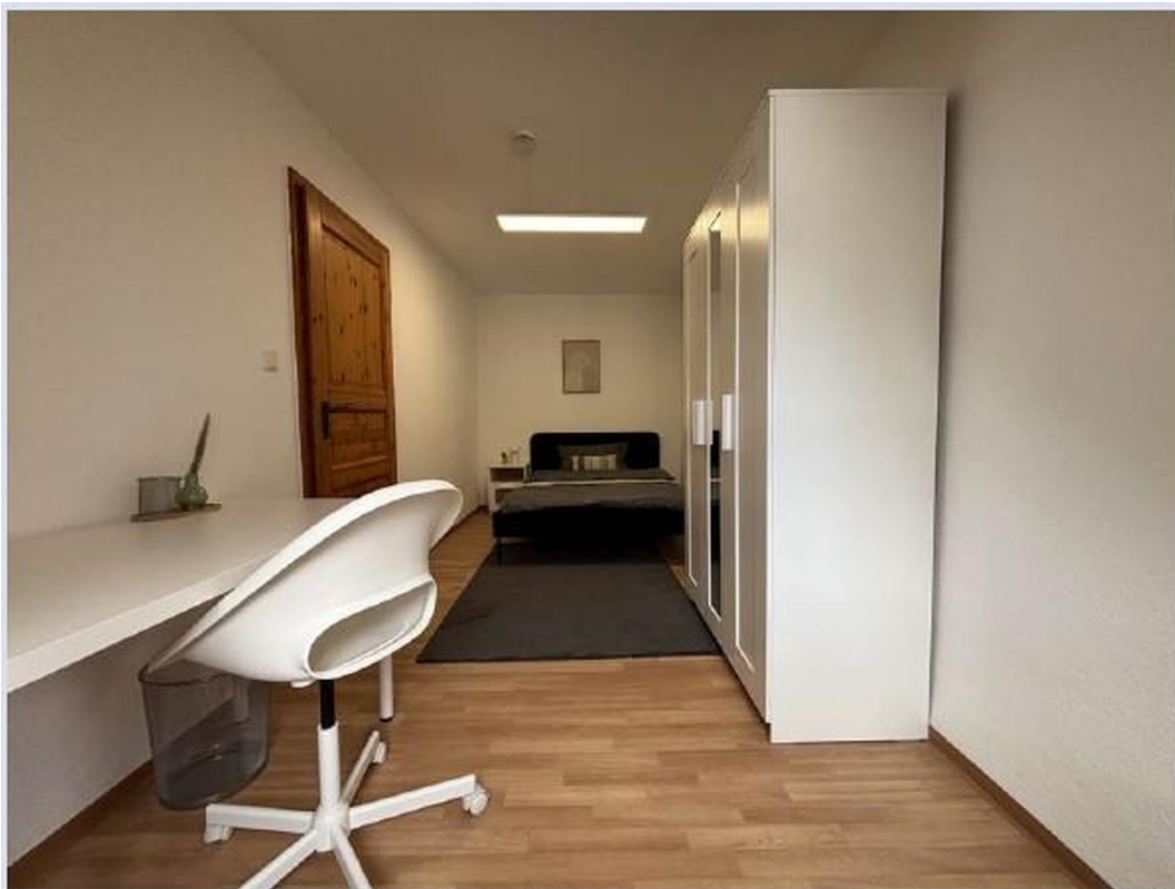
Zimmer 1 - ca. 12qm