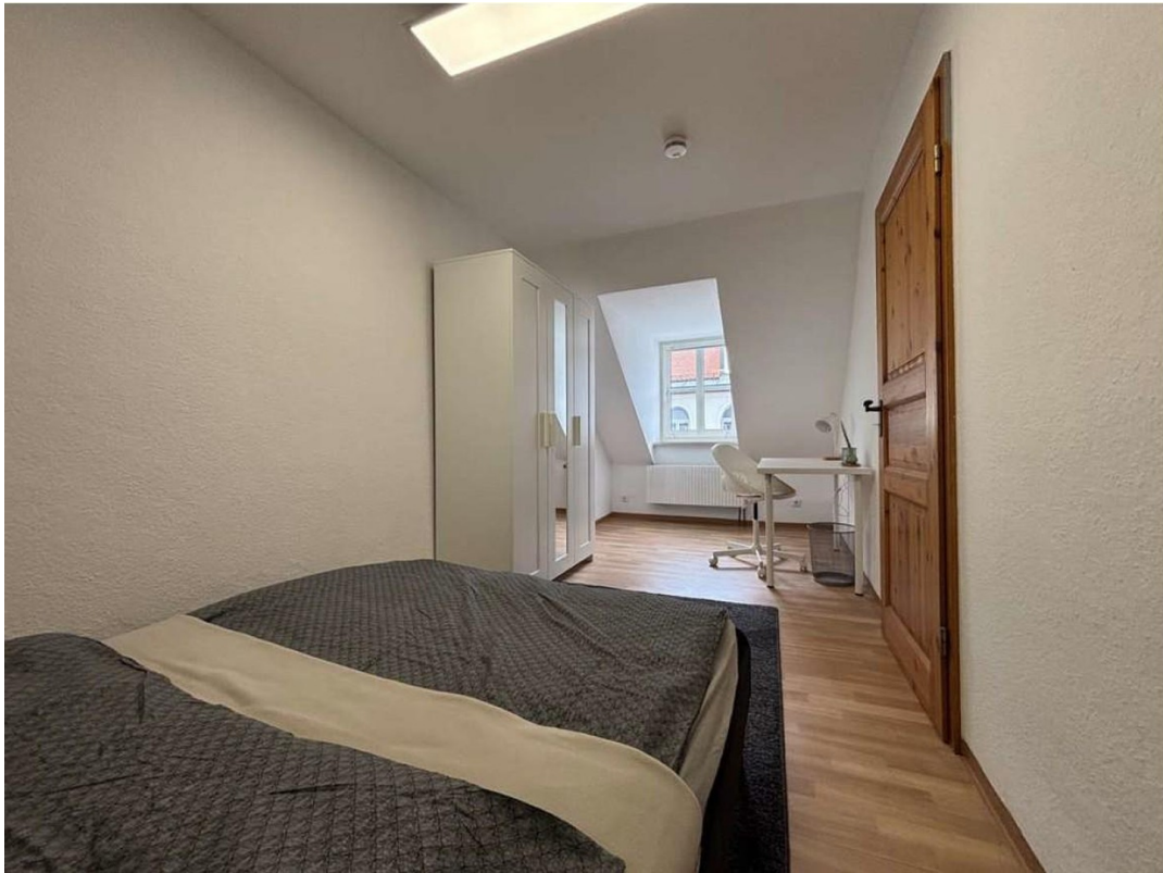
Zimmer 1 - ca. 12qm