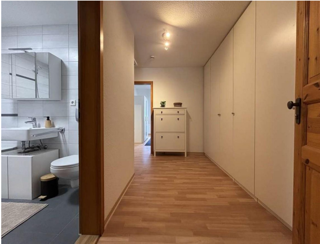
Flur u. Einbauschränk rechts