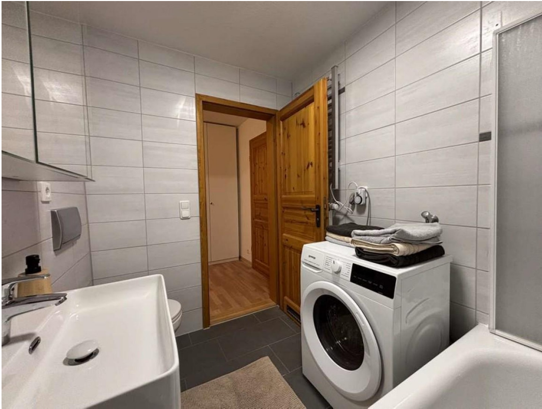
Bad mit Wasch-Trockner