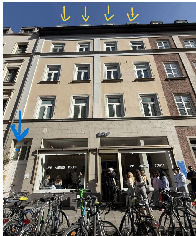
Aussen - incl. Markierungen