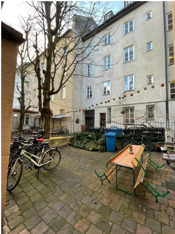
Kleiner Hinterhof zur Nutzung