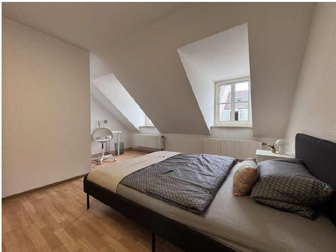
Zimmer 2 incl. Tisch-Ecke