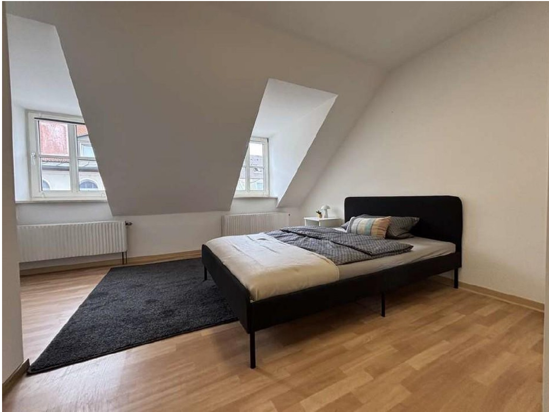
Zimmer 2 incl. 2 Gauben