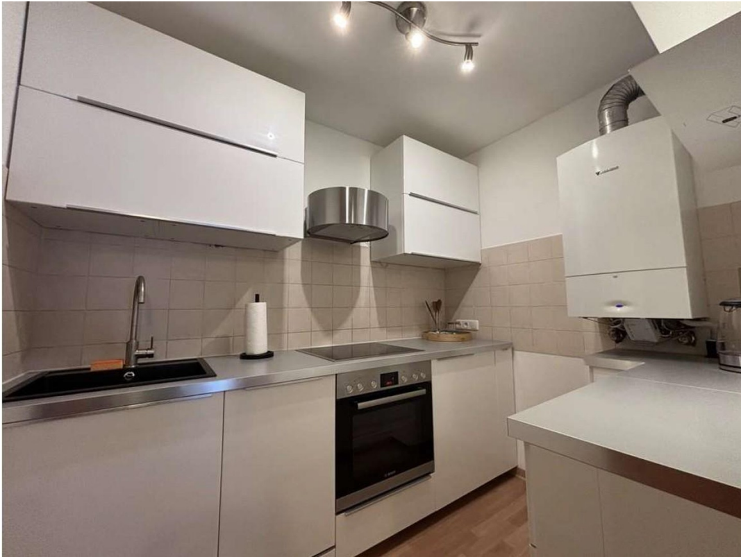
Küche mit Spüler u. Ofen