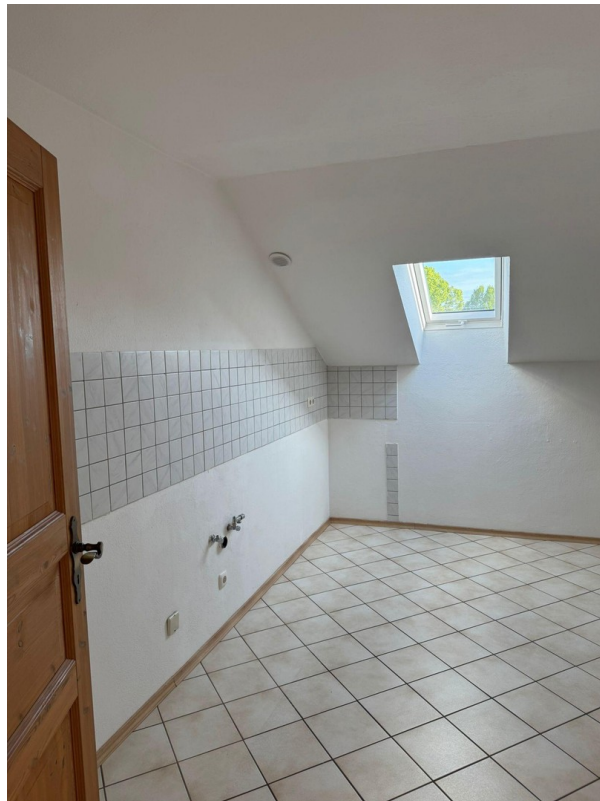
Küche (wird noch eingebaut)