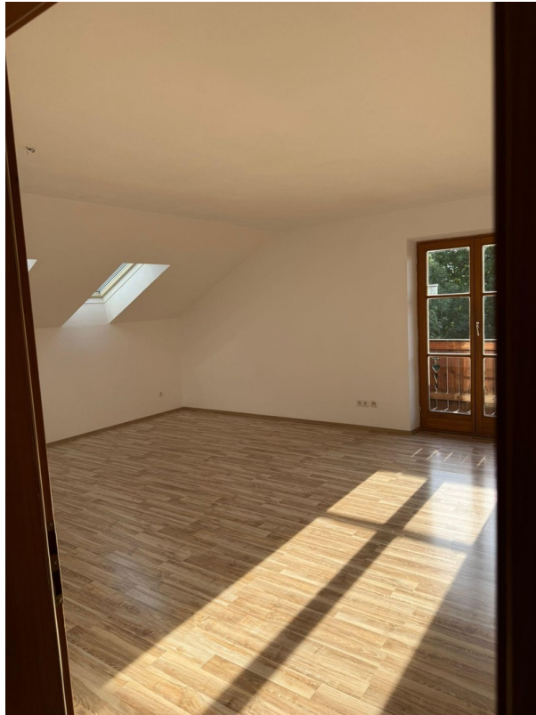
Wohnzimmer Ansicht 2