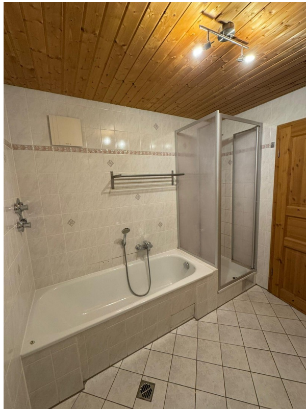
Bad Ansicht 2