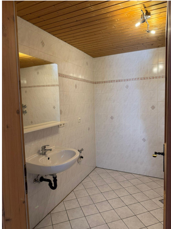
Bad Ansicht 1