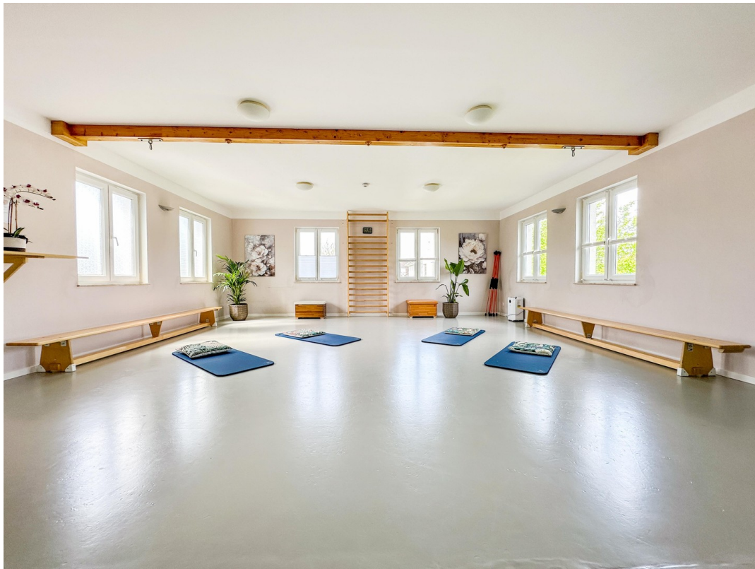
Sportraum im OG