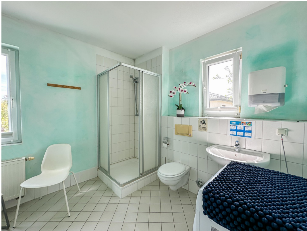
Duschbad 1 im OG