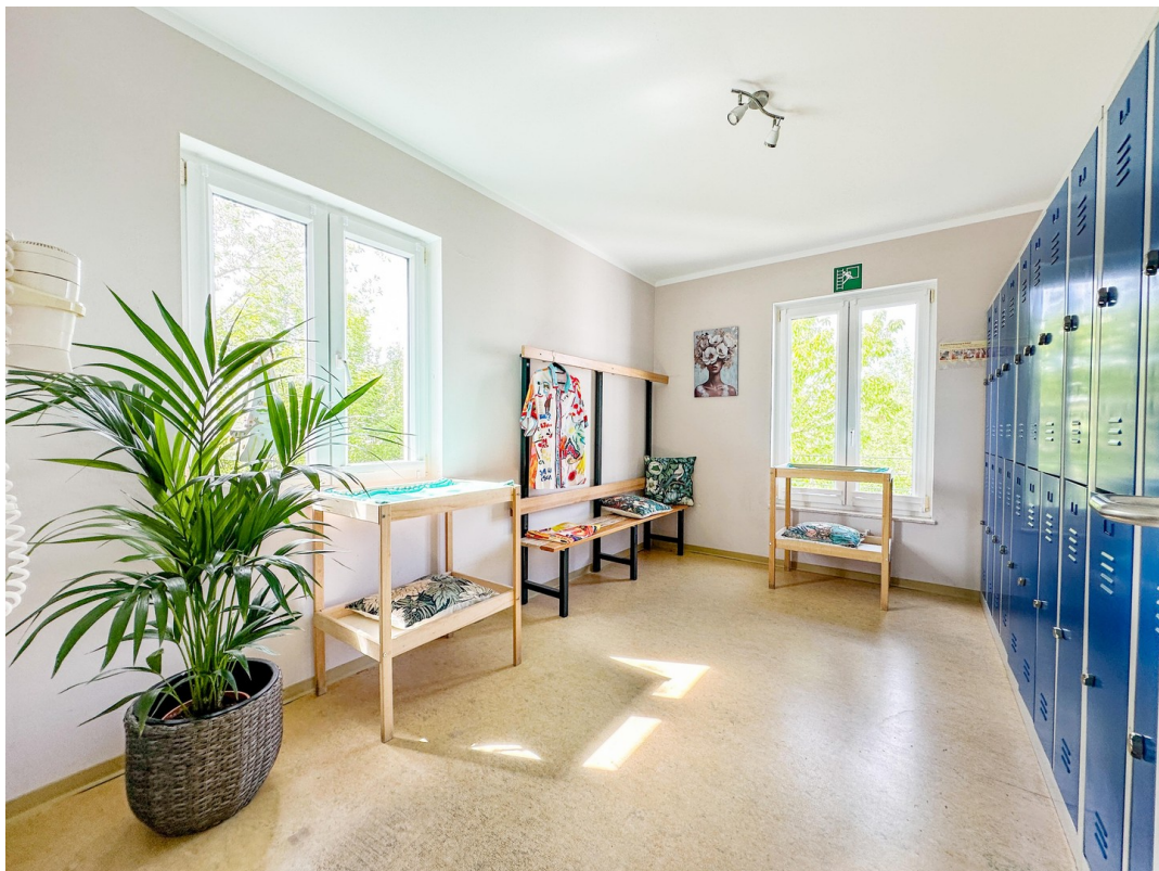
Umkleide im OG