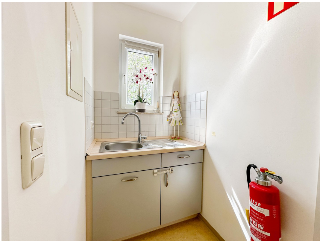
Teeküche im OG