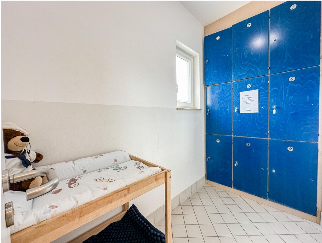
Umkleide im EG