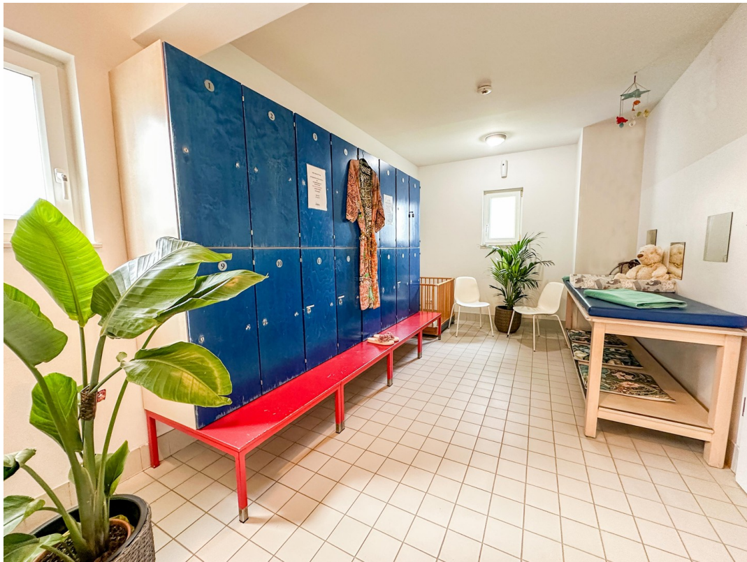
Umkleide im EG