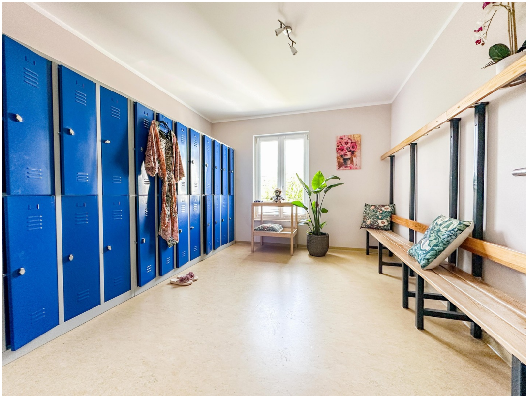
Umkleide im OG