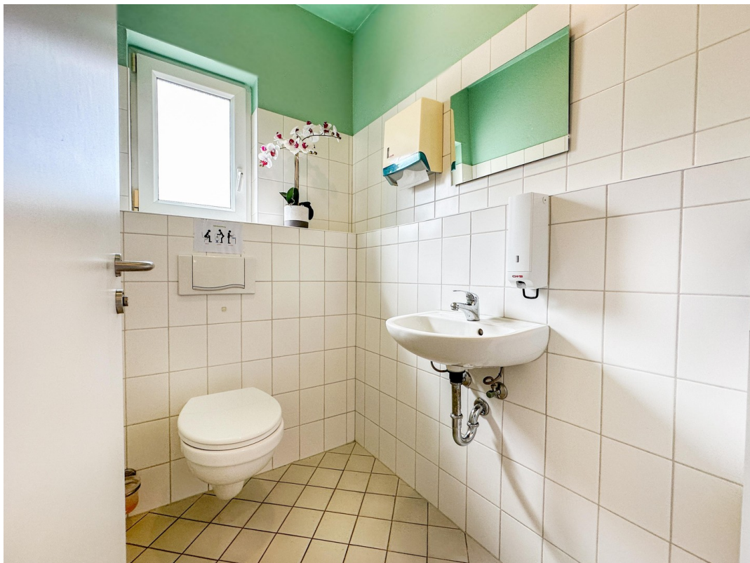
WC im EG