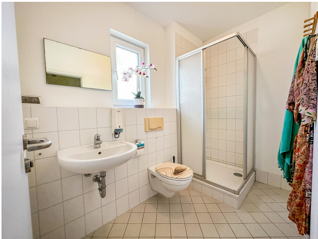
Duschbad 2 im OG