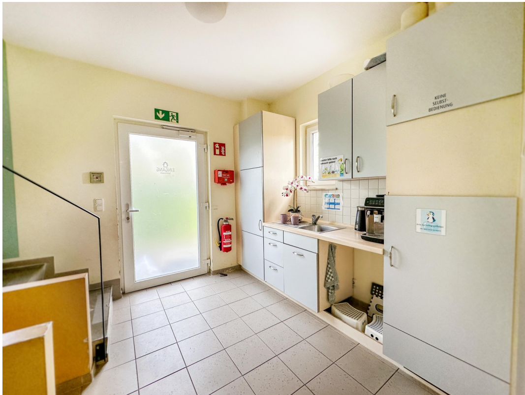
Teeküche im EG