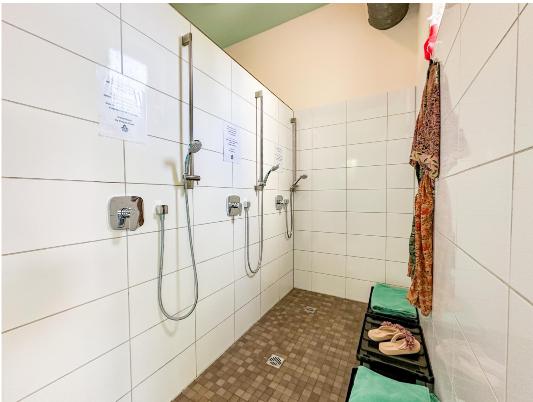
Dusche im EG