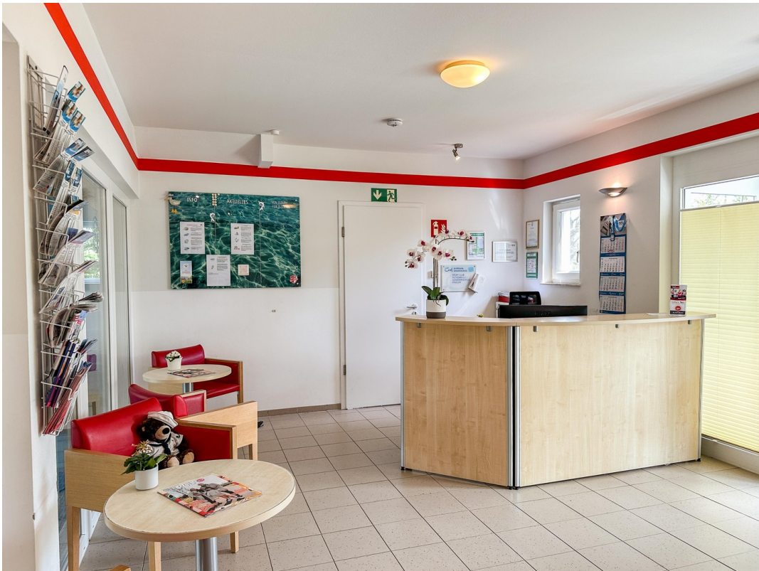
Empfang im EG