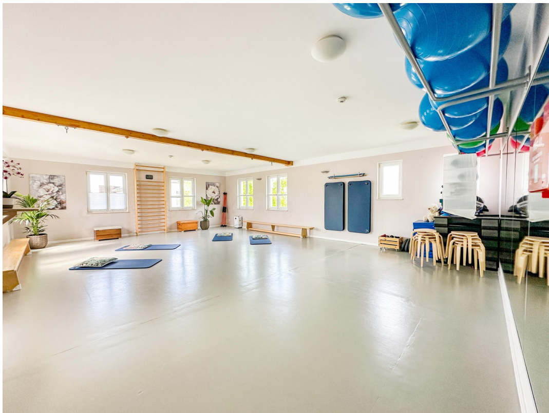
Sportraum im OG