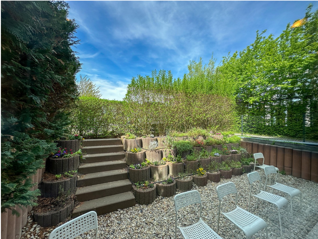
Terrasse im EG