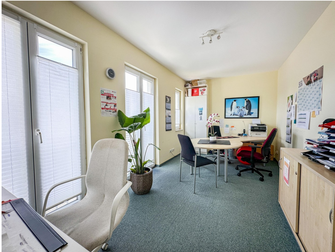
Büro im OG