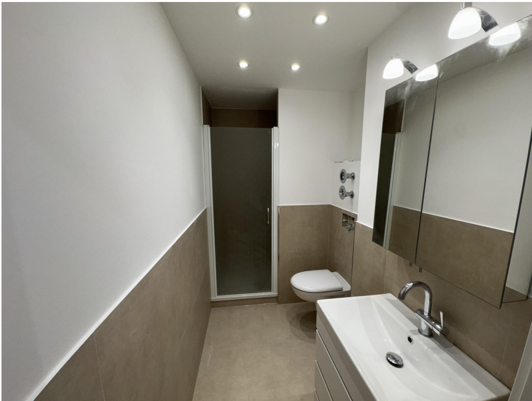
Badezimmer mit Spots