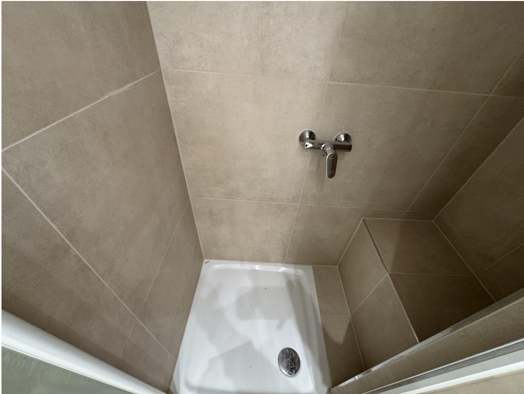
Dusche mit Ablage