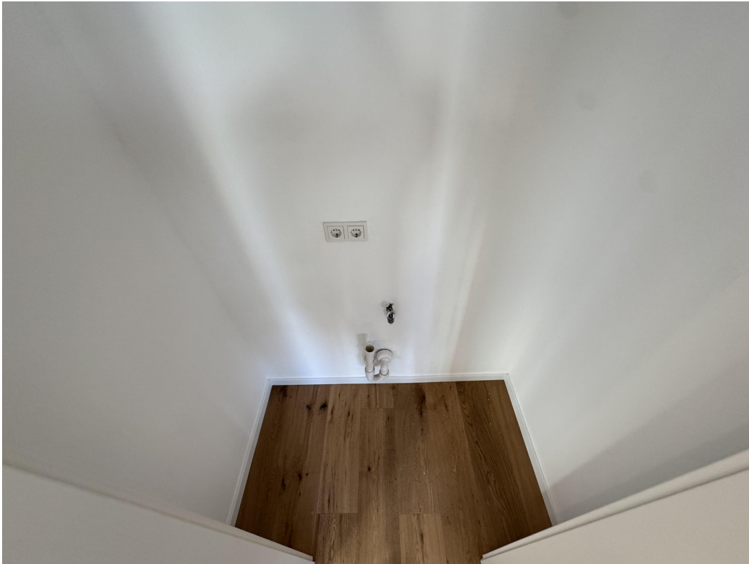
Abstellraum & Waschmaschine