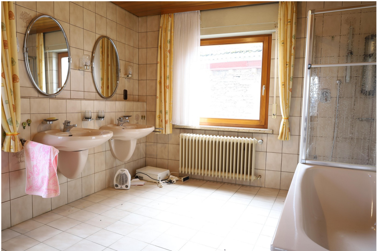
2. OG Bad Foto 1