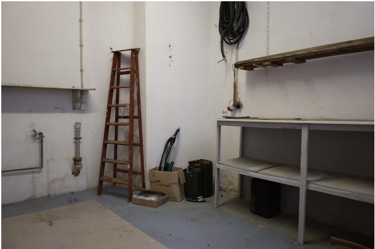
Anbau Foto 1