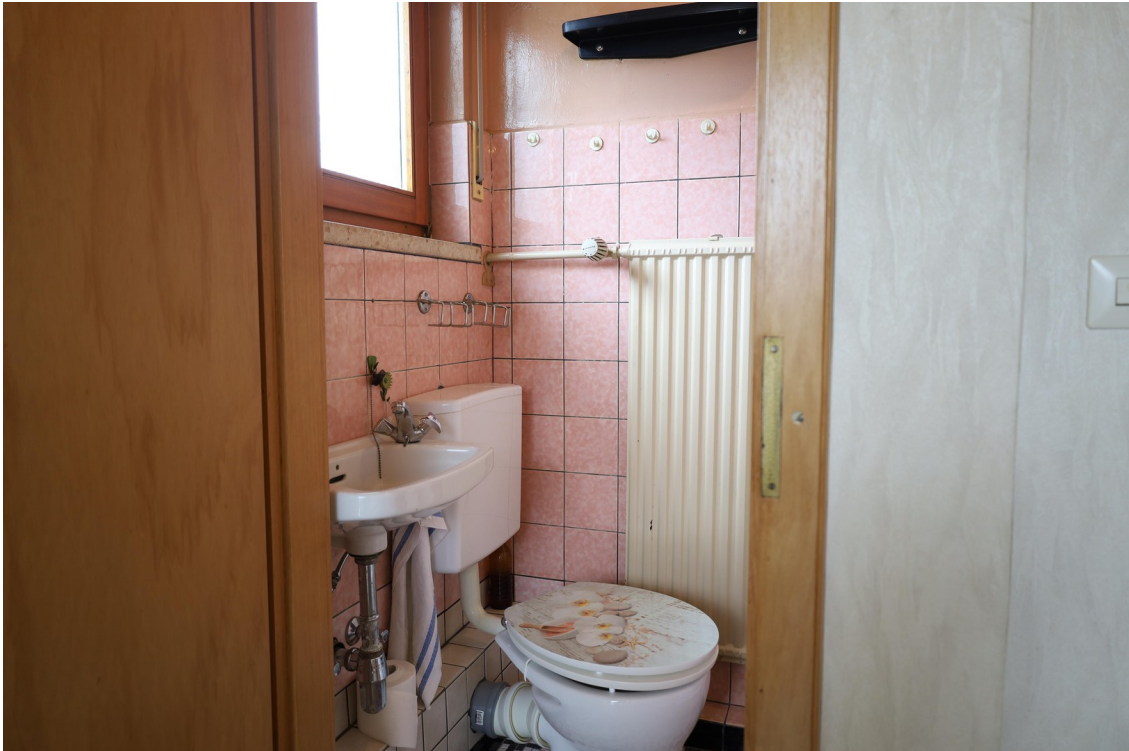
2. OG Dusche u. WC Foto 1