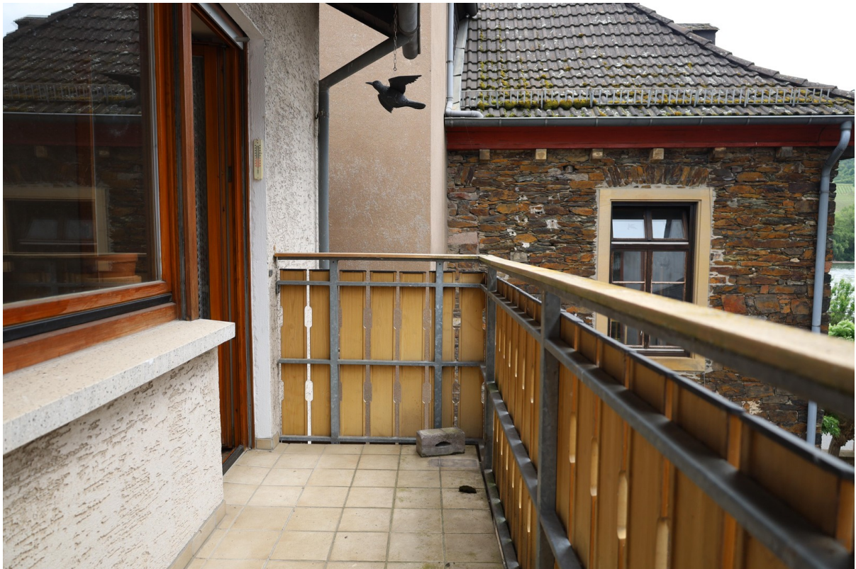
2. OG Balkon Foto 1