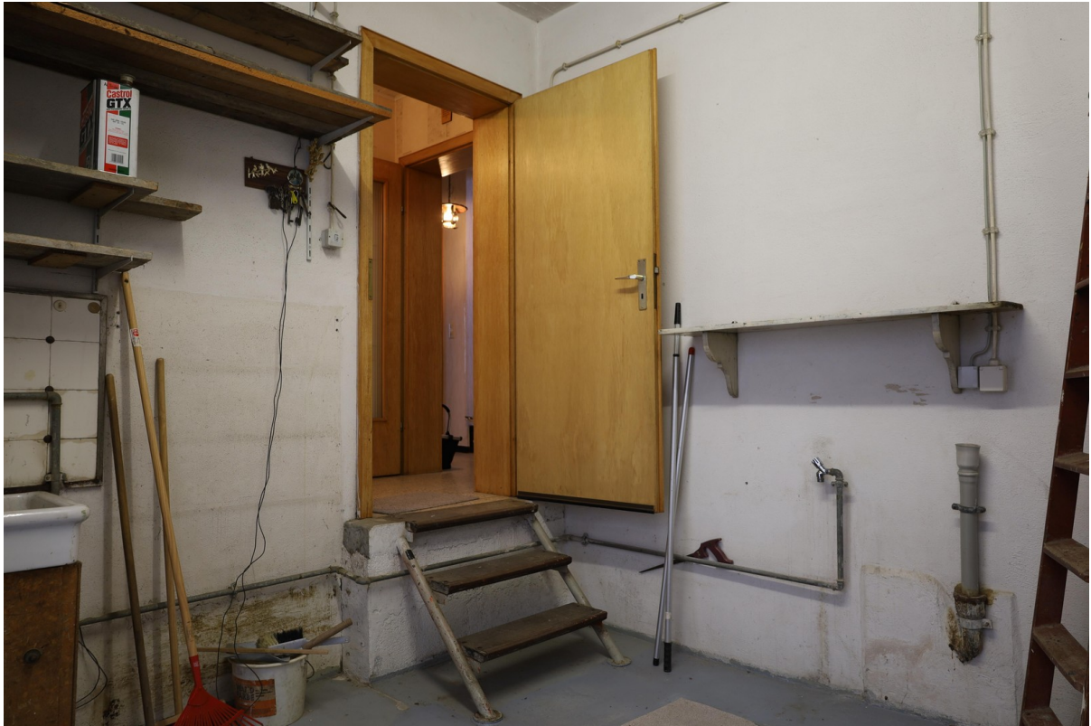
Anbau Foto 2