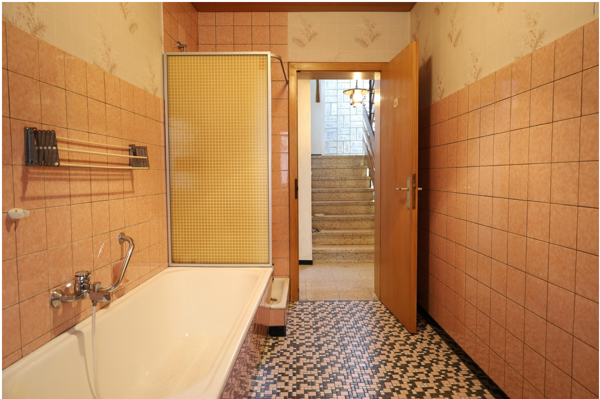
EG Bad Foto 2