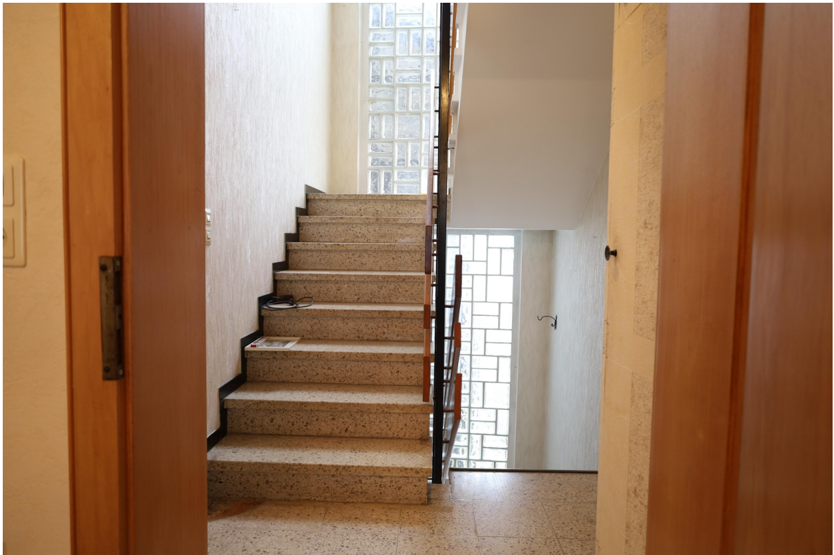
1. OG Treppenhaus