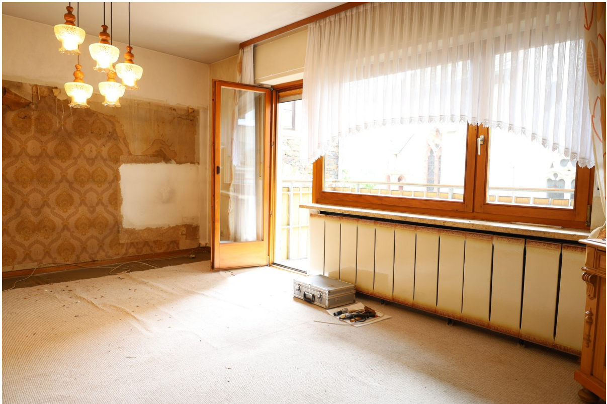
1. OG Wohnzimmer Foto 1