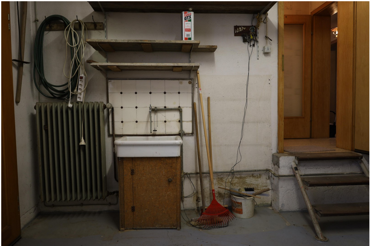
Anbau Foto 3