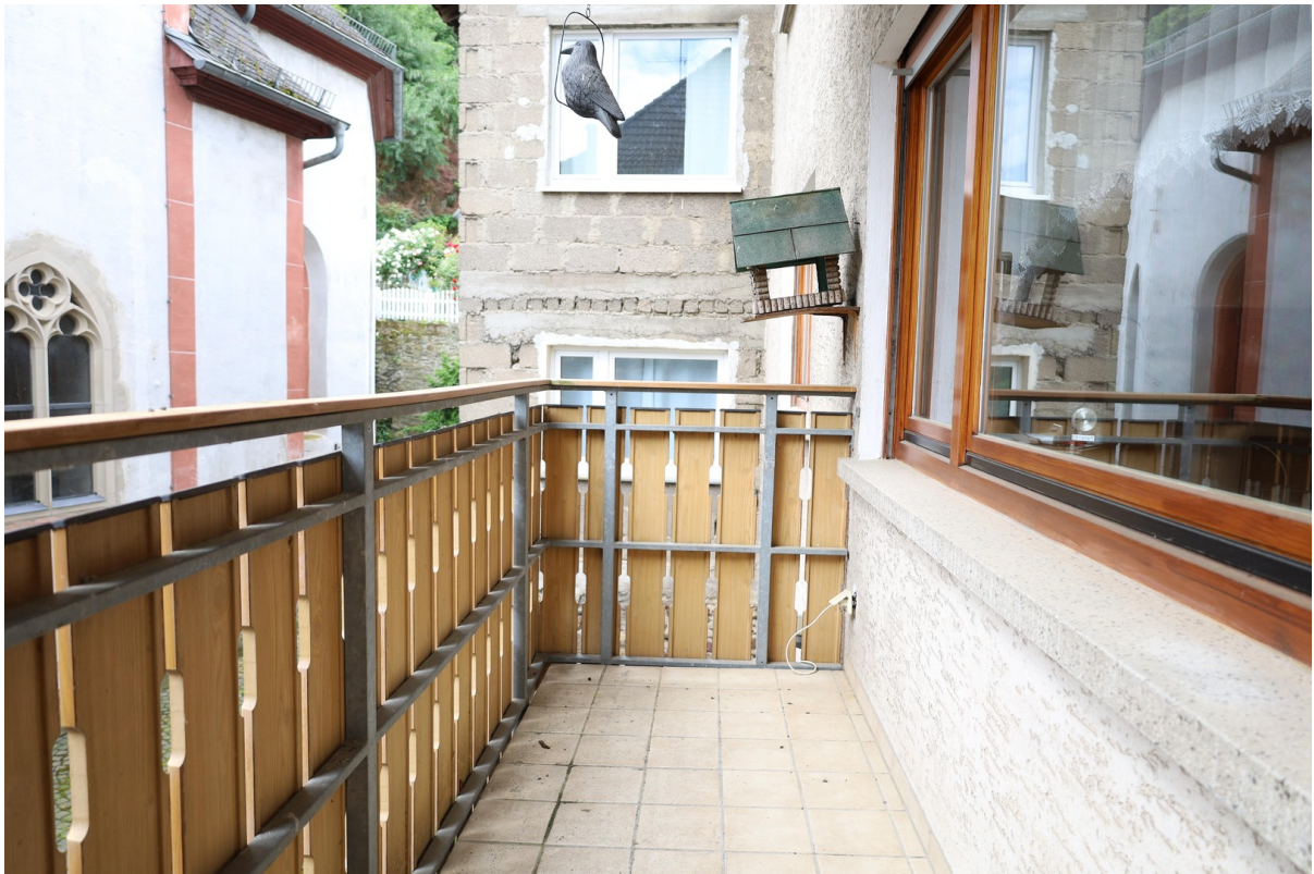
1. OG Balkon Foto 1