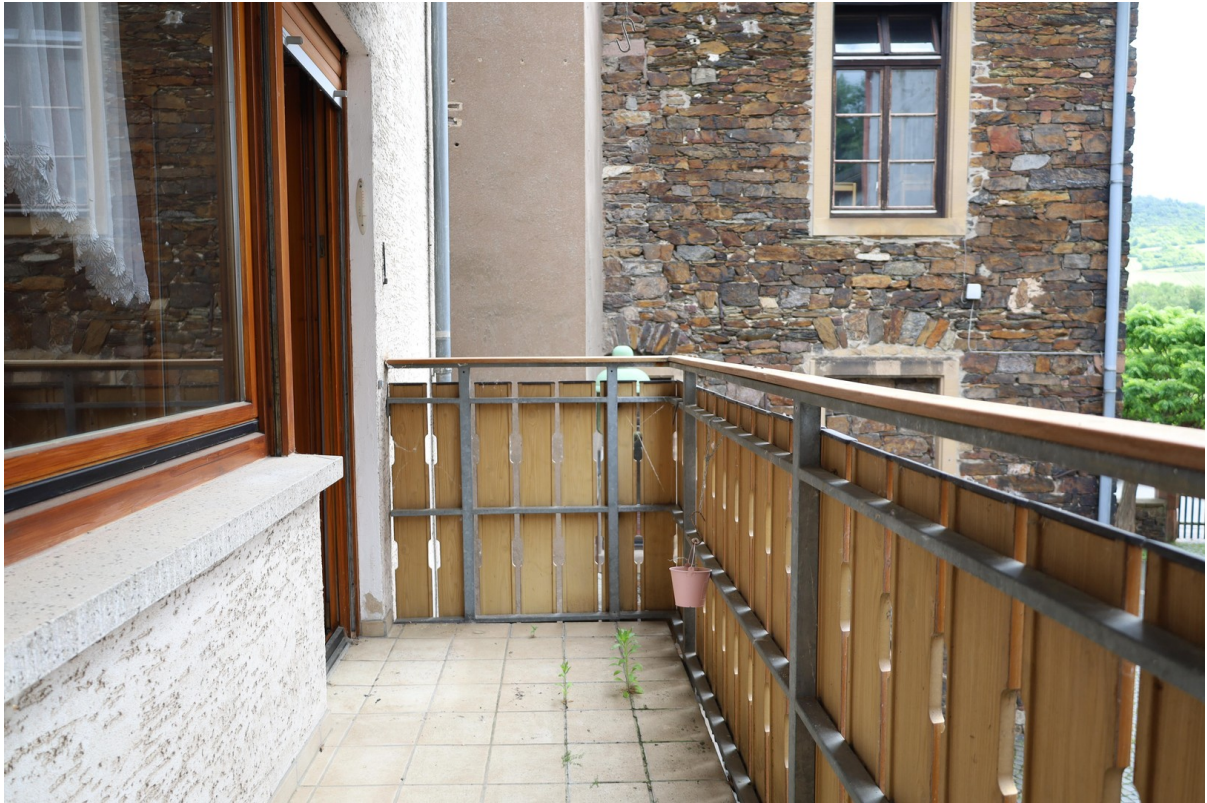
1. OG Balkon Foto 2