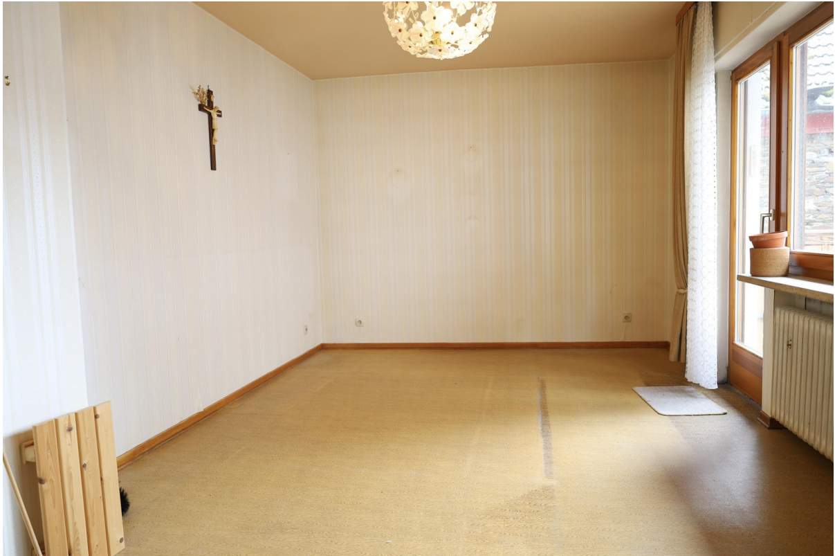
2. OG Wohnzimmer Foto 2