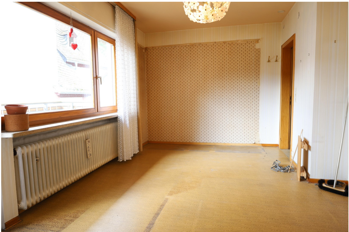
2. OG Wohnzimmer Foto 3