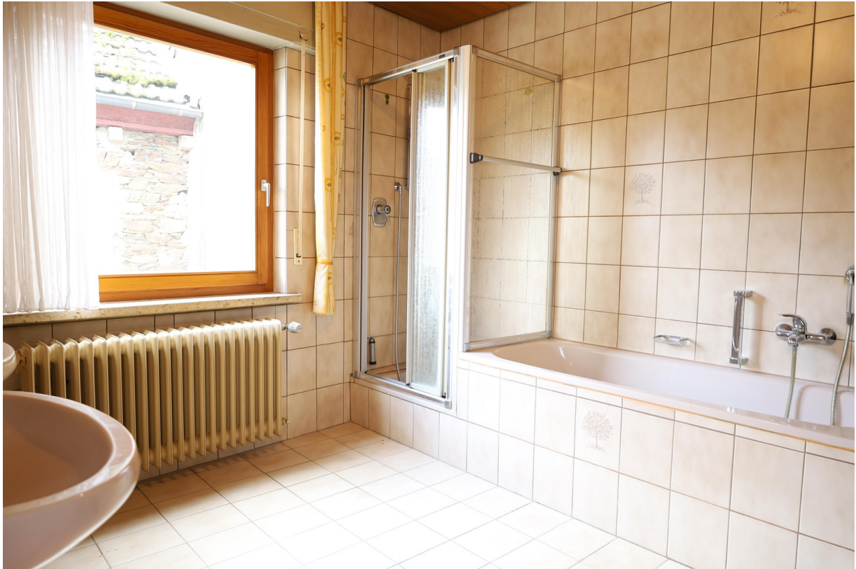
2. OG Bad Foto 3