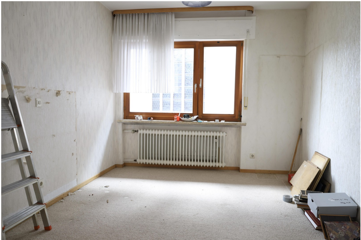
2. OG Schlafzimmer Foto 1