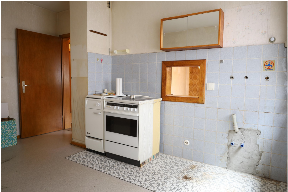
1. OG Küche