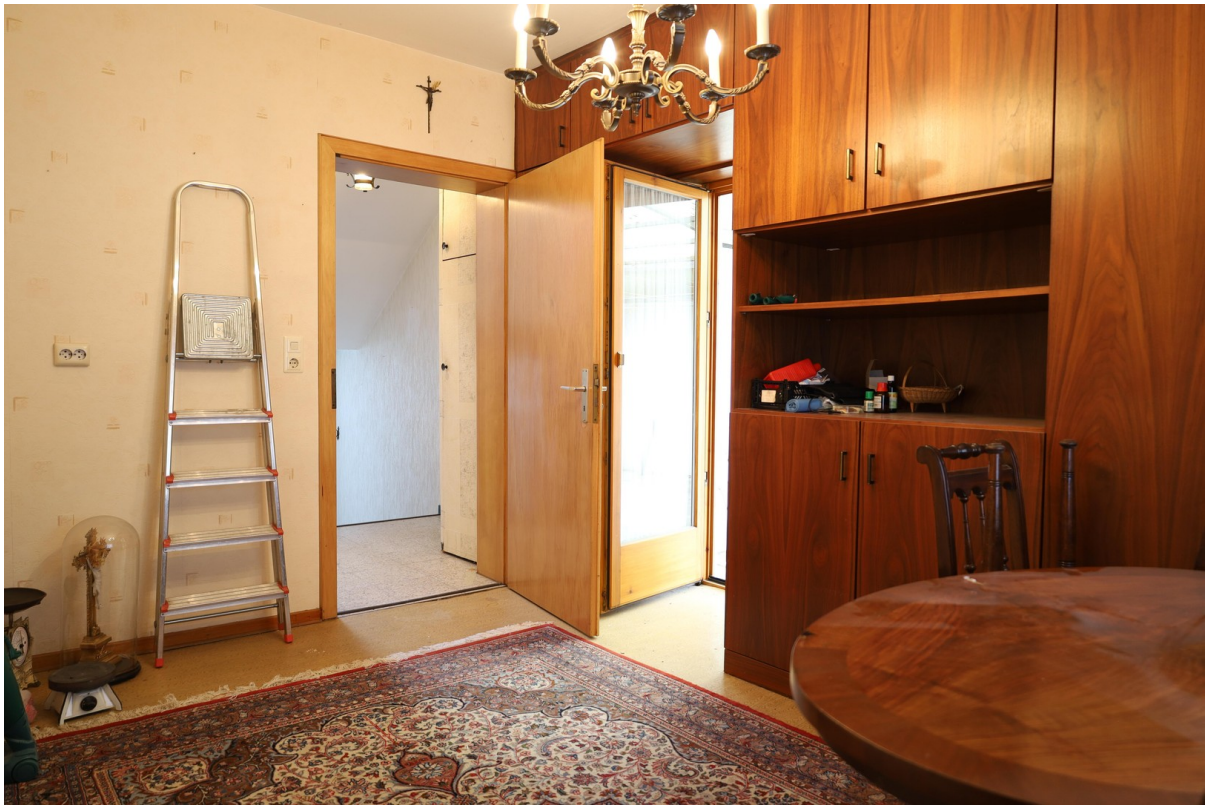
1. OG Schlafzimmer