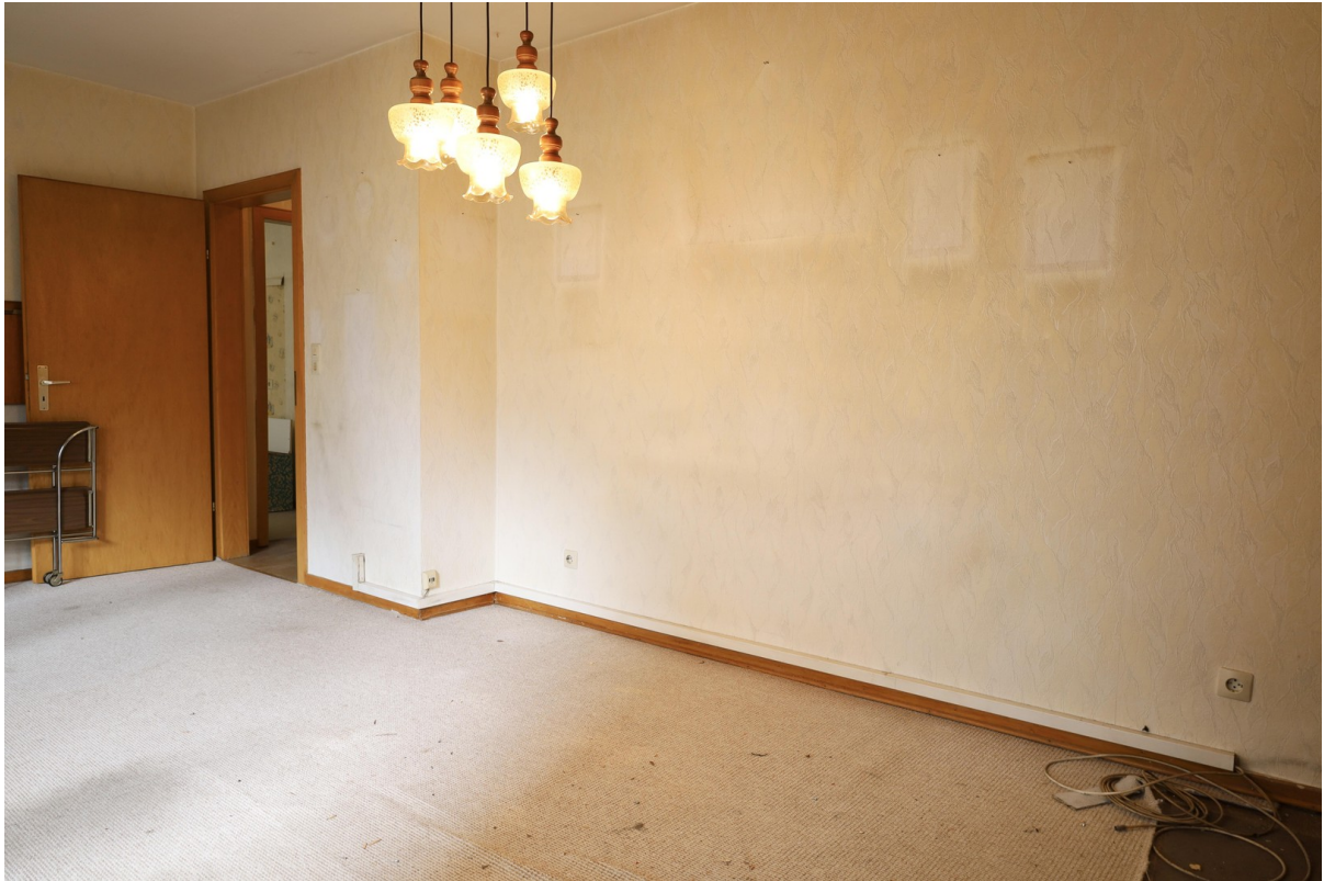
1. OG Wohnzimmer Foto 2