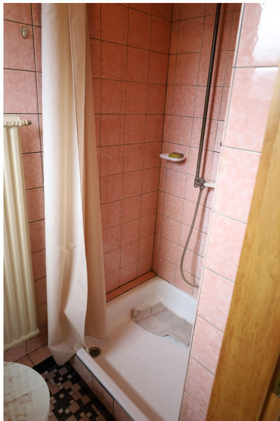
2. OG Dusche u. WC Foto 2