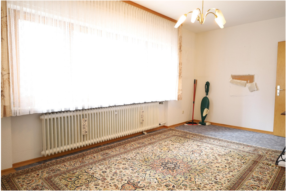
EG Wohnzimmer Foto 1