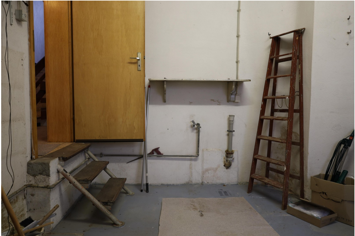
Anbau Foto 4