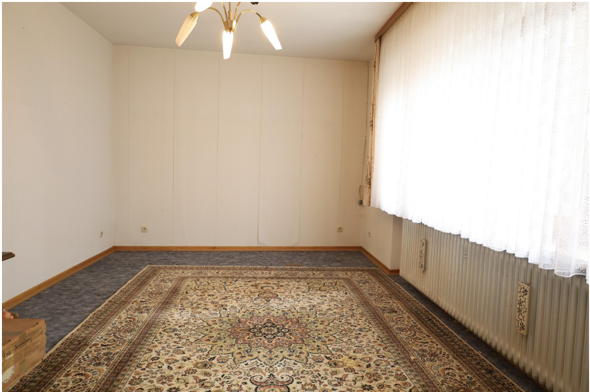
EG Wohnzimmer Foto 2