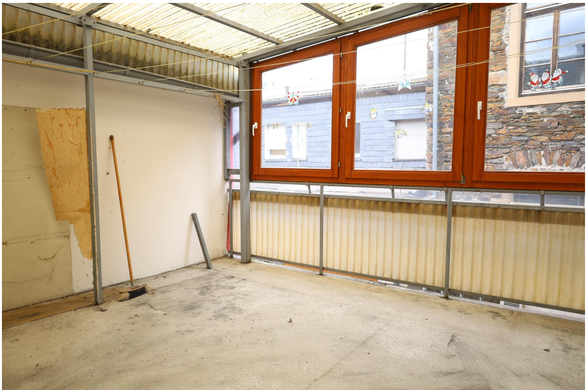
1. OG Wintergarten