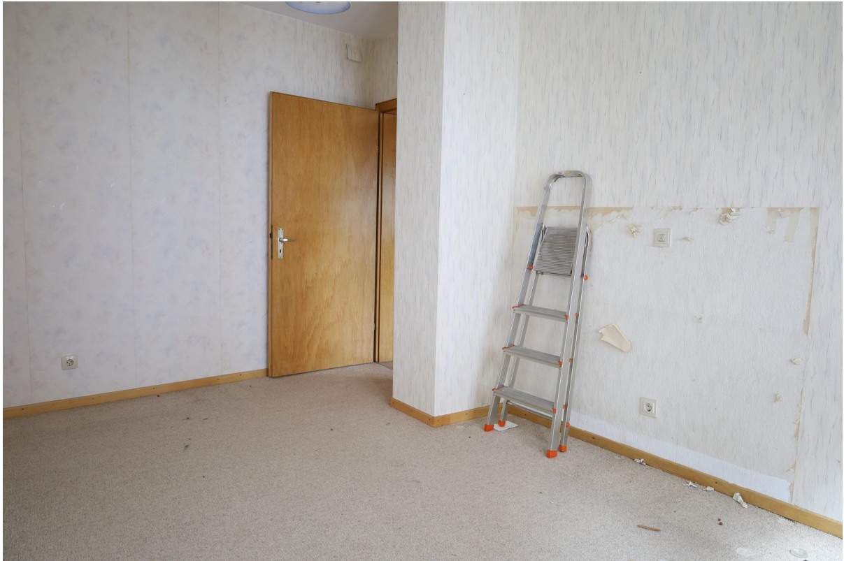
2. OG Schlafzimmer Foto 2