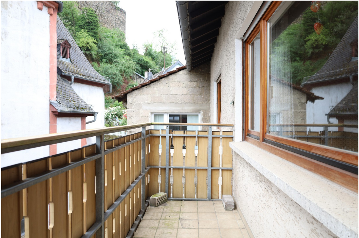
2. OG Balkon Foto 1