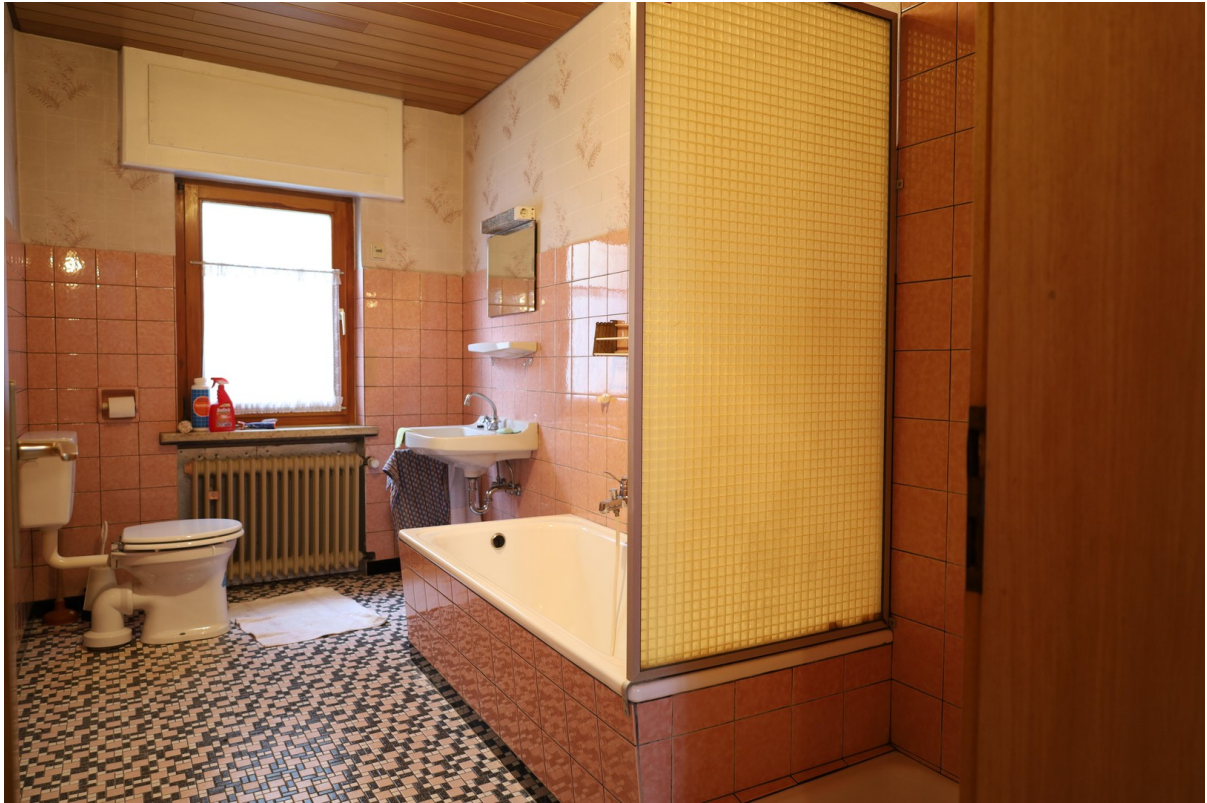
EG Bad Foto 1