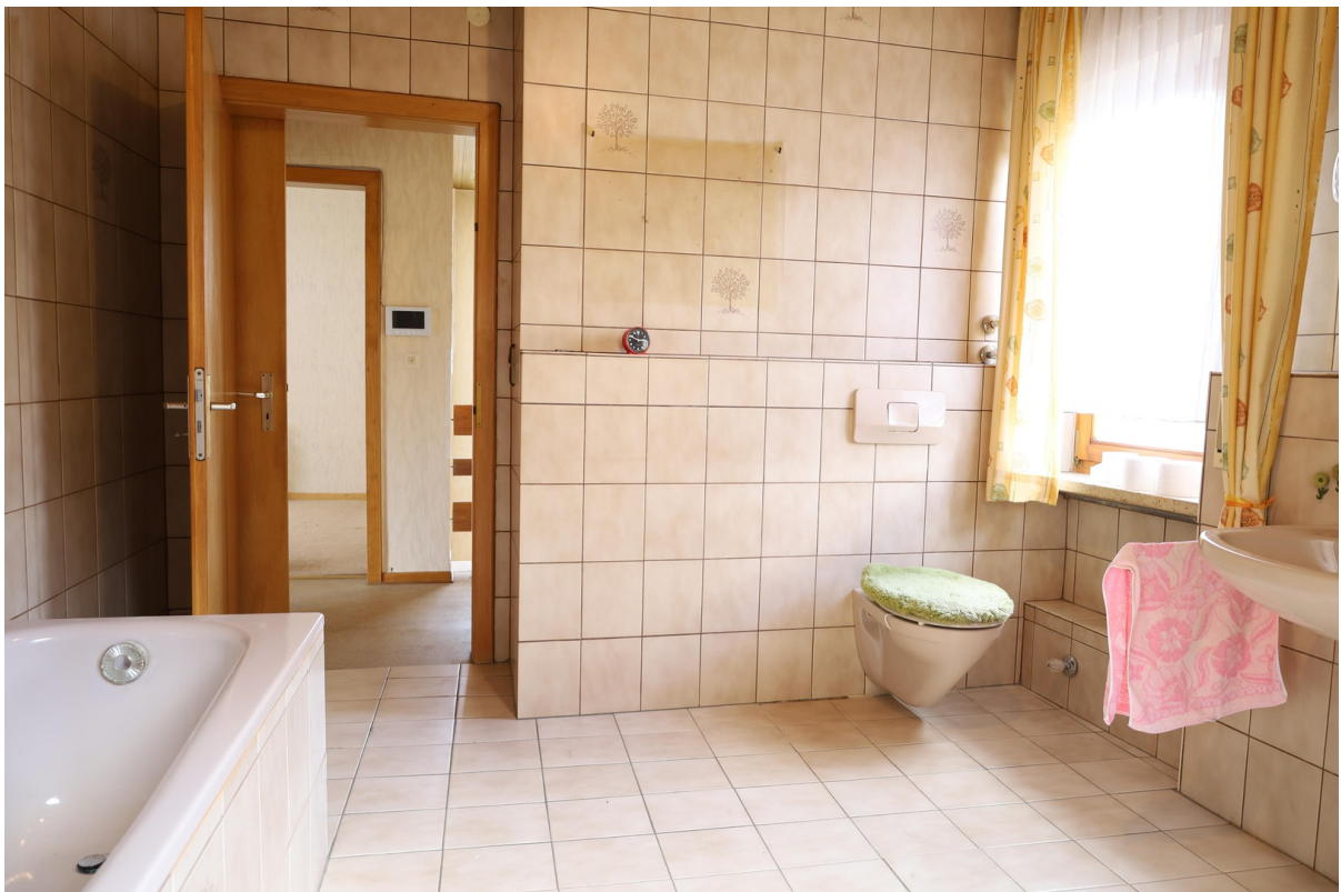
2. OG Bad Foto 2