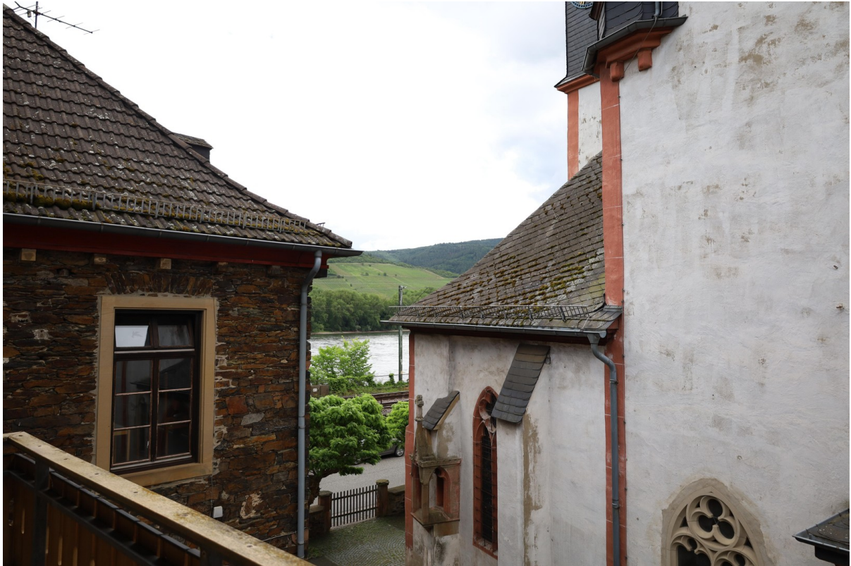
2. OG Ausblick