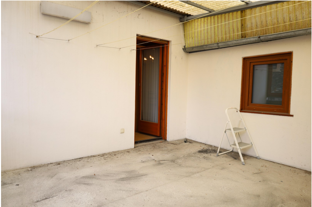
1. OG Wintergarten