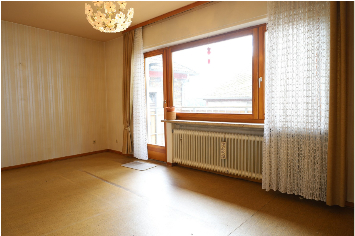
2. OG Wohnzimmer Foto 1