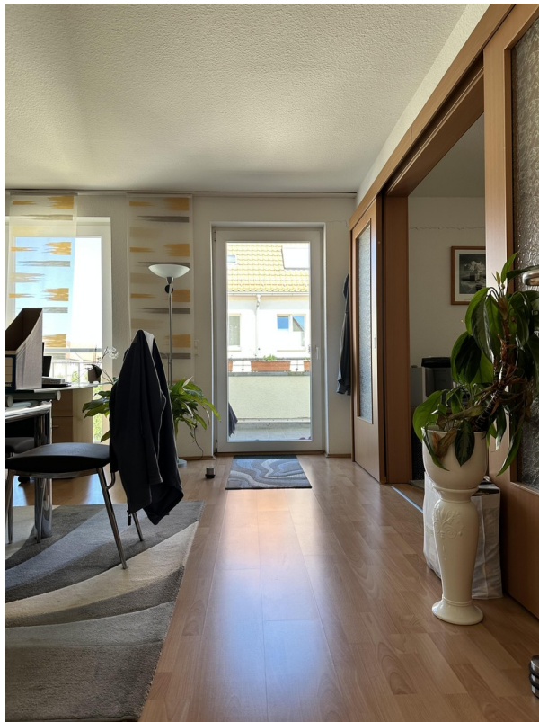
Zugang zum Balkon