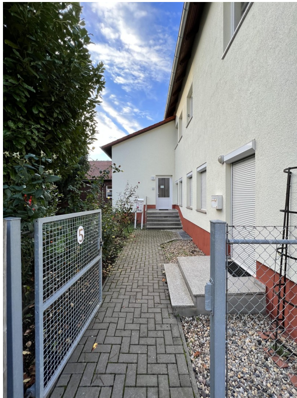
Eingang zum Wohnhaus