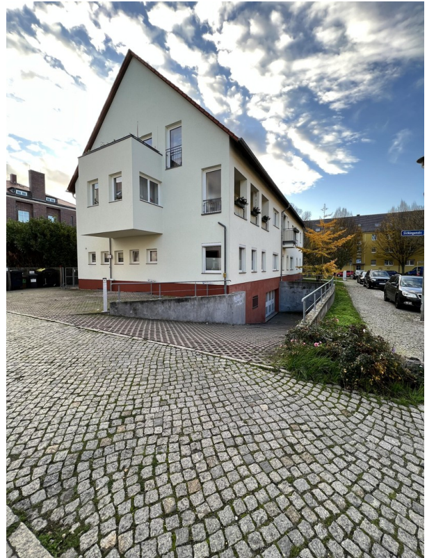
Zufahrt zur Tiefgarage