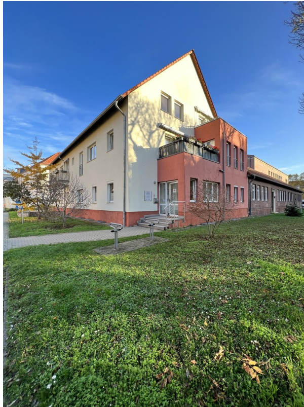
Straßenfront des Hauses