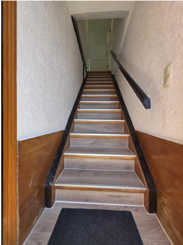
Treppe zur Wohnung