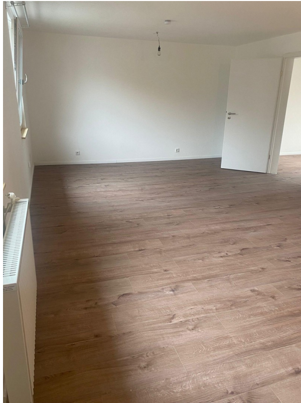
Geräumiges, großes Wohnzimmer