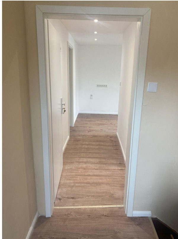
Eingang ETW und Flur