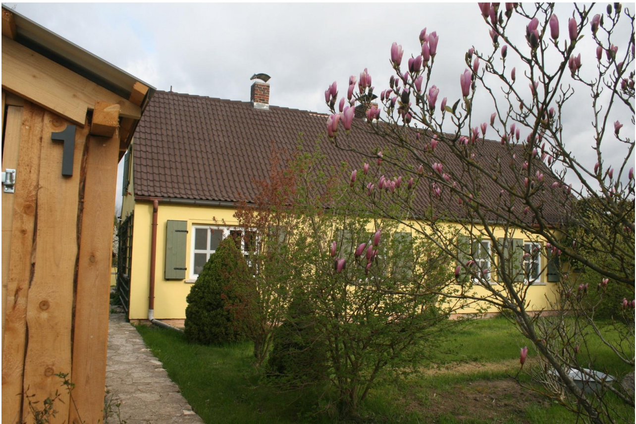
Gartenweg von Garage