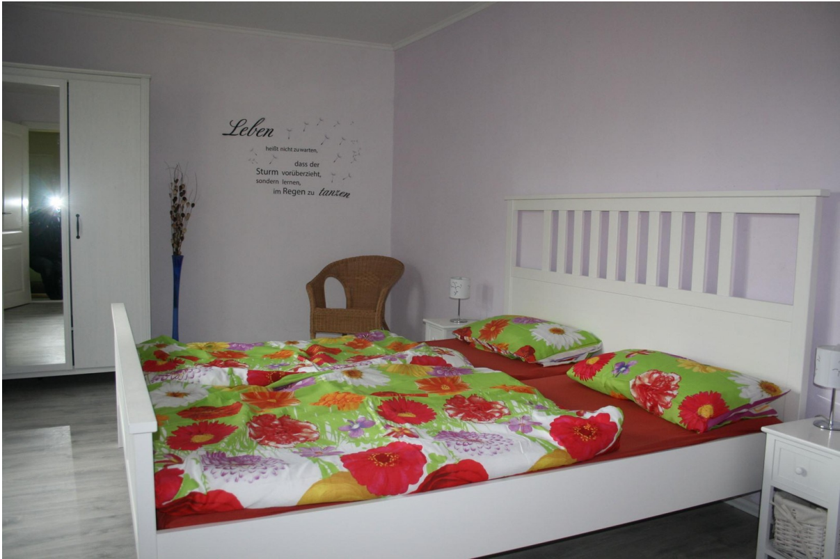
Haupthaus Schlafzimmer EG