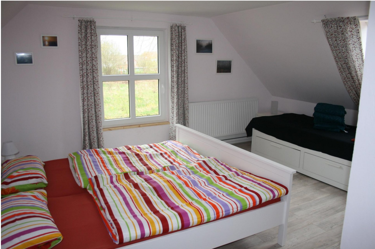
Haupthaus Schlafzimmer OG