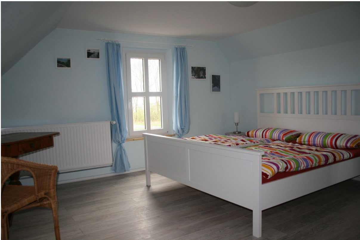
Haupthaus Schlafzimmer OG