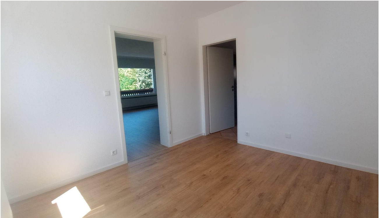
Zimmer 1 (2)