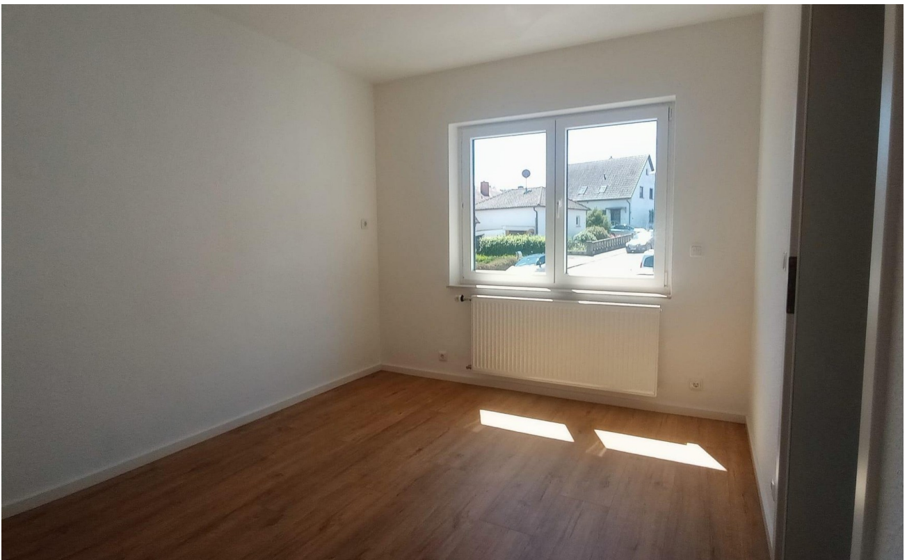
Zimmer 1 (1)