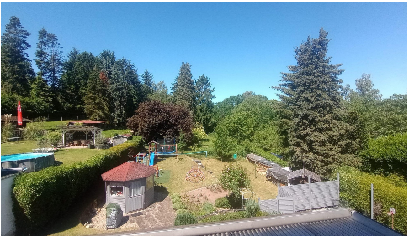
Ausblick (Balkon u. Schlafz.)