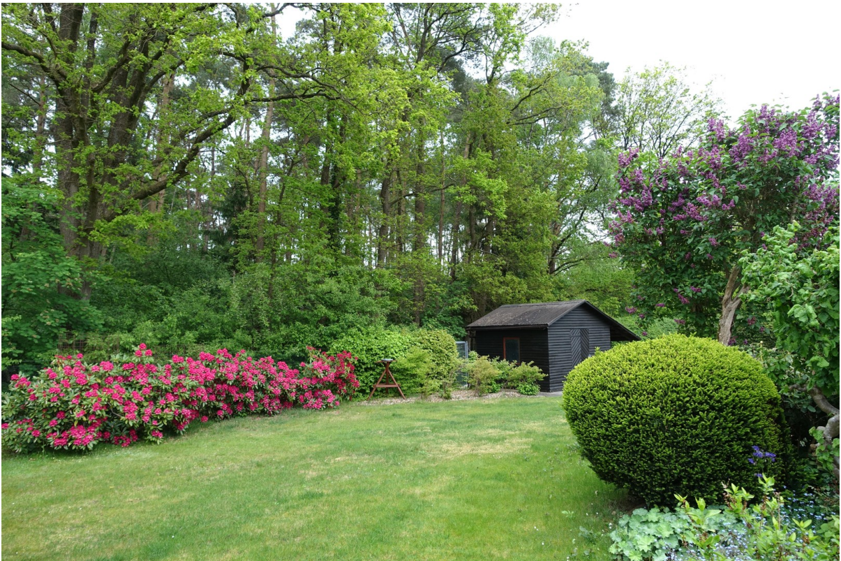
Garten, Schuppen, Waldrand