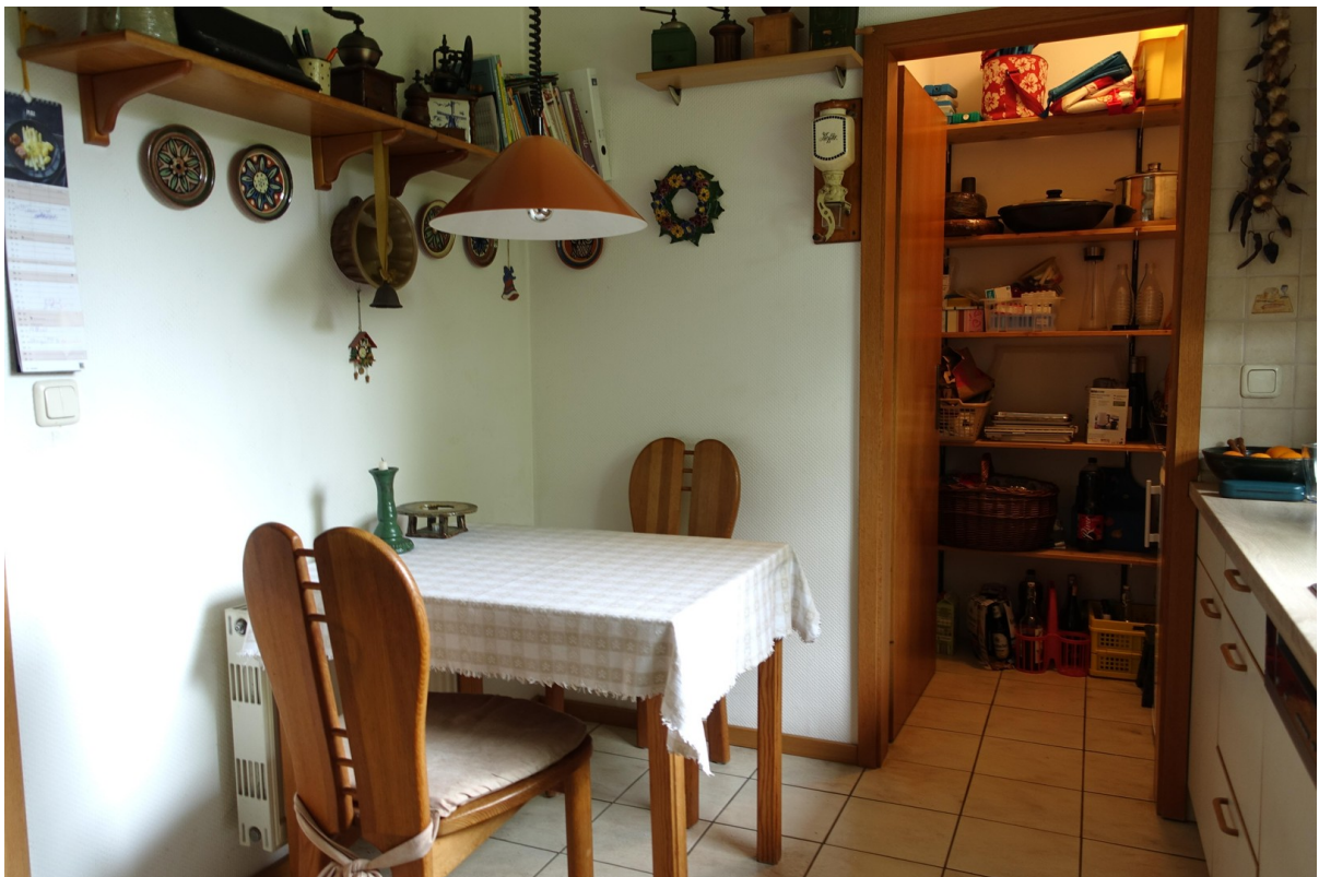
Essplatz und Speisekammer