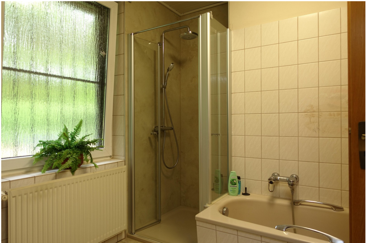
Dusche mit niedriger Kante