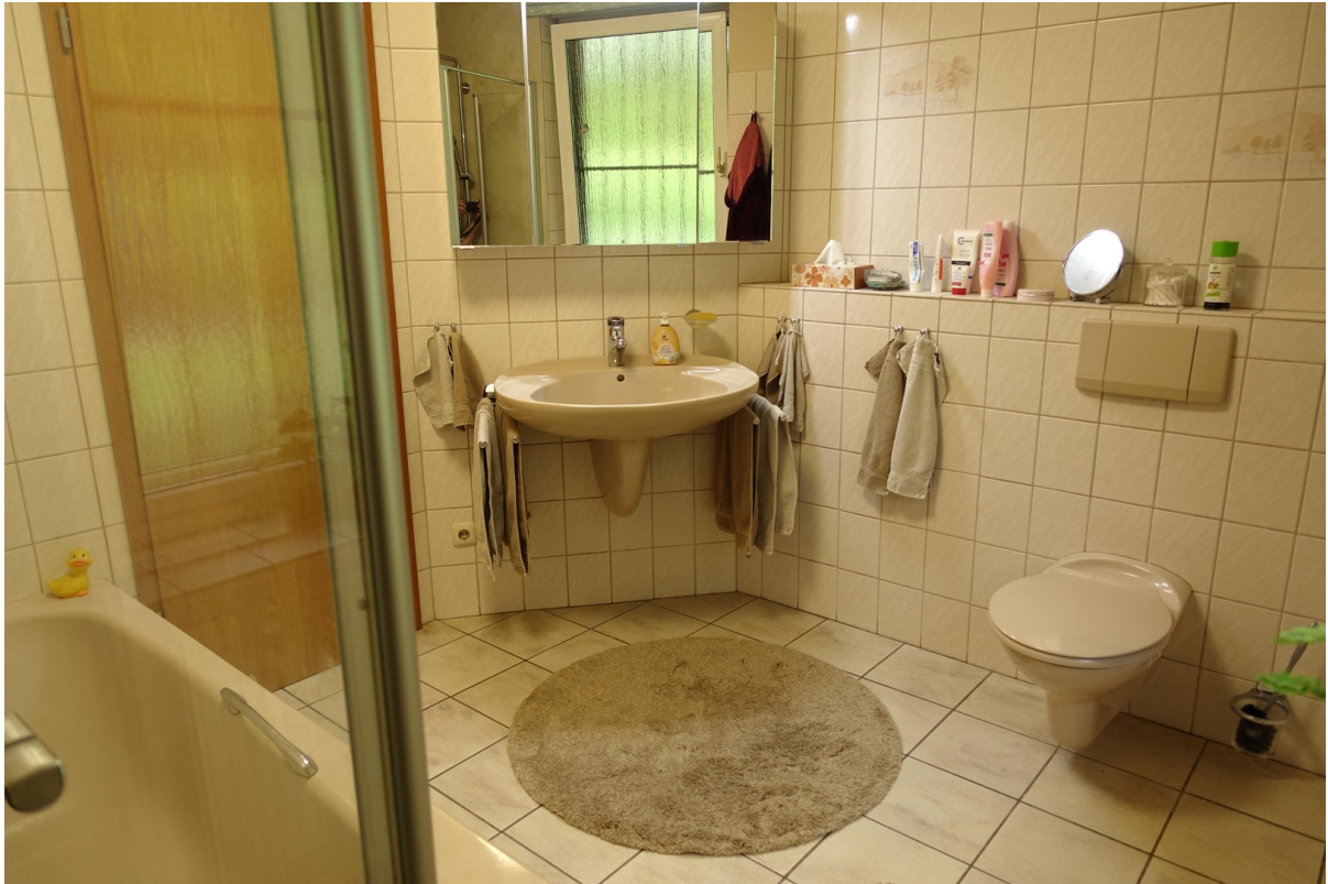
Waschplatz im Bad