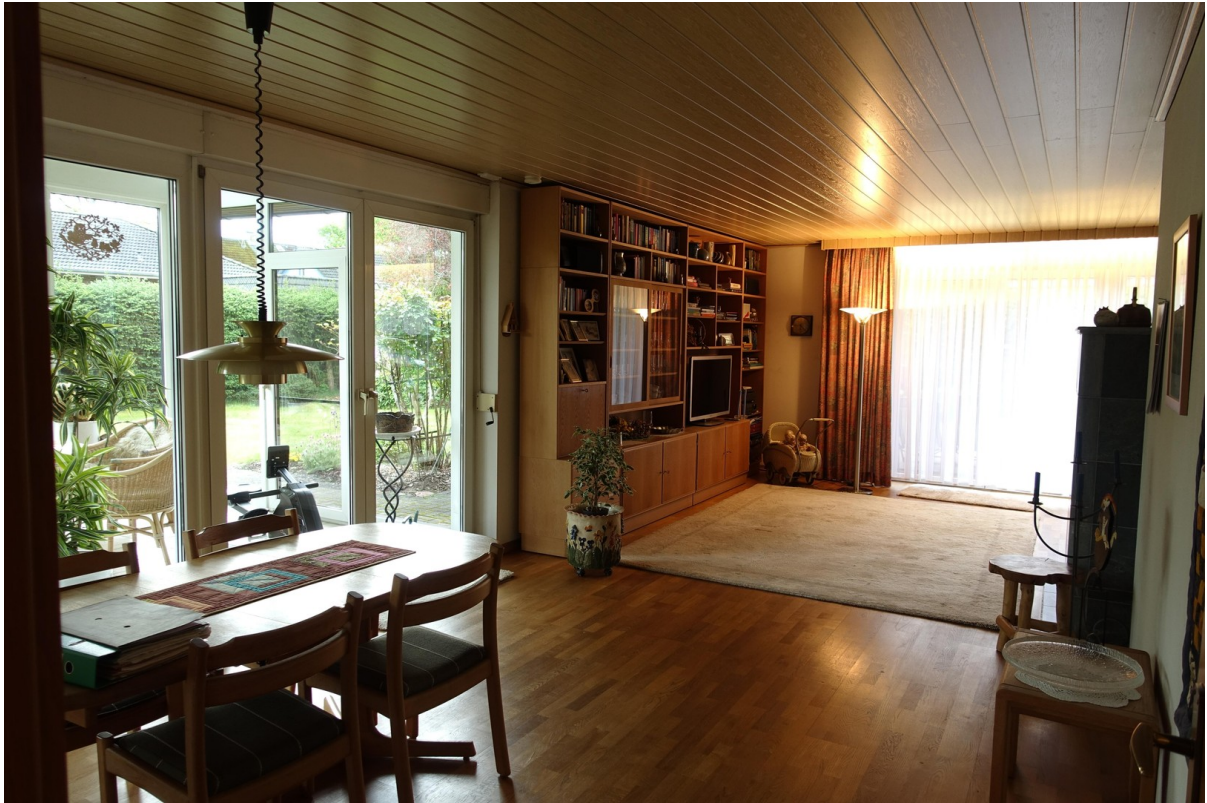
Essbereich zum Wintergarten