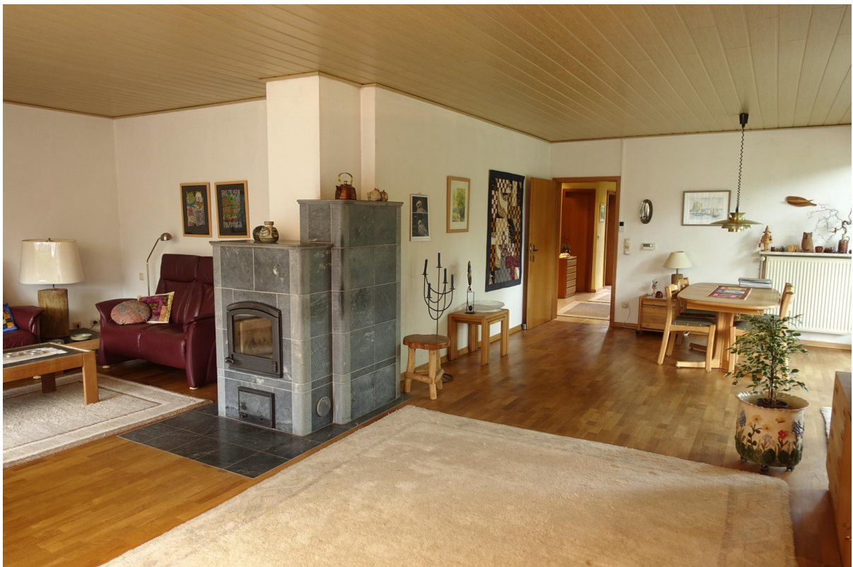
Specksteinofen und Parkett