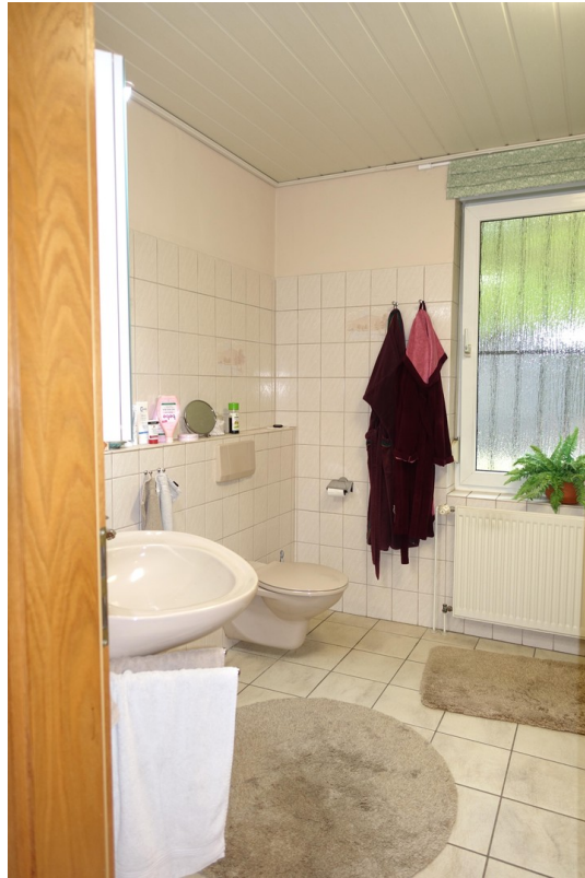
Großes Fenster im Bad