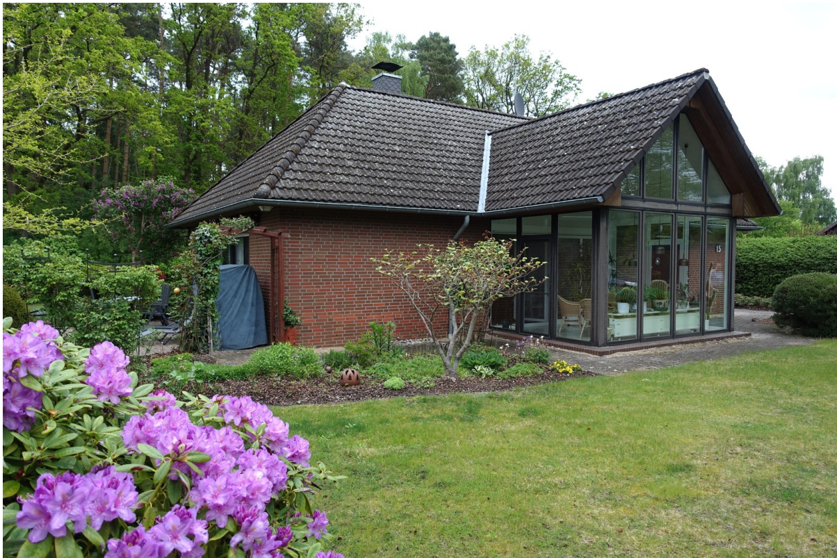
Wintergarten, großer Garten