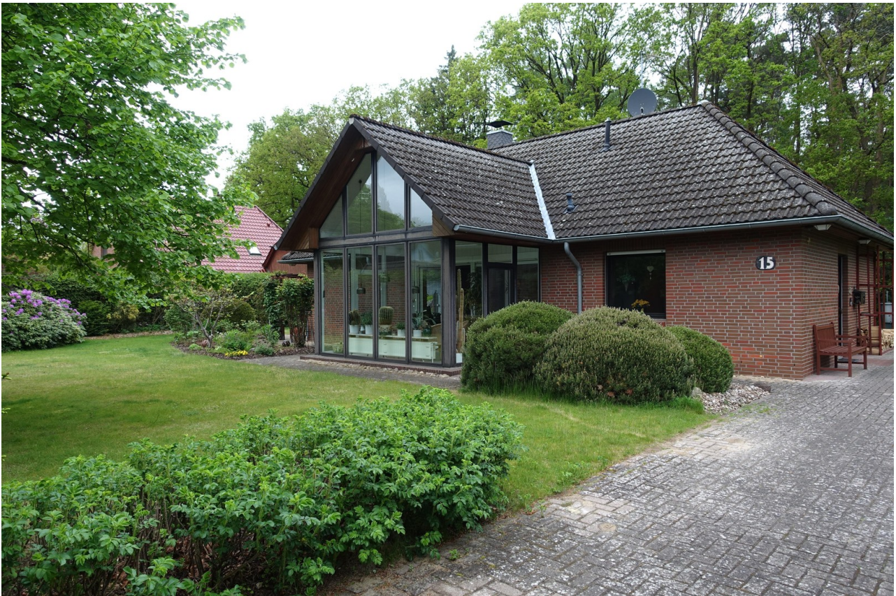
Wintergarten, Wald, Linde