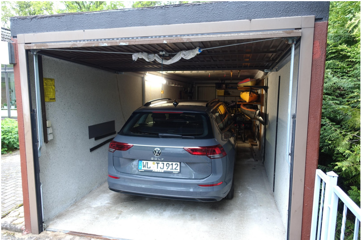
Garage für 2 Autos