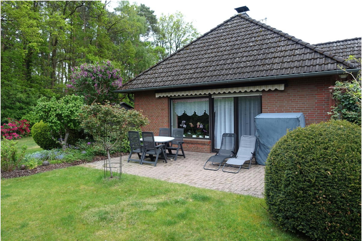
Terrasse mit Westausrichtung