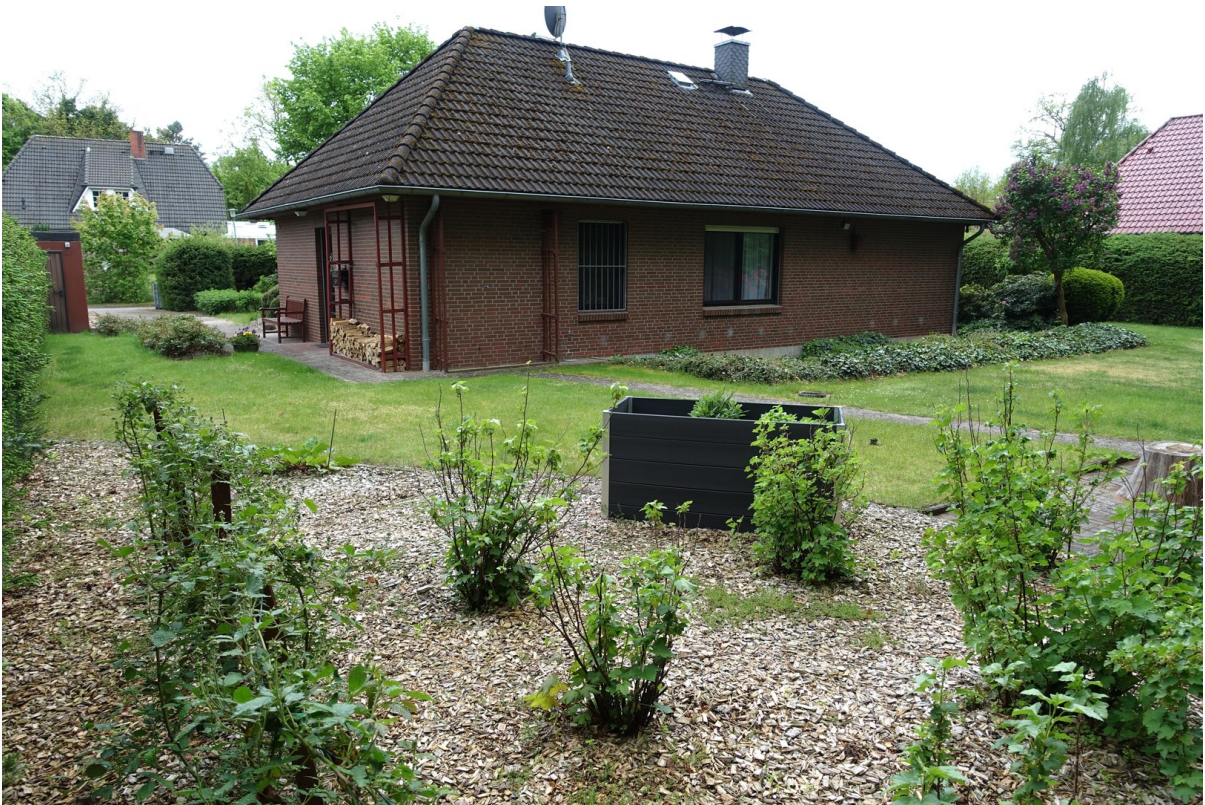
Eingang, Hochbeet, Beeren