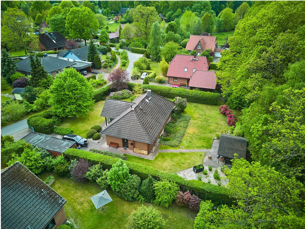
Viel Platz und Natur