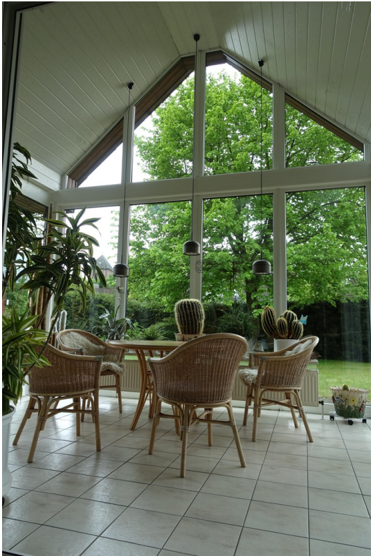
Vom Wintergarten zur Linde