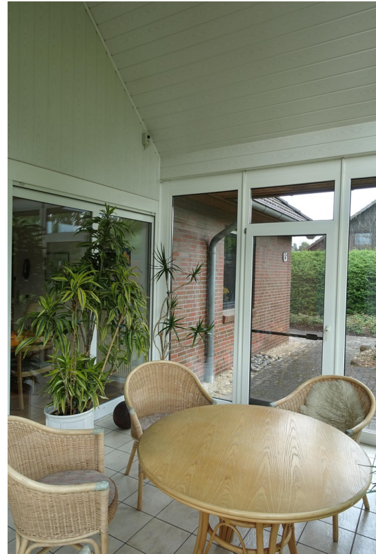
Blick zur Frühstücksterrasse