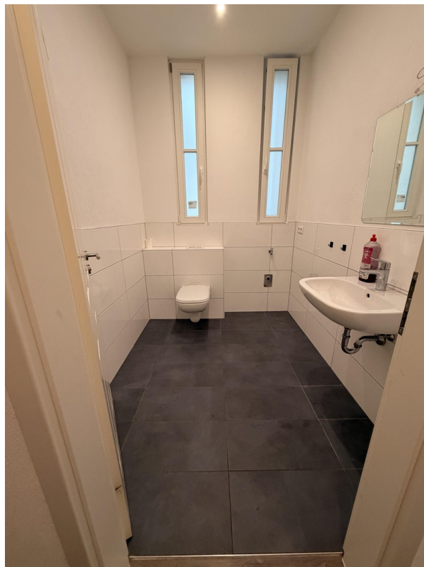
Dusche und WC