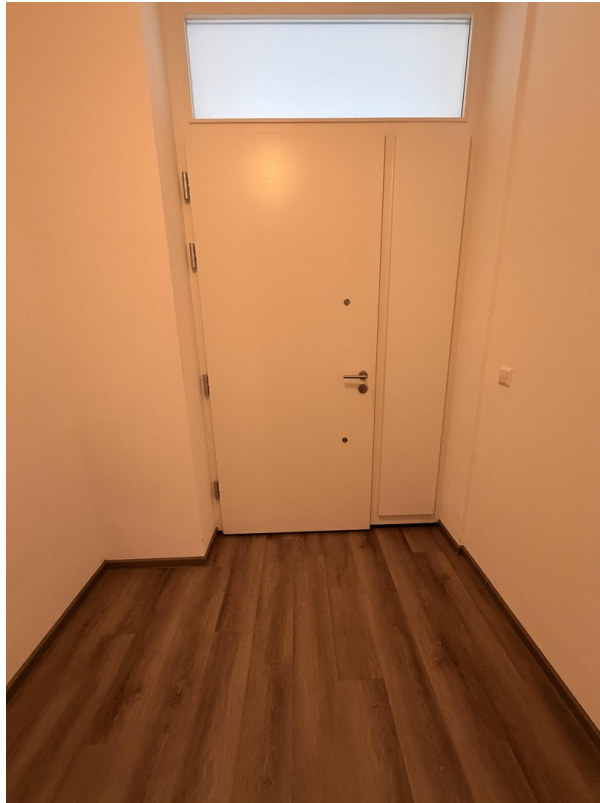
Eingangstüre von Innen