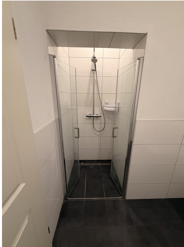
Dusche und WC