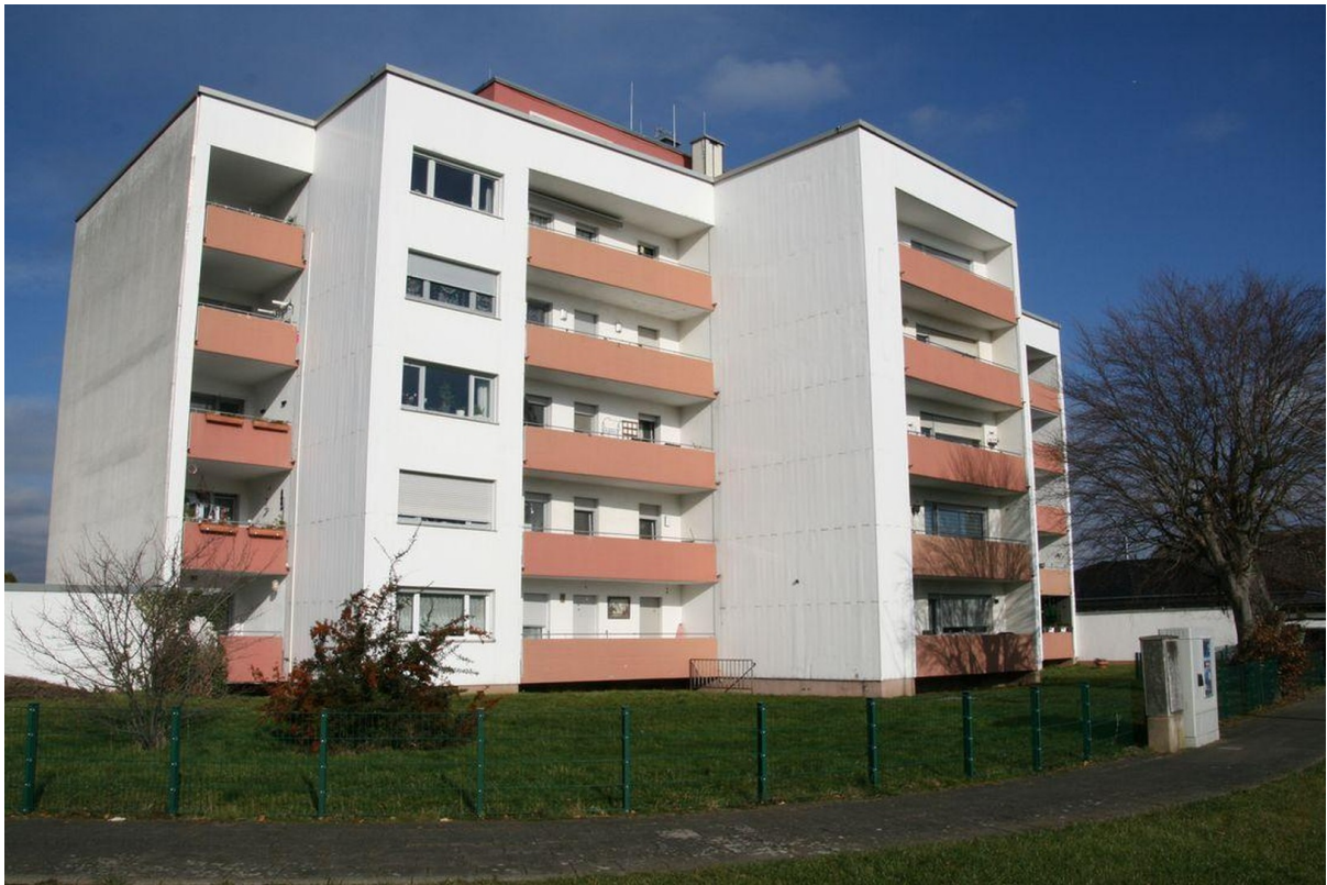
Rückseite Gebäude mit Balkone