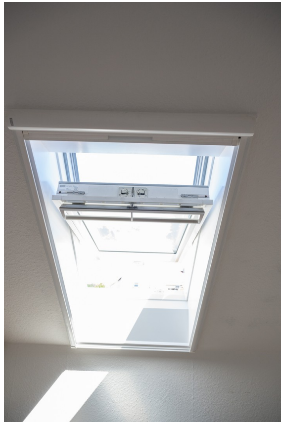
Schwenk-Kipp-Fenster Bild 2