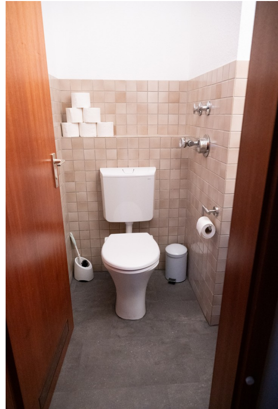
Gäste-WC Bild 2