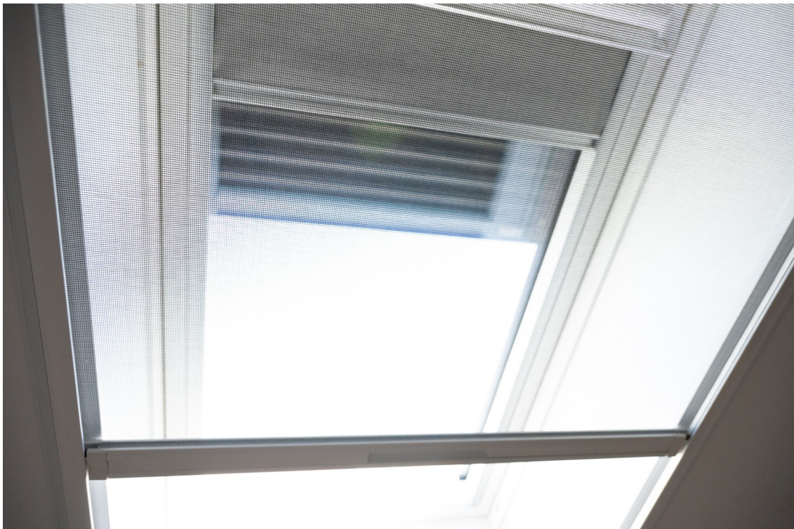
Dachfenster mit Details