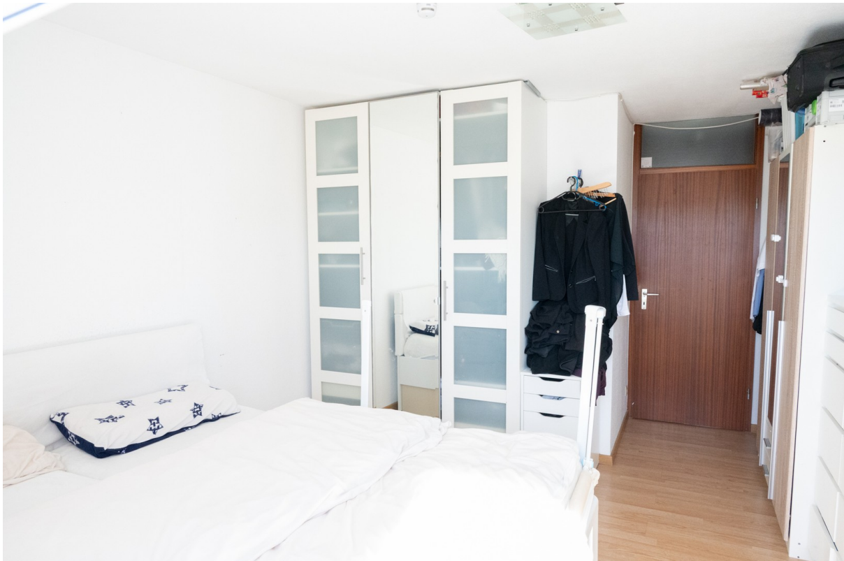
Schlafzimmer Bild 2