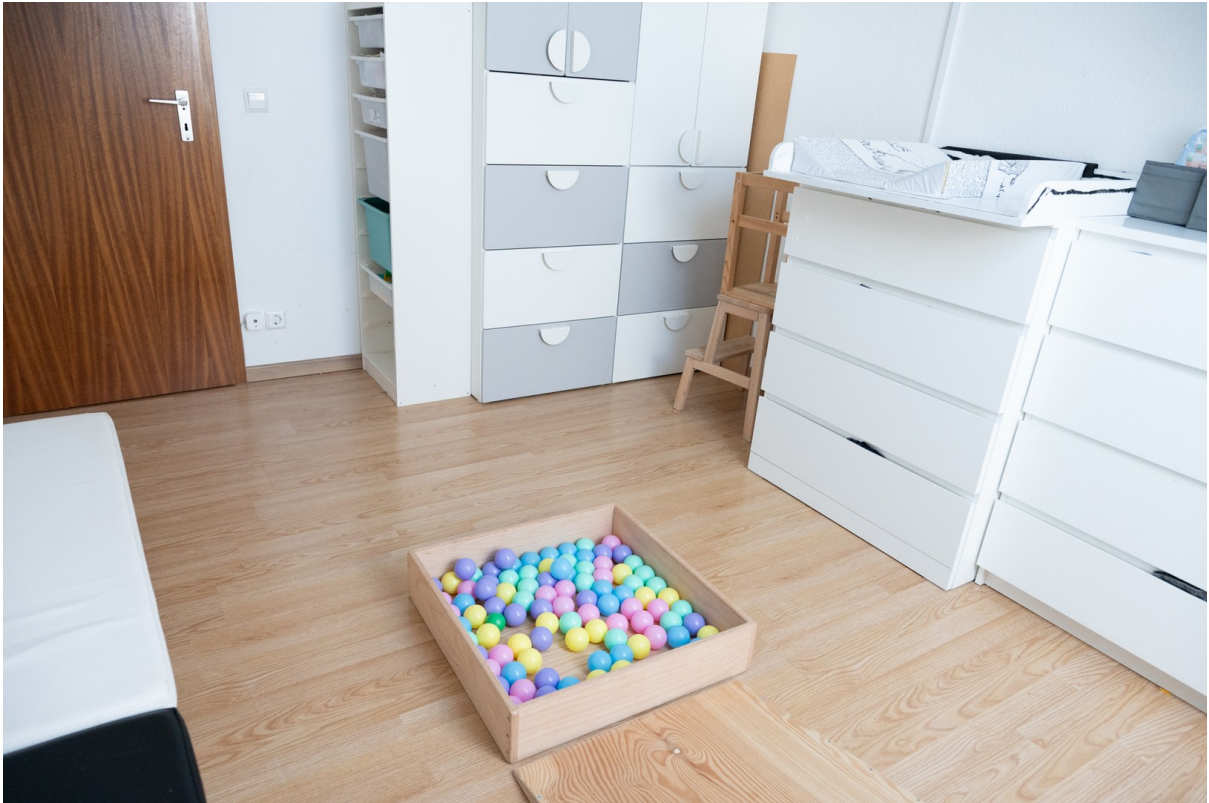
Kinder-/Gästezimmer Bild 2