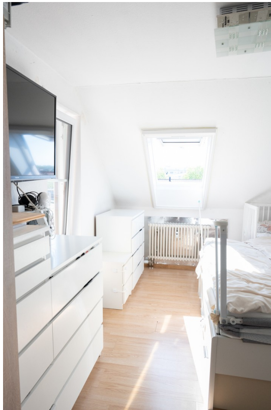
Schlafzimmer Bild 3