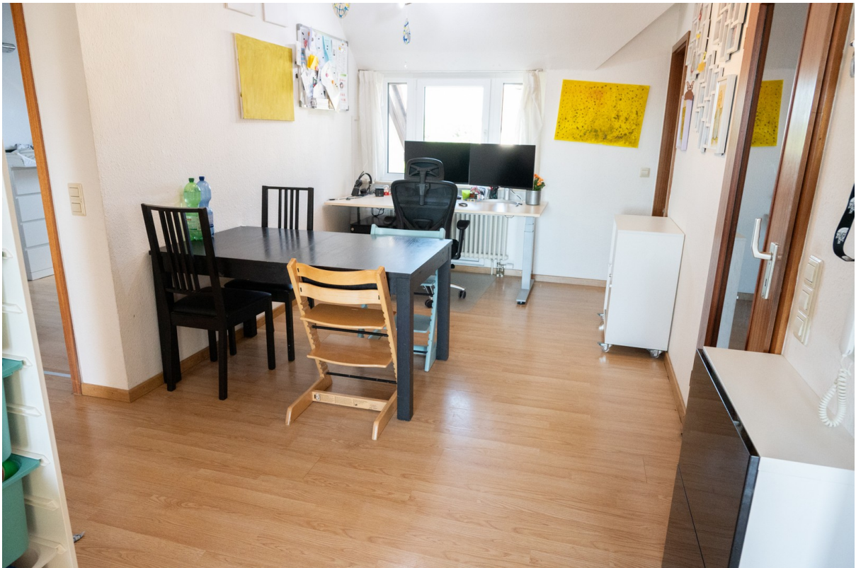
Essecke mit Schreibtisch