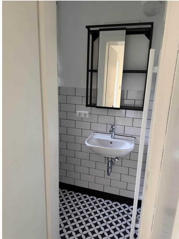
Bad und WC