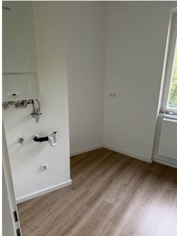
Küchewand gegenüber Zeile