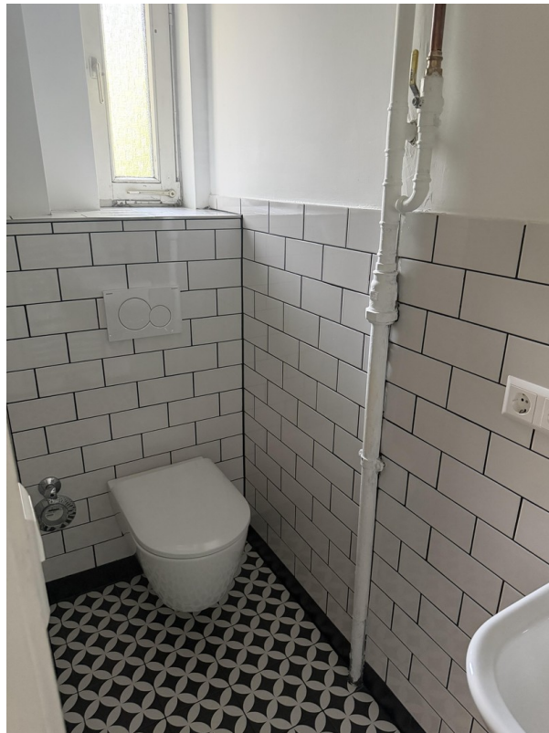
Bad und WC