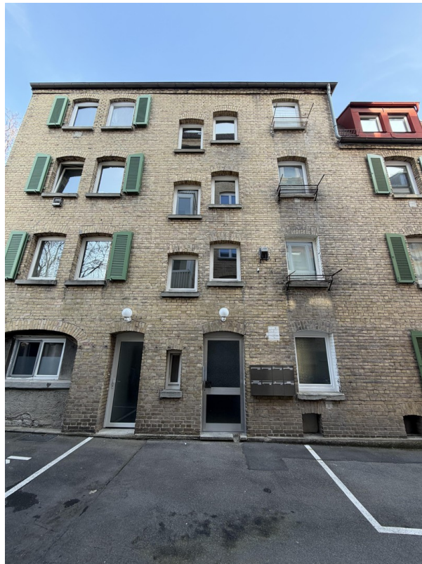
Haus von Außen