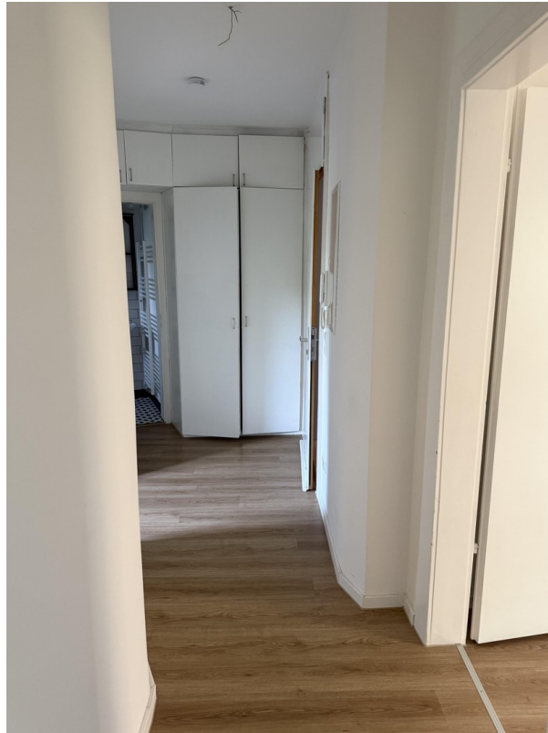
Flur Bild 2