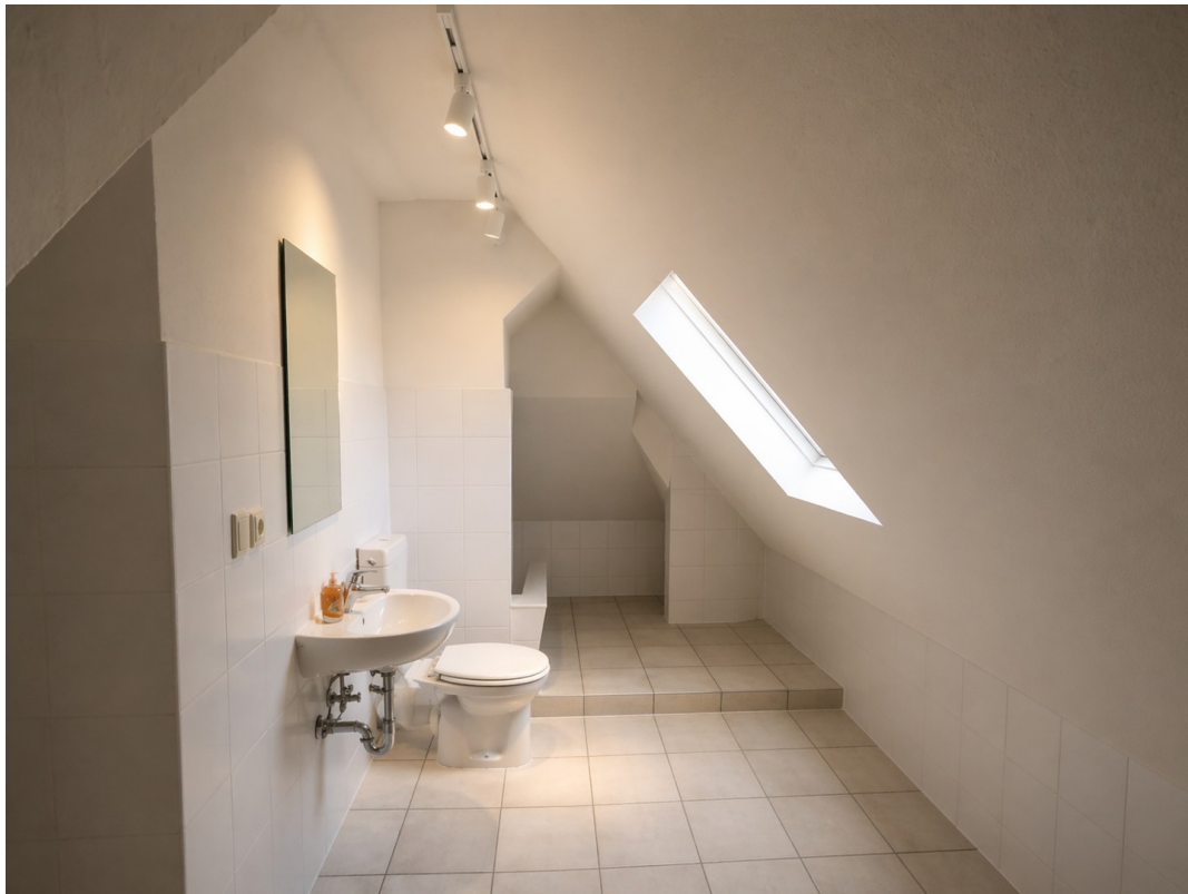
Bad mit KI Spiegel und Licht