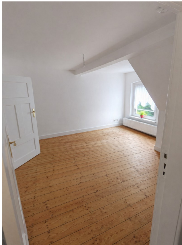
Wohnzimmer von Flur