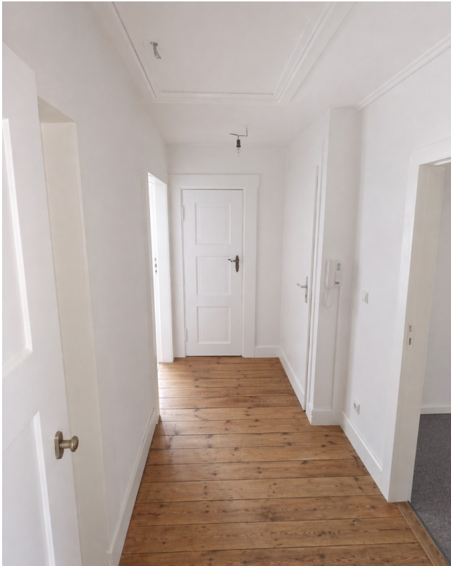
Flur - Blick aus Bad