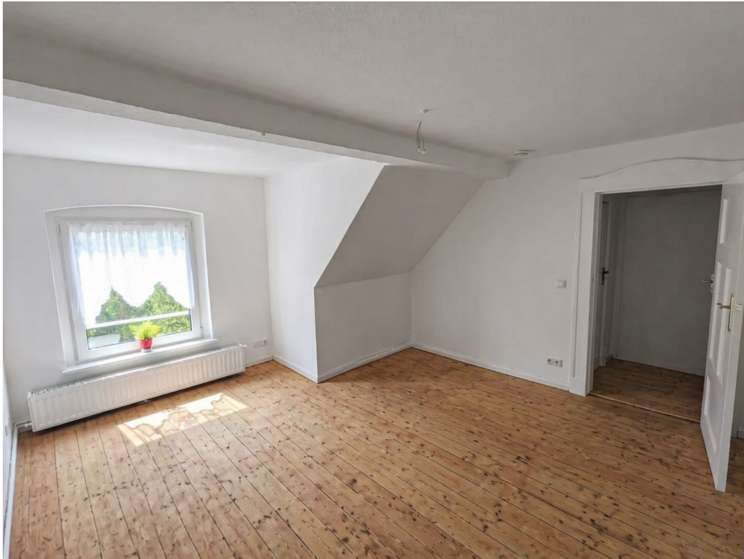
Wohnzimmer KI bearbeitet