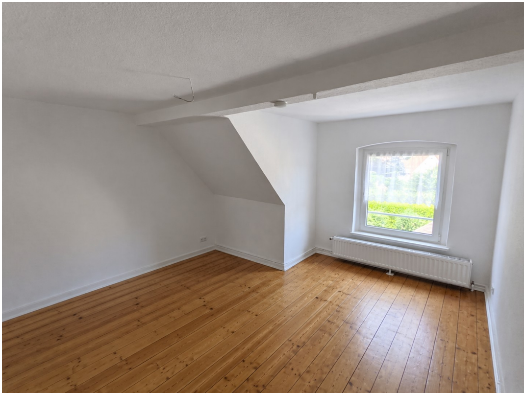
Schlafzimmer KI bearbeitet