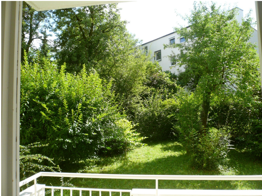
Blick von der Loggia