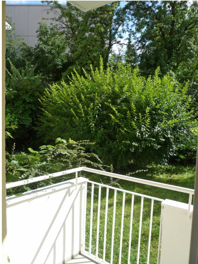
Blick von der Loggia