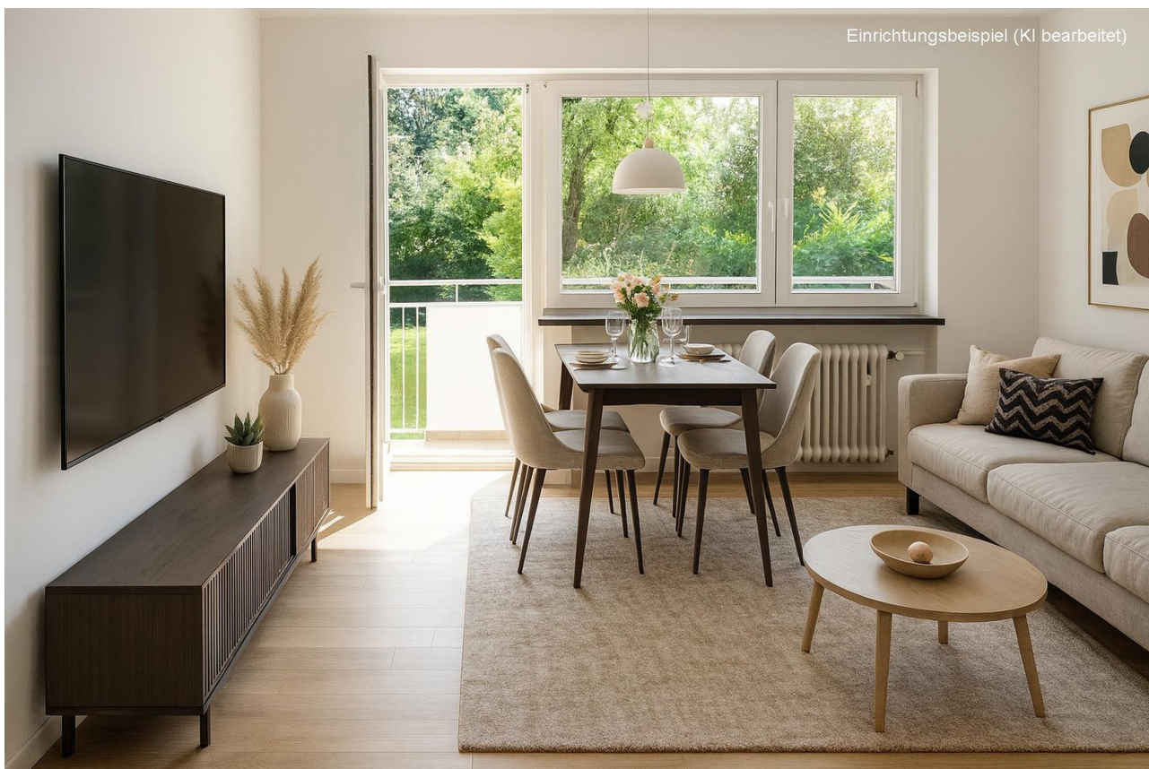
Wohnen (Einrichtungsbsp. KI)