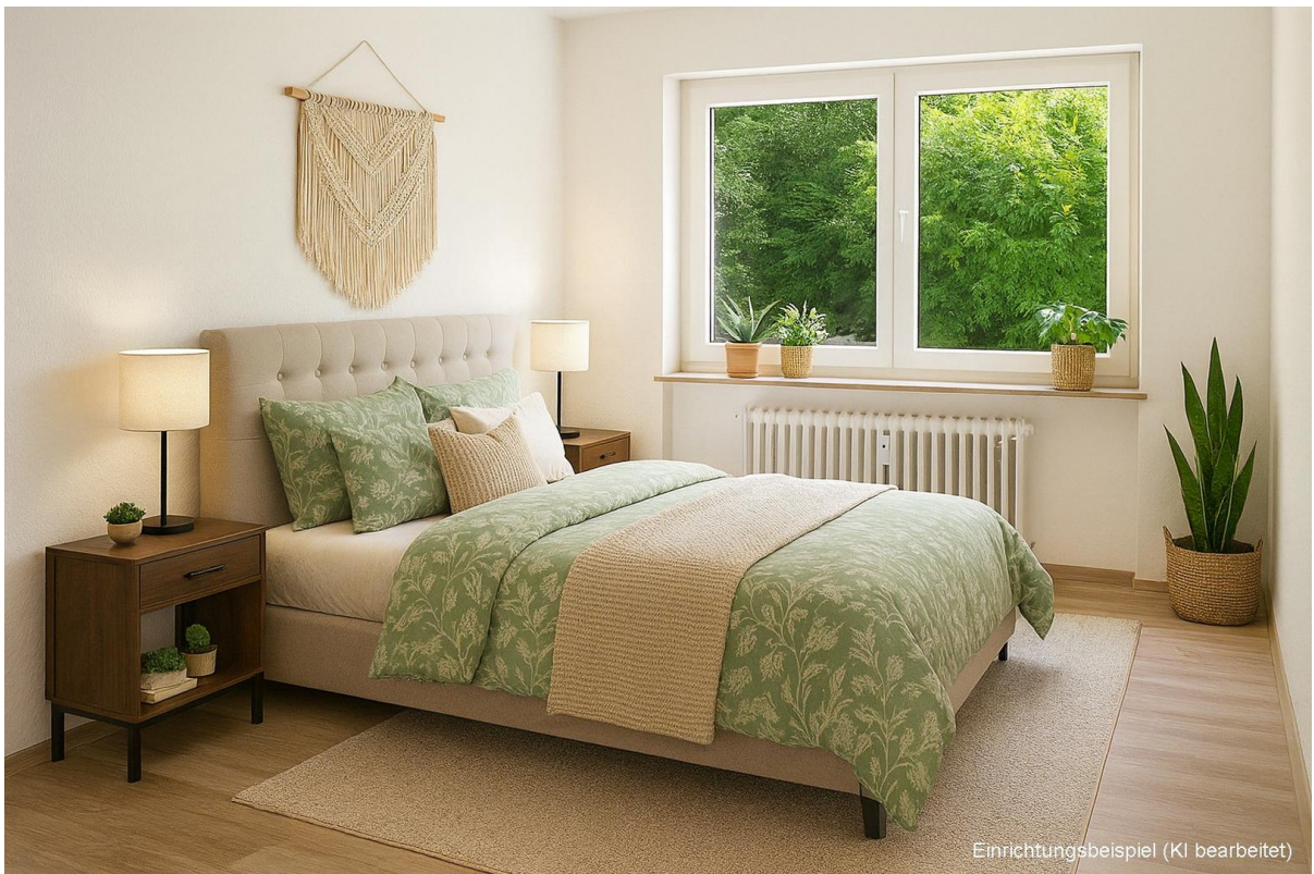
Schlafen (Einrichtungsbsp. KI)