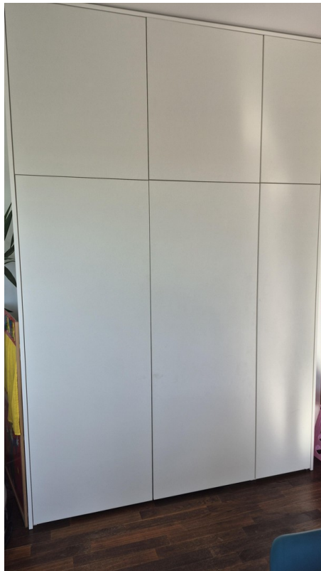
Smart Work geschlossen