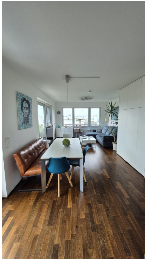
Wohn- / Essbereich