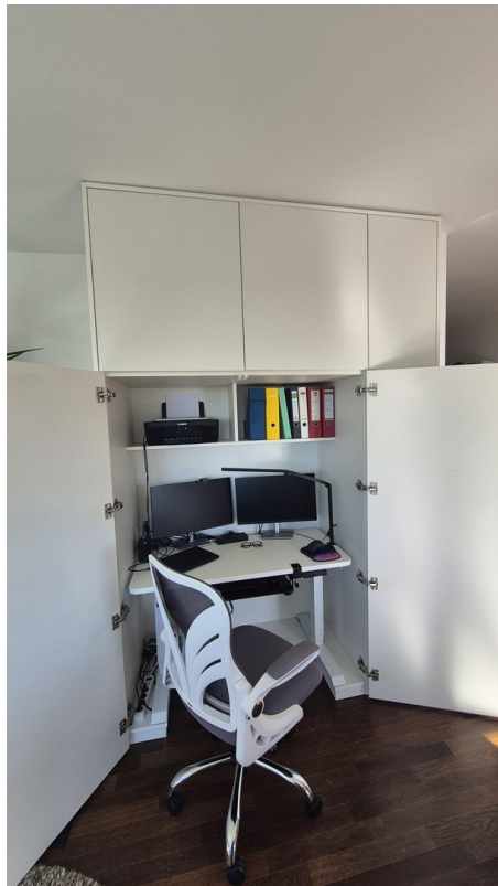
Smart Work offen