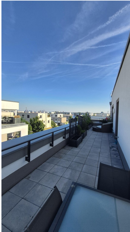
Genug Platz für Lounge etc.