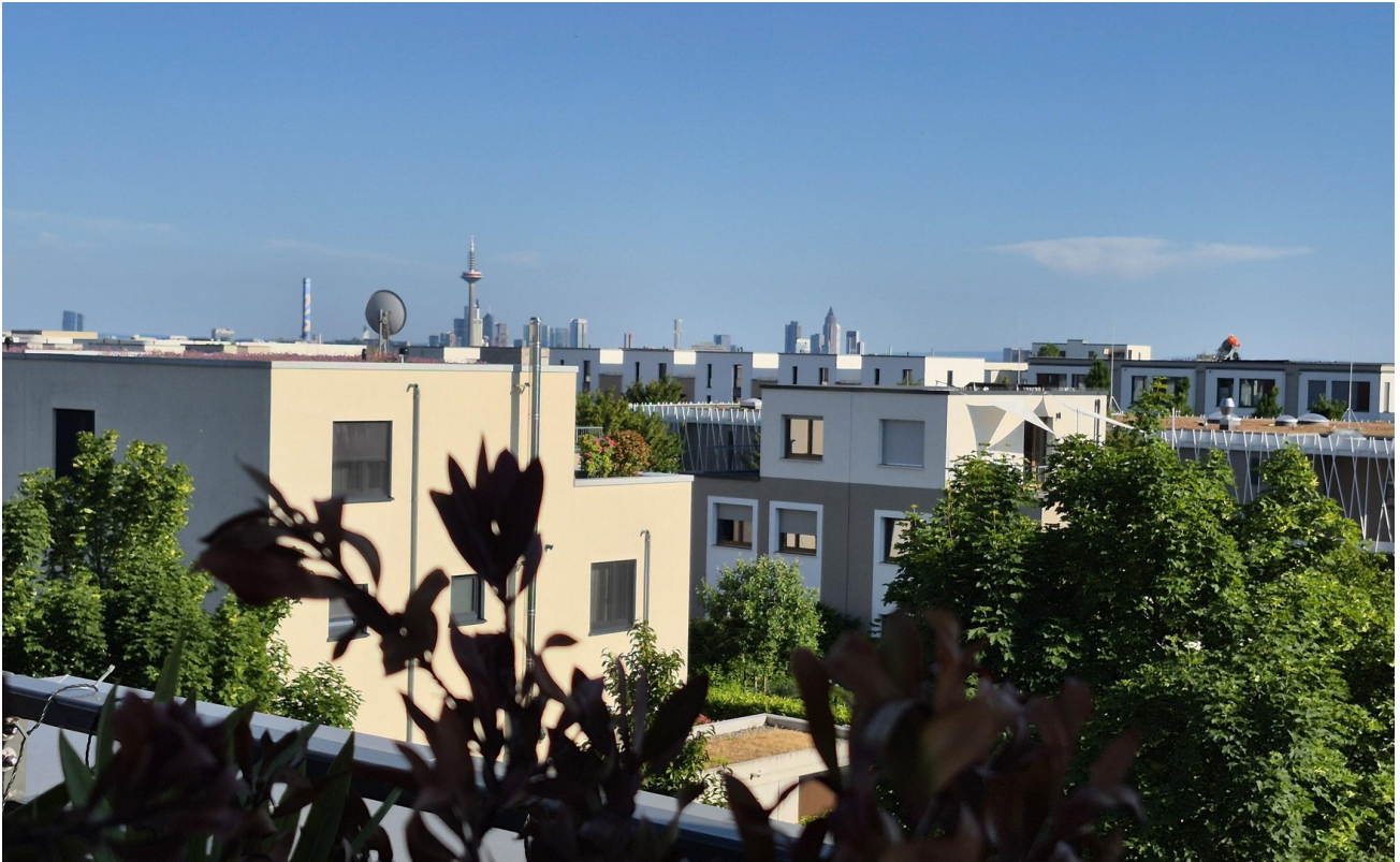
Dachterrasse mit Aussicht