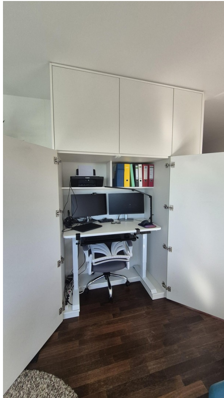
Smart Work offen verstaut