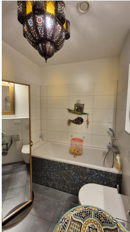
Wannenbad mit Flair