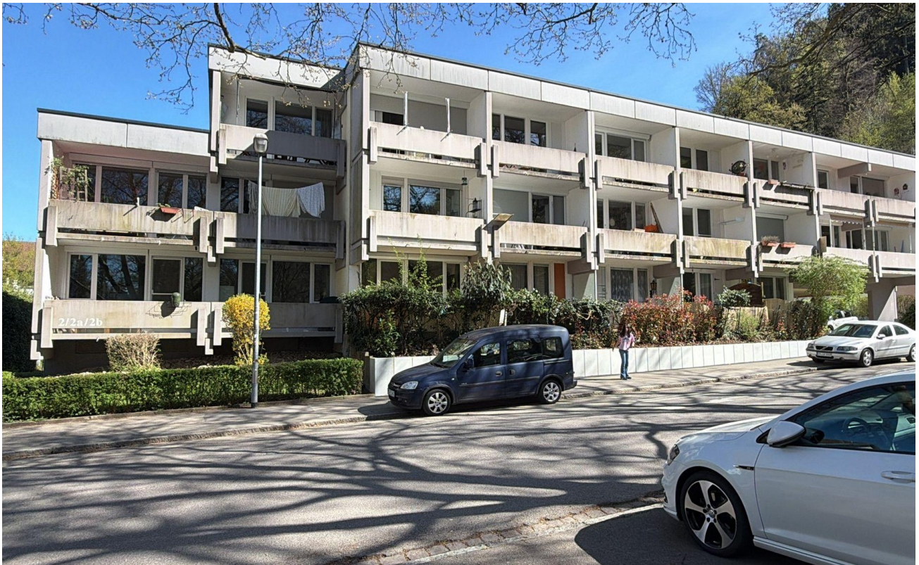
Außenansicht aus West