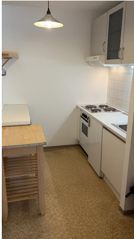
Küche aktueller Zustand