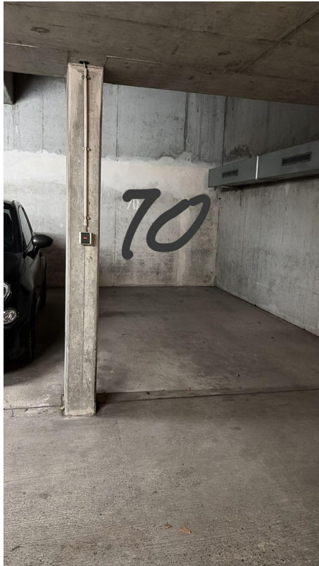
Tiefgaragenplatz № 10