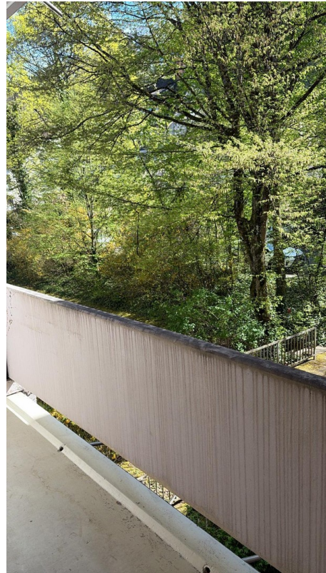
auf dem Balkon 2