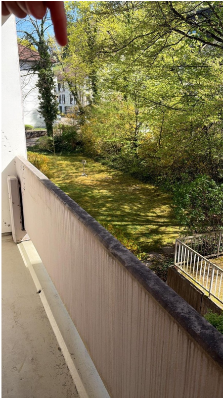
auf dem Balkon