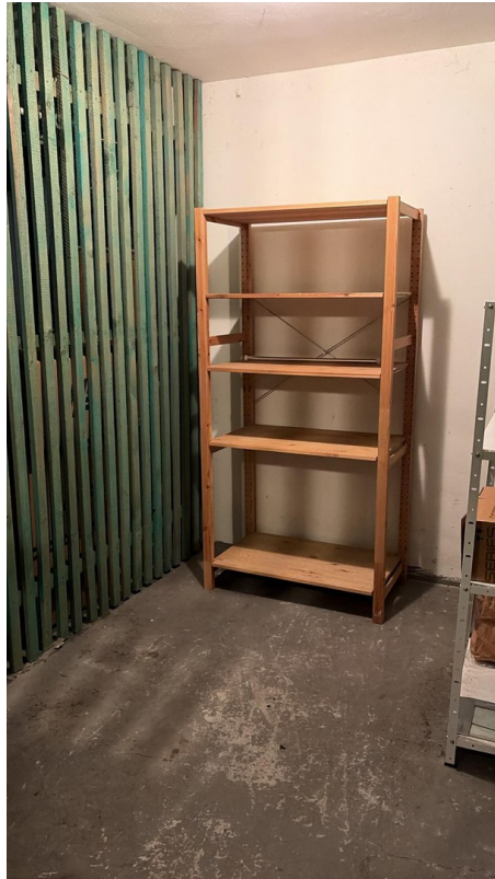
Kellerraum mit Regal