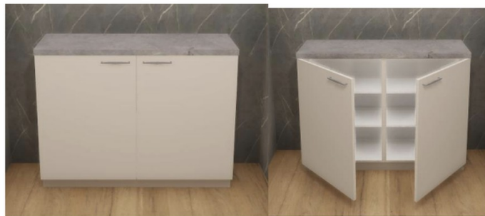
so wird die neue Küche