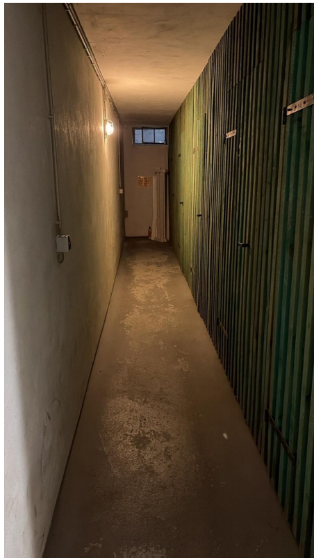
"Flur" im Keller