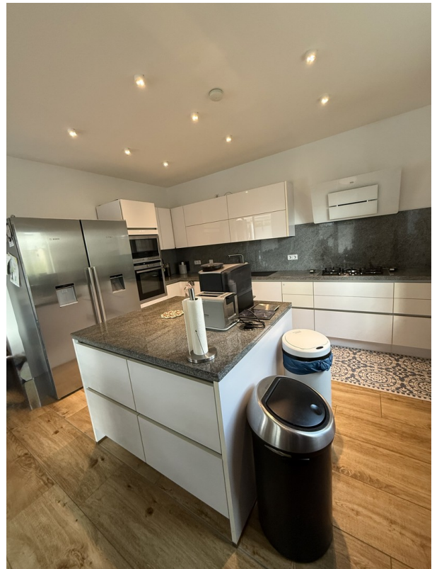
Küche Ansicht 2