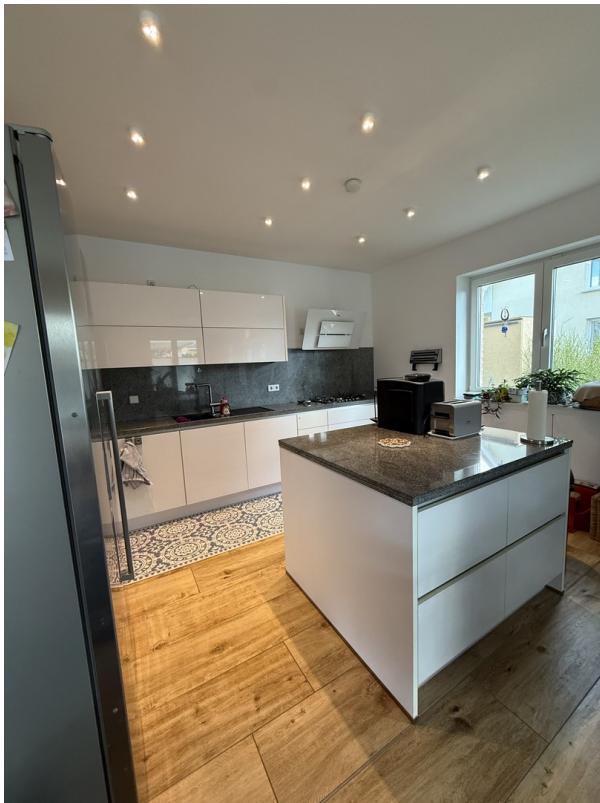
Küche Ansicht 1