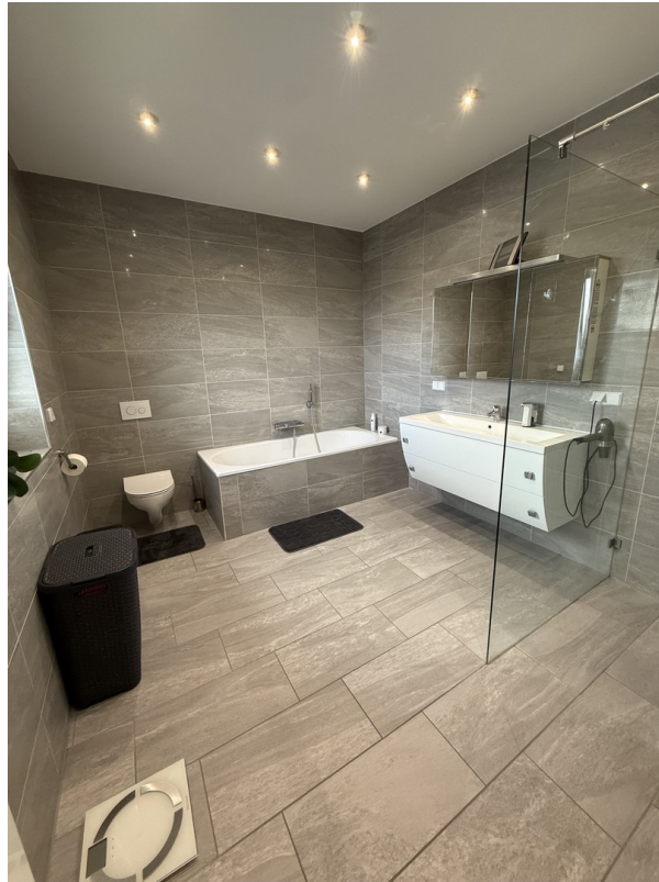
Bad OG Ansicht 1