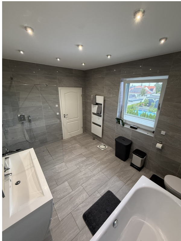
Bad OG Ansicht 2