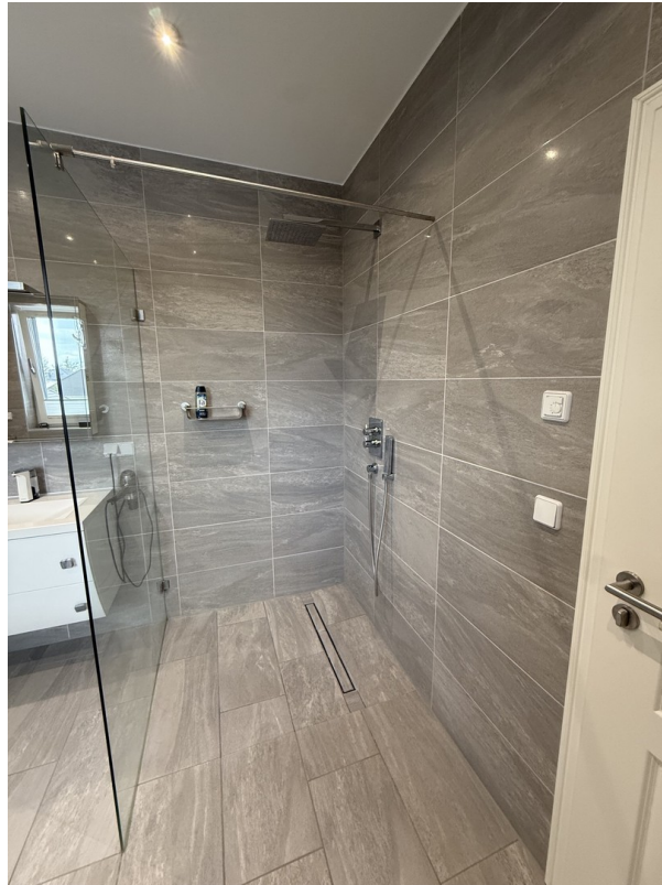
Bad OG - Dusche