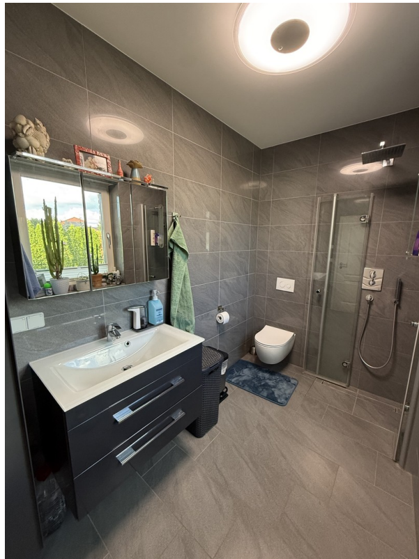
Bad EG Ansicht 1