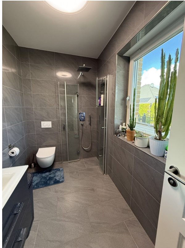
Bad EG Ansicht 2