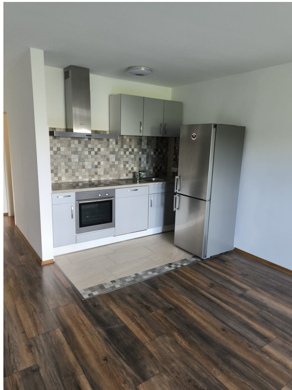
Einbauküche inkl. El.geräten