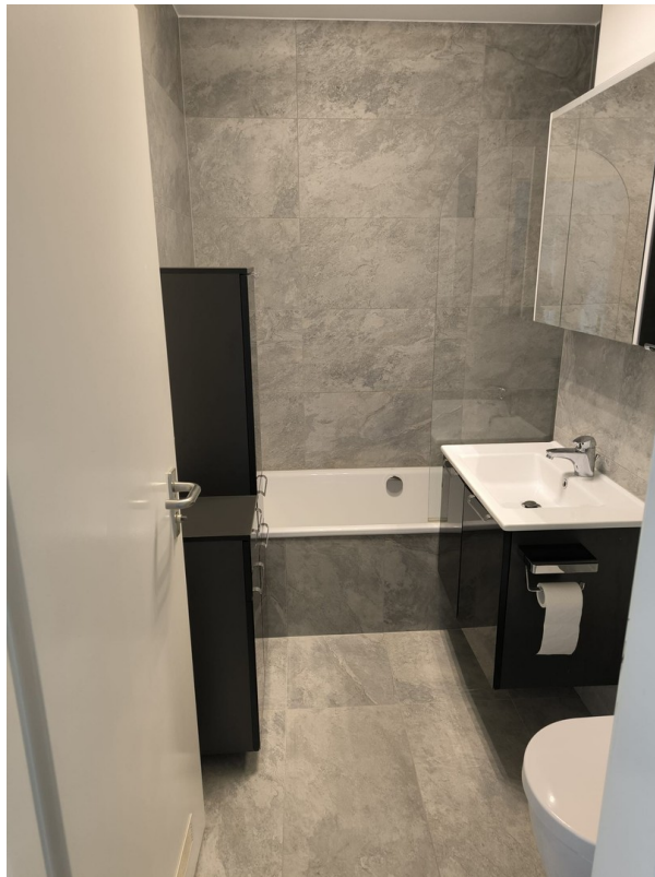
Bad mit Dusche/Badewanne