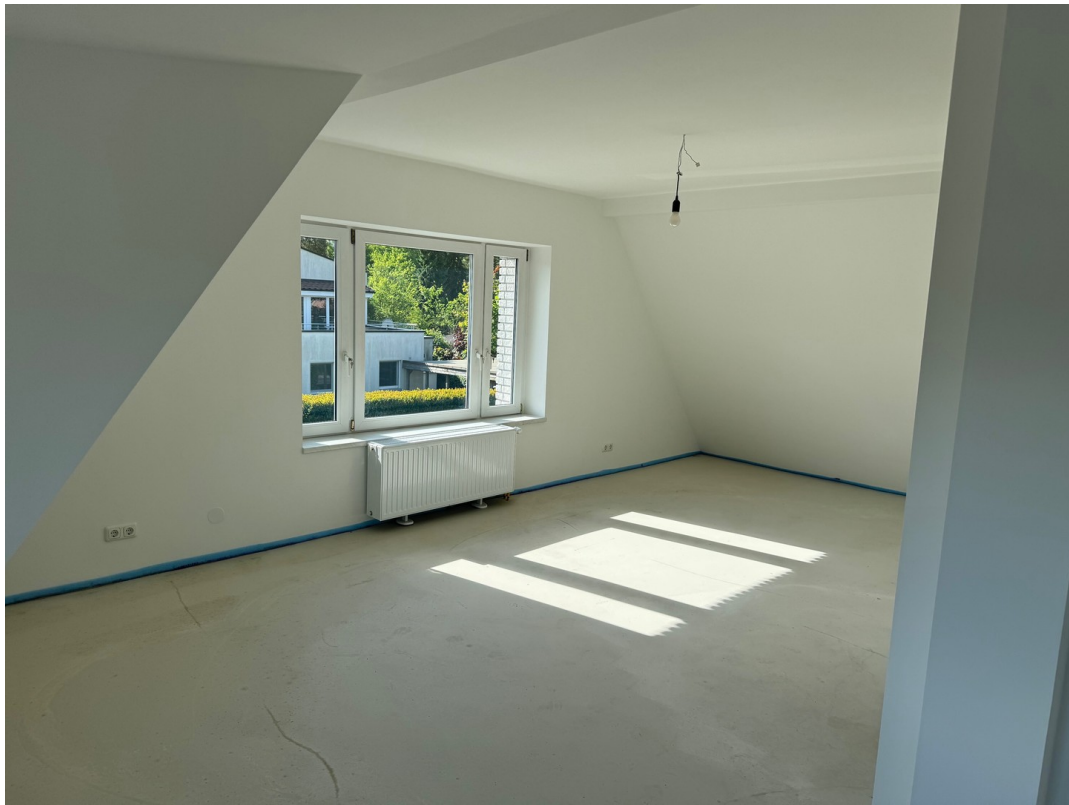
1. OG. Schlafzimmer