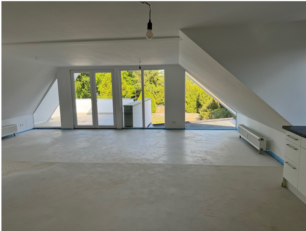
1. OG. Wohnzimmer