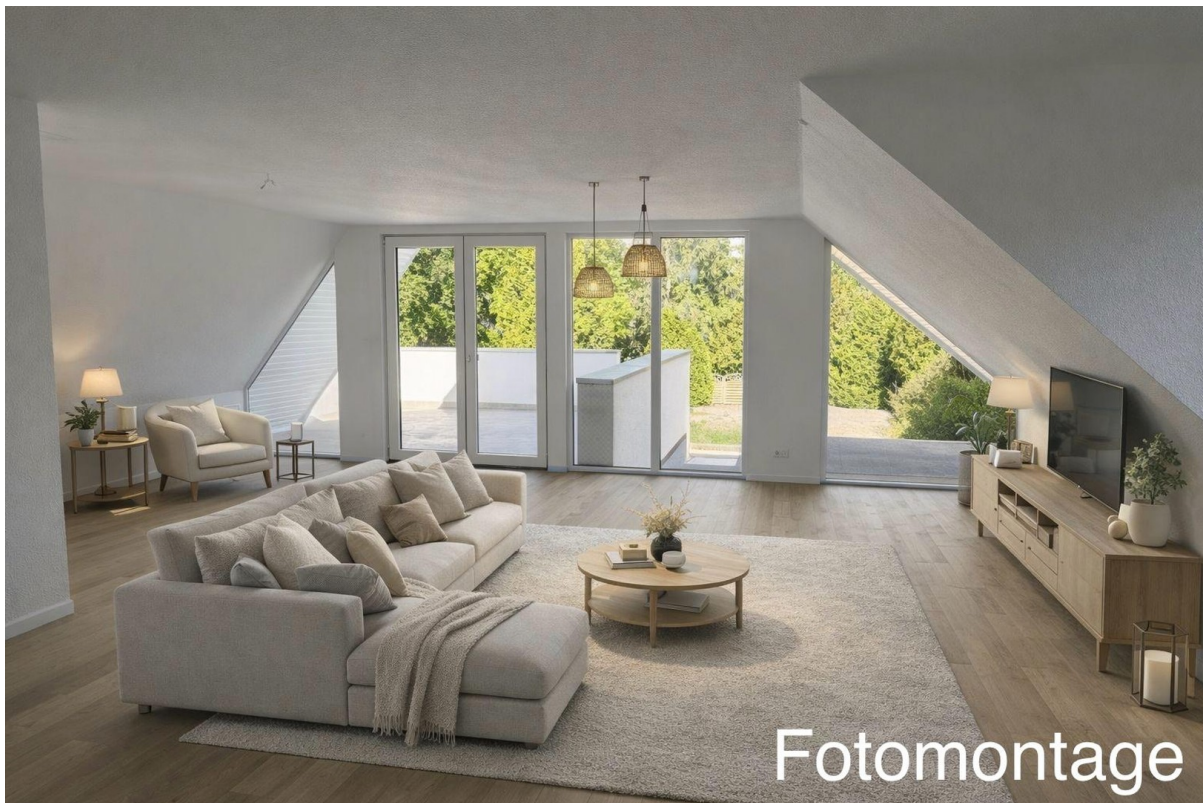
1. OG Wohnzimmer