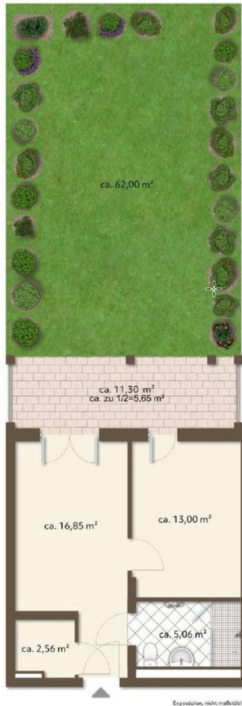
Grundriss EG unmöbliert