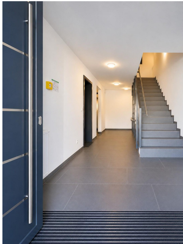
Treppenhaus mit Lift