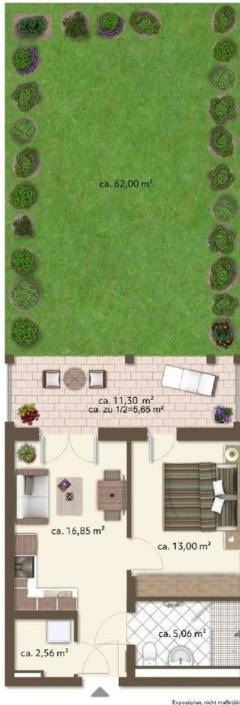
Grundriss EG möbliert