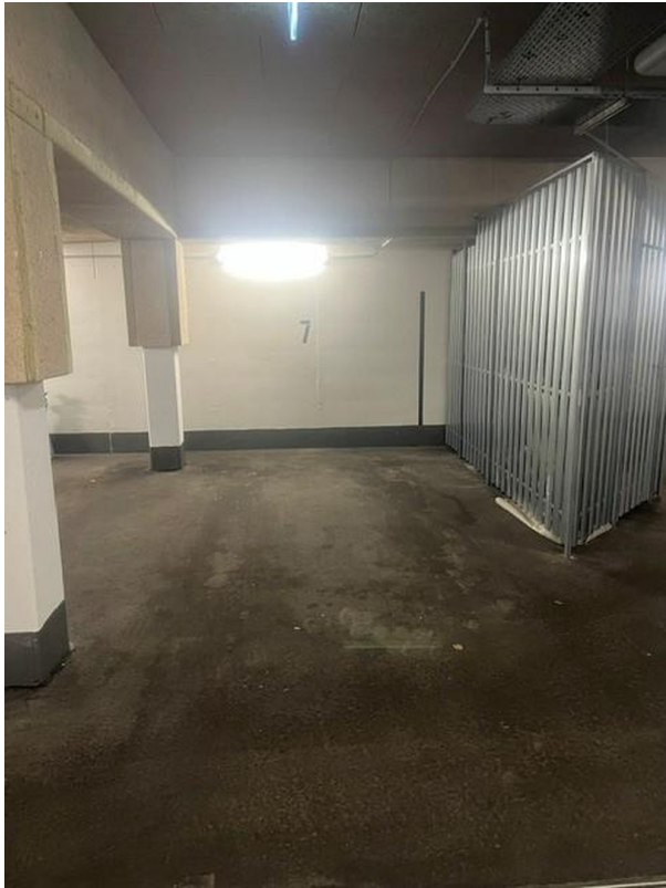
Garagenstellplatz № 7