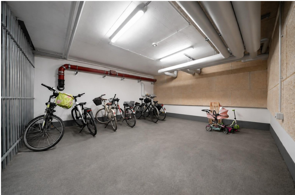
Fahrradraum in der Tiefgarage