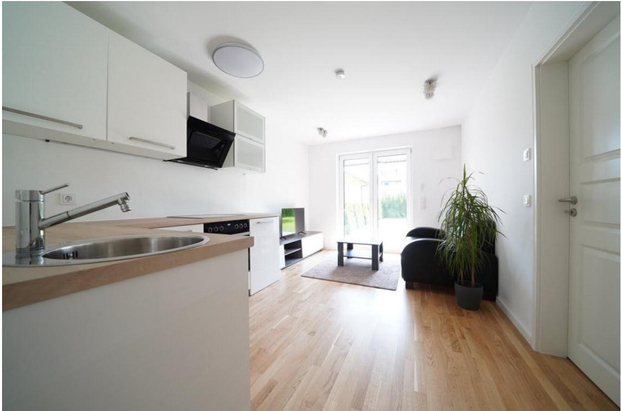
Kochen Essen Wohnen