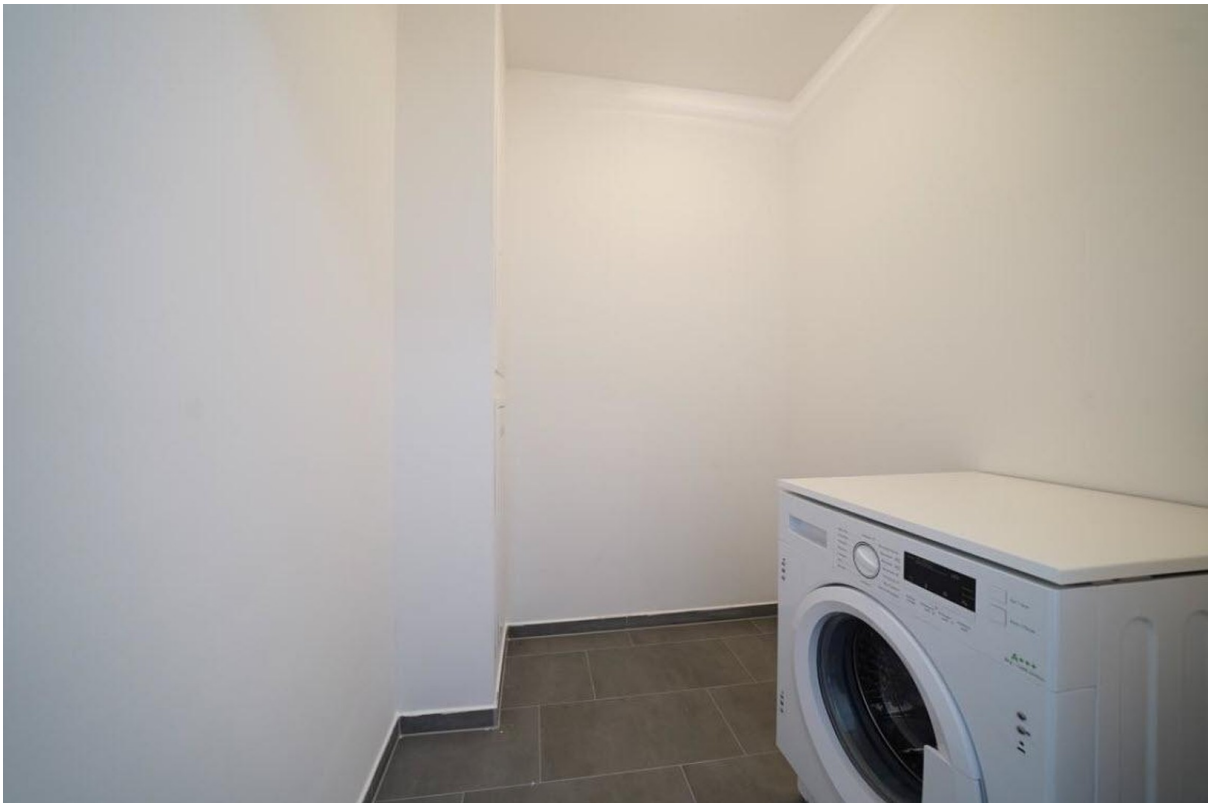
Kammer mit Waschen