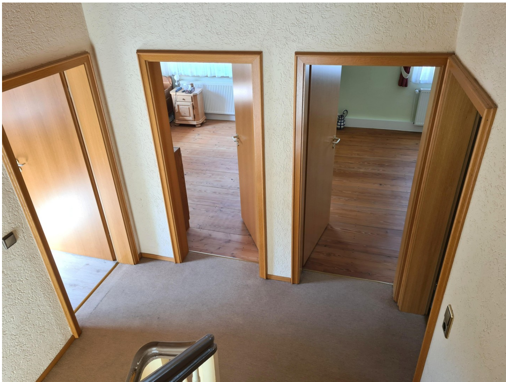
Flur 1. Stock