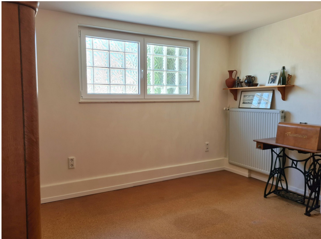
Schlafzimmer 1. OG