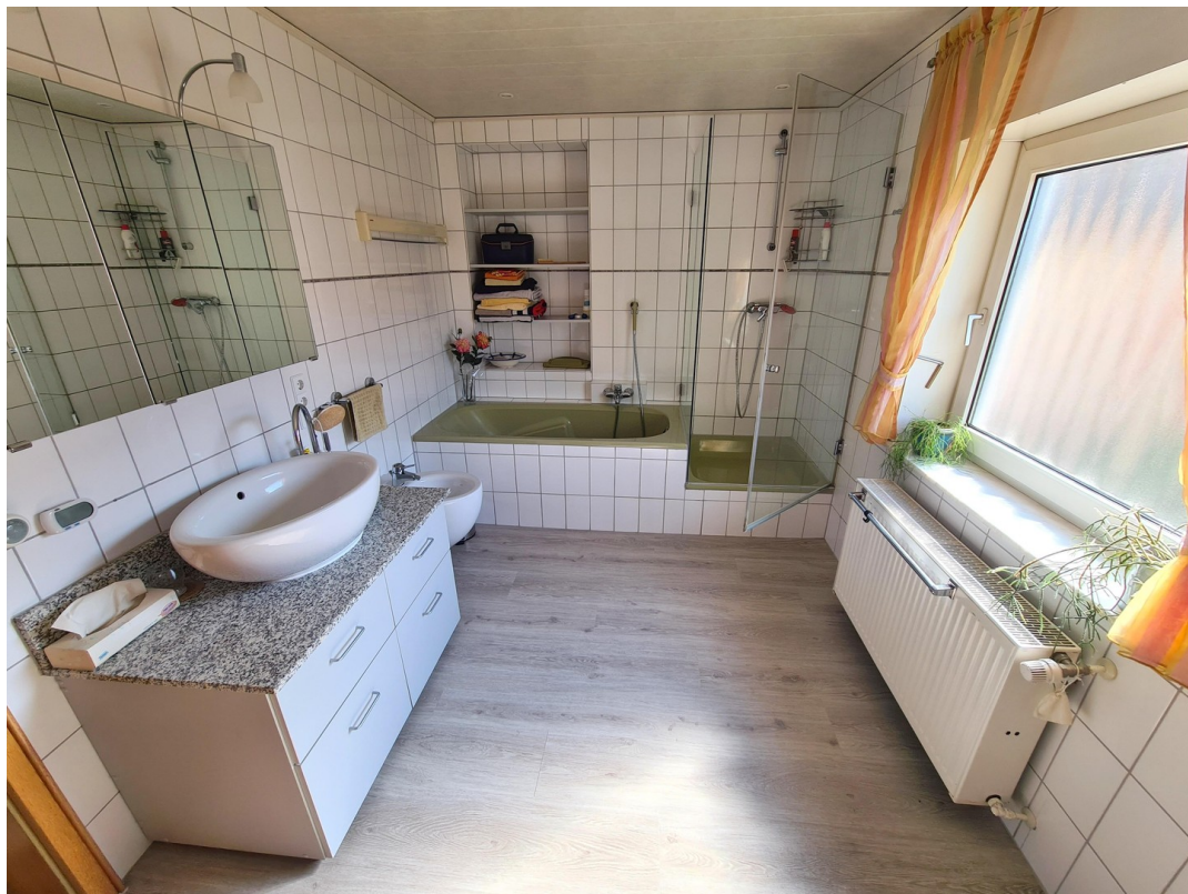
Badezimmer 1. OG