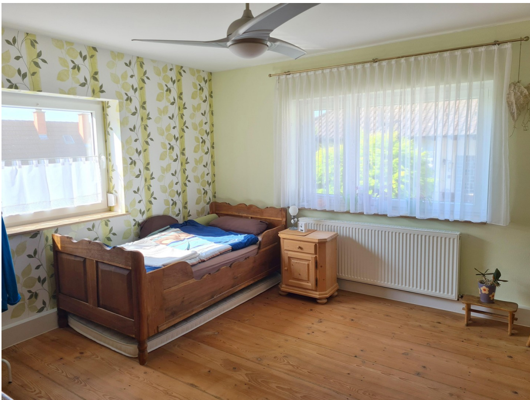
Schlafzimmer 1. OG