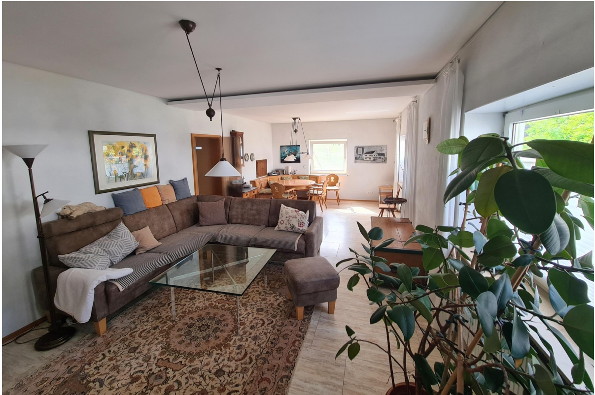
Wohn- und Esszimmer EG