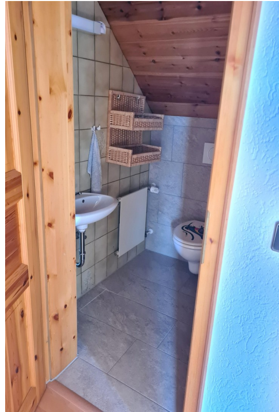
Gäste WC DG