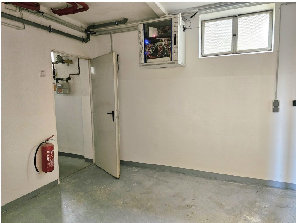
Separater Waschraum / Technik