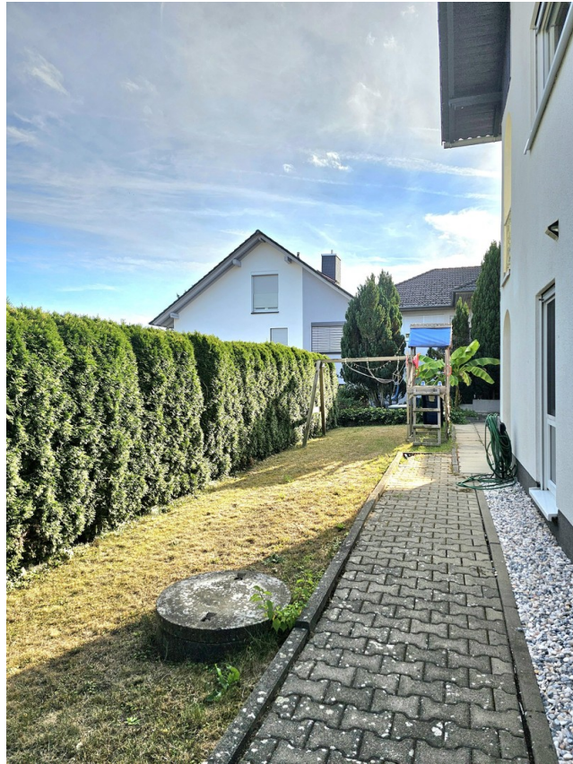
Garten mit Spielturm