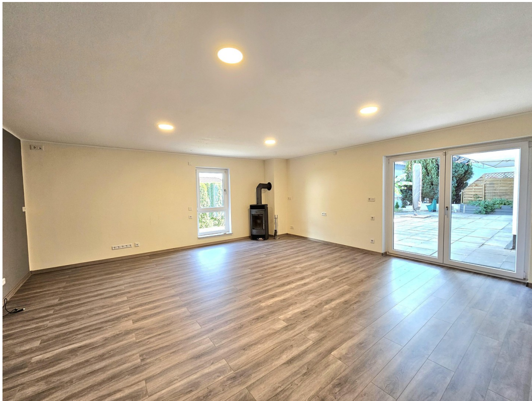
Geräumiges Wohnzimmer mit Kamin