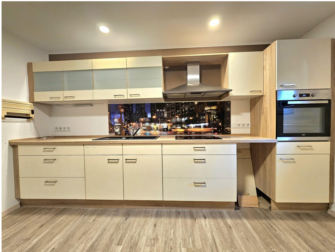
Einbauküche mit Platz für Tisch