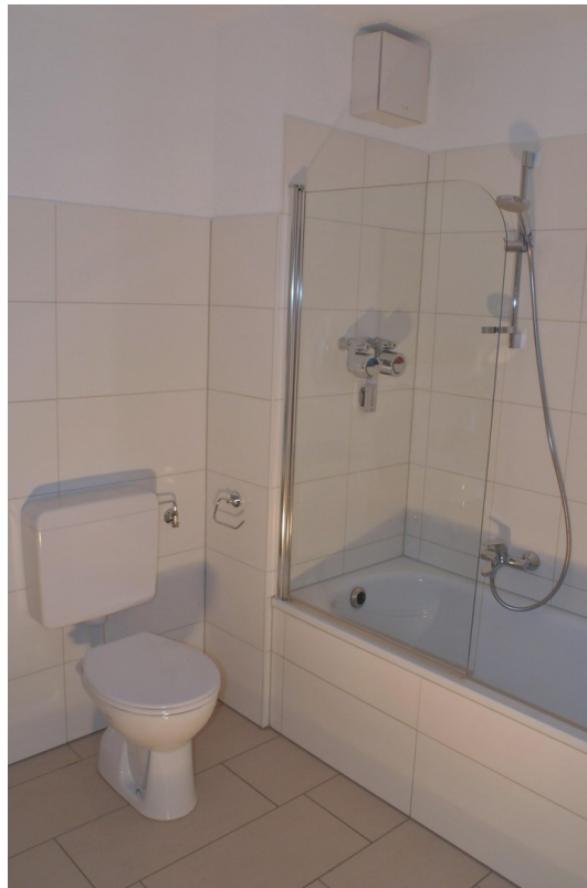
Bad Foto 2