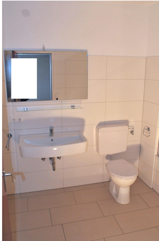
Bad Foto 1