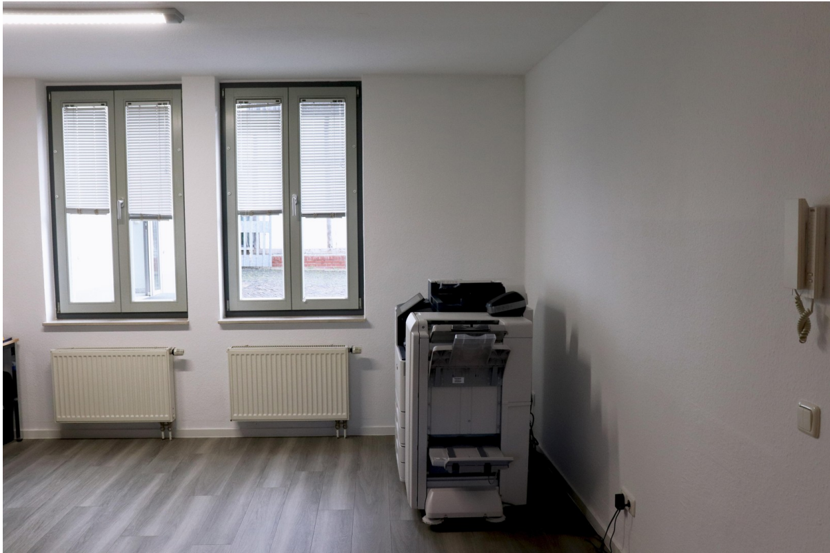
Büro 2 Fensterfront