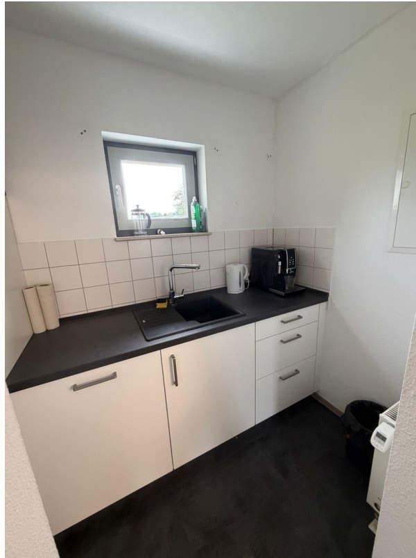
Einbauküche rechte Seite