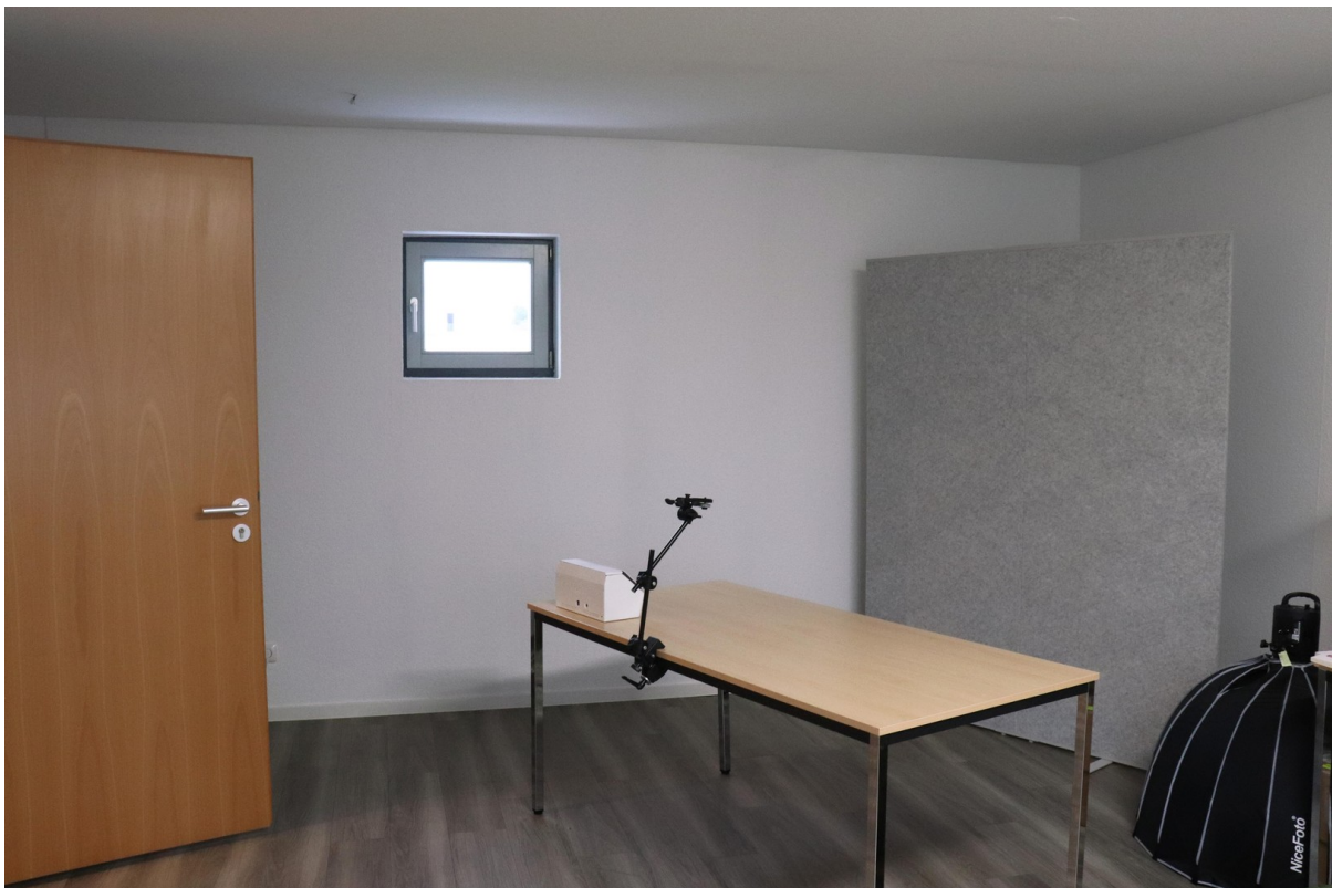
Büro 2 Rückseite