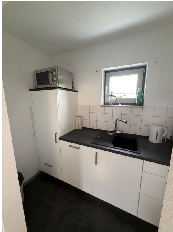
Einbauküche linke Seite