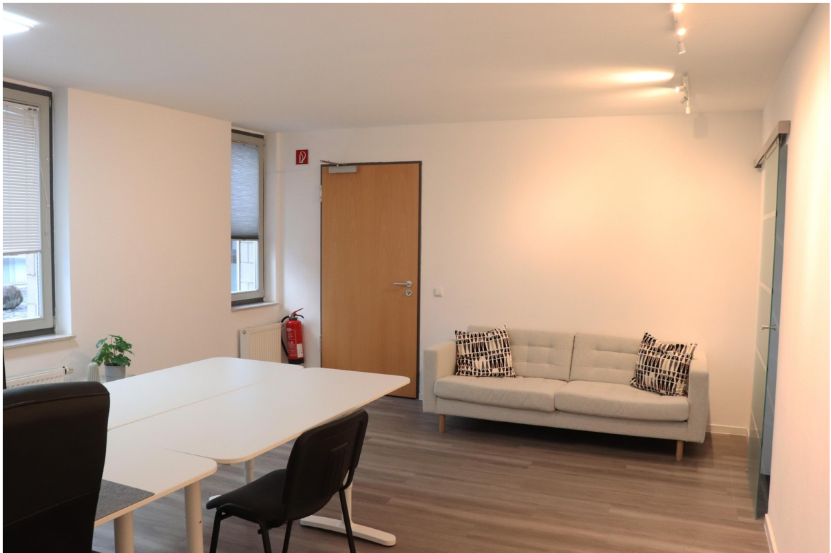
Büro 1 Fensterfront