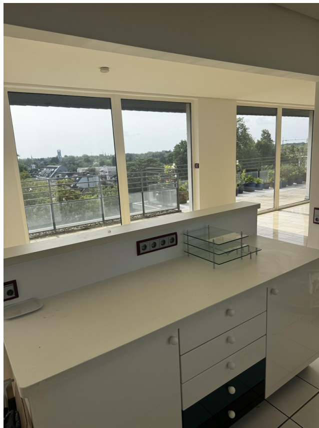
Blick aus der Küche