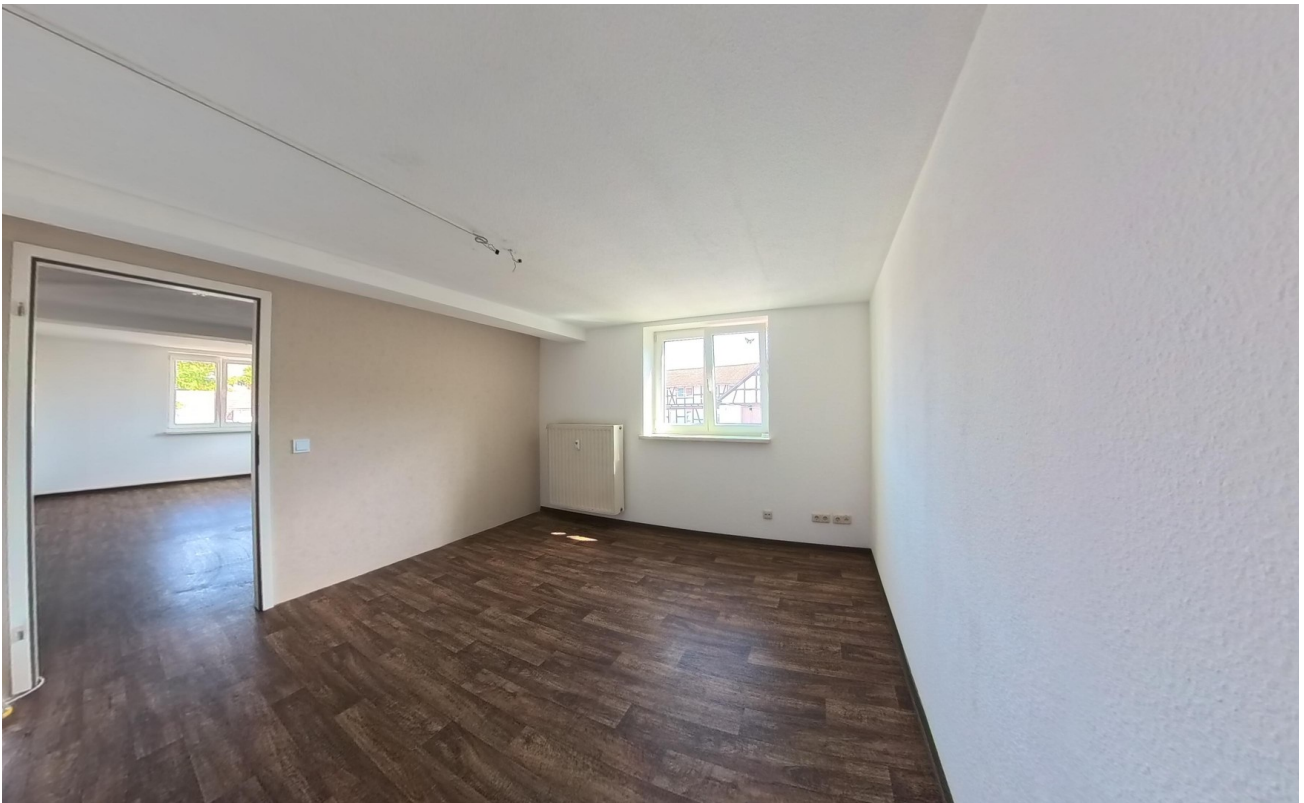
Wohneinheit C (kleiner Raum)