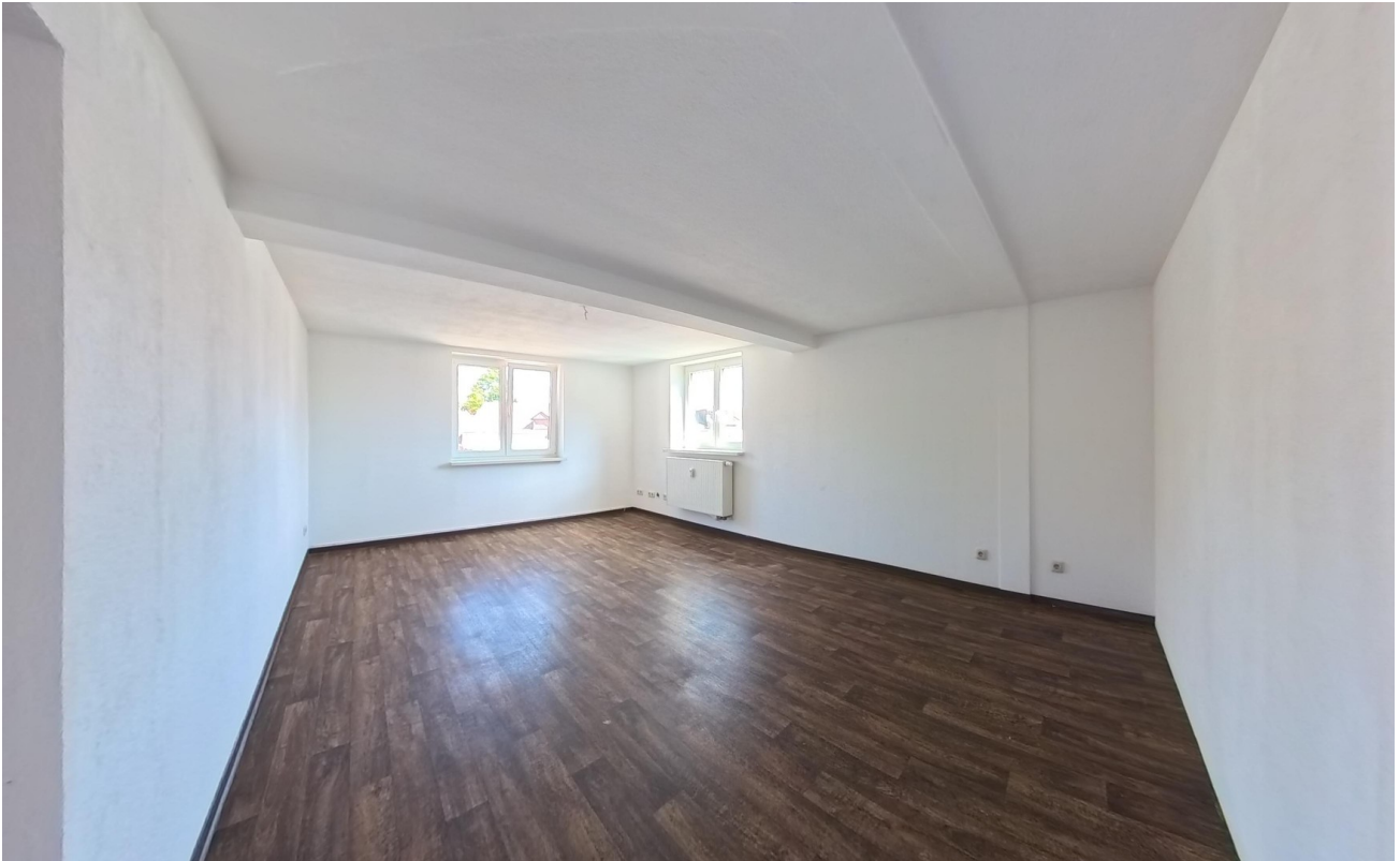
Wohneinheit C (großer Raum)