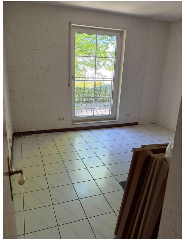
Schlafzimmer II / Kind