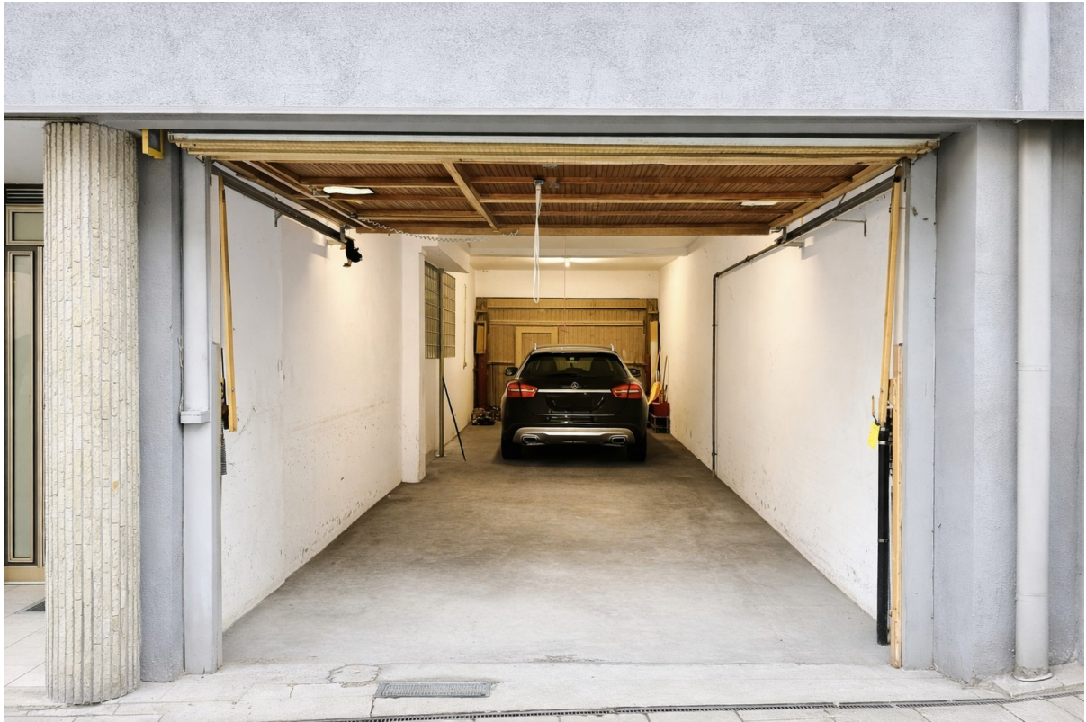
Tandem Garage für 2 Fahrzeuge