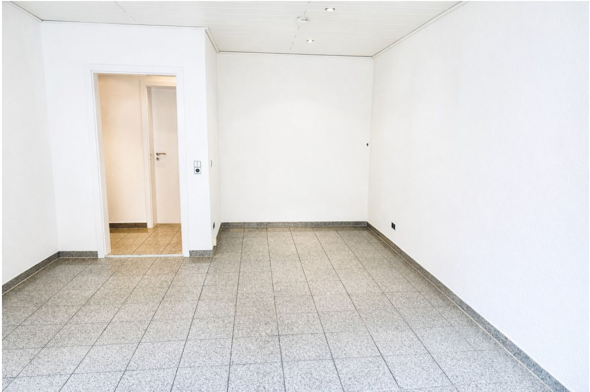
Wohnbereich mit Schlafnische