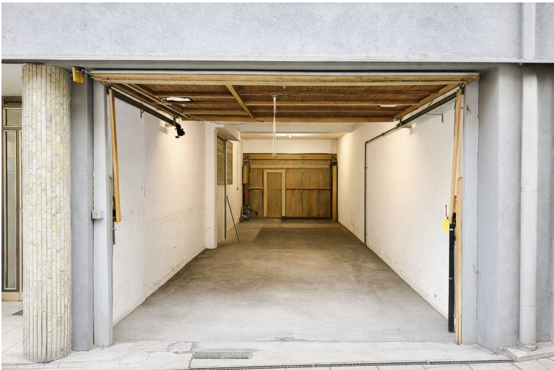
Tandem Garage für 2 Fahrzeuge