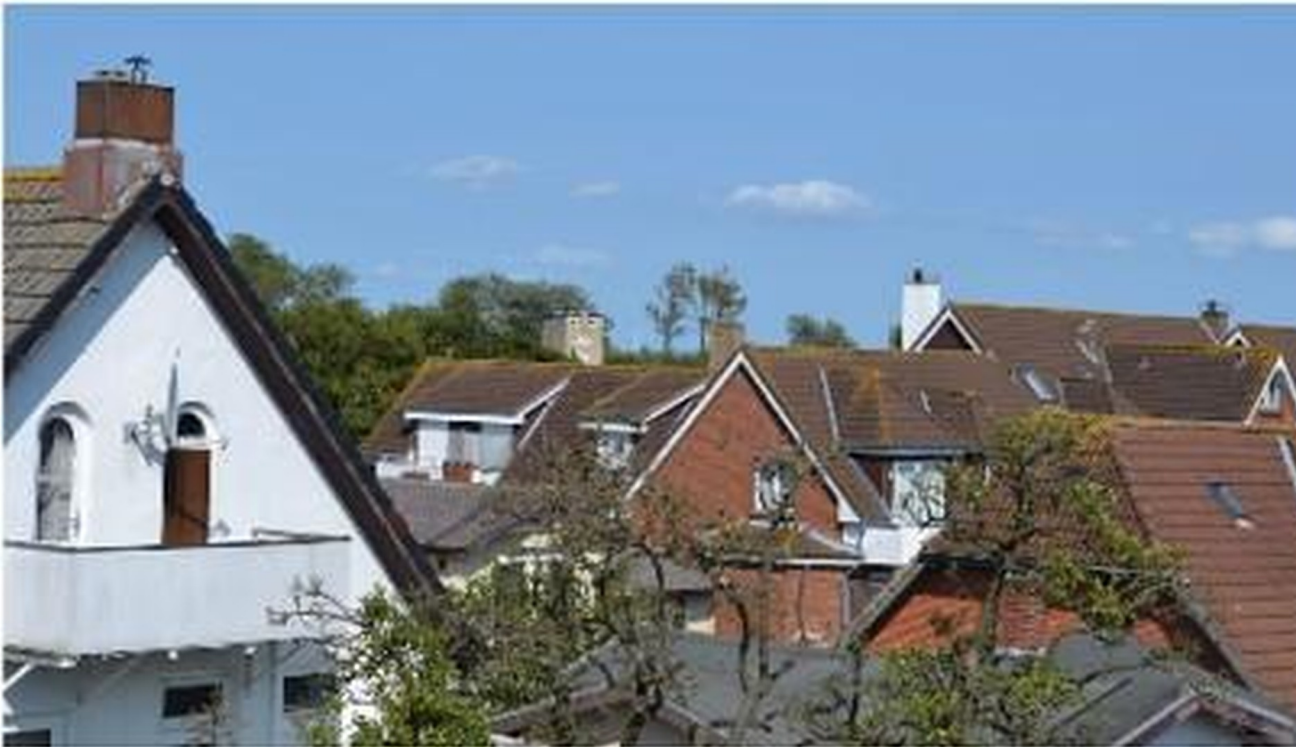
Blick rechts vom Laubengang