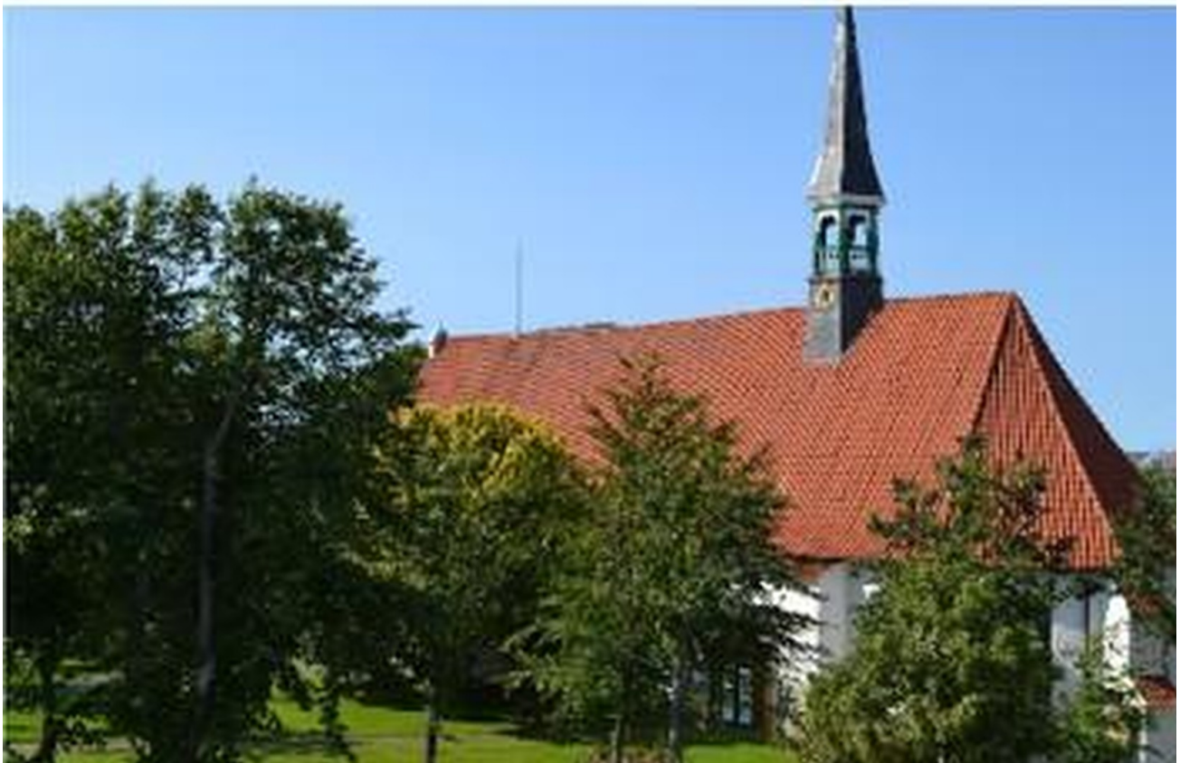
Blick links vom Laubengang