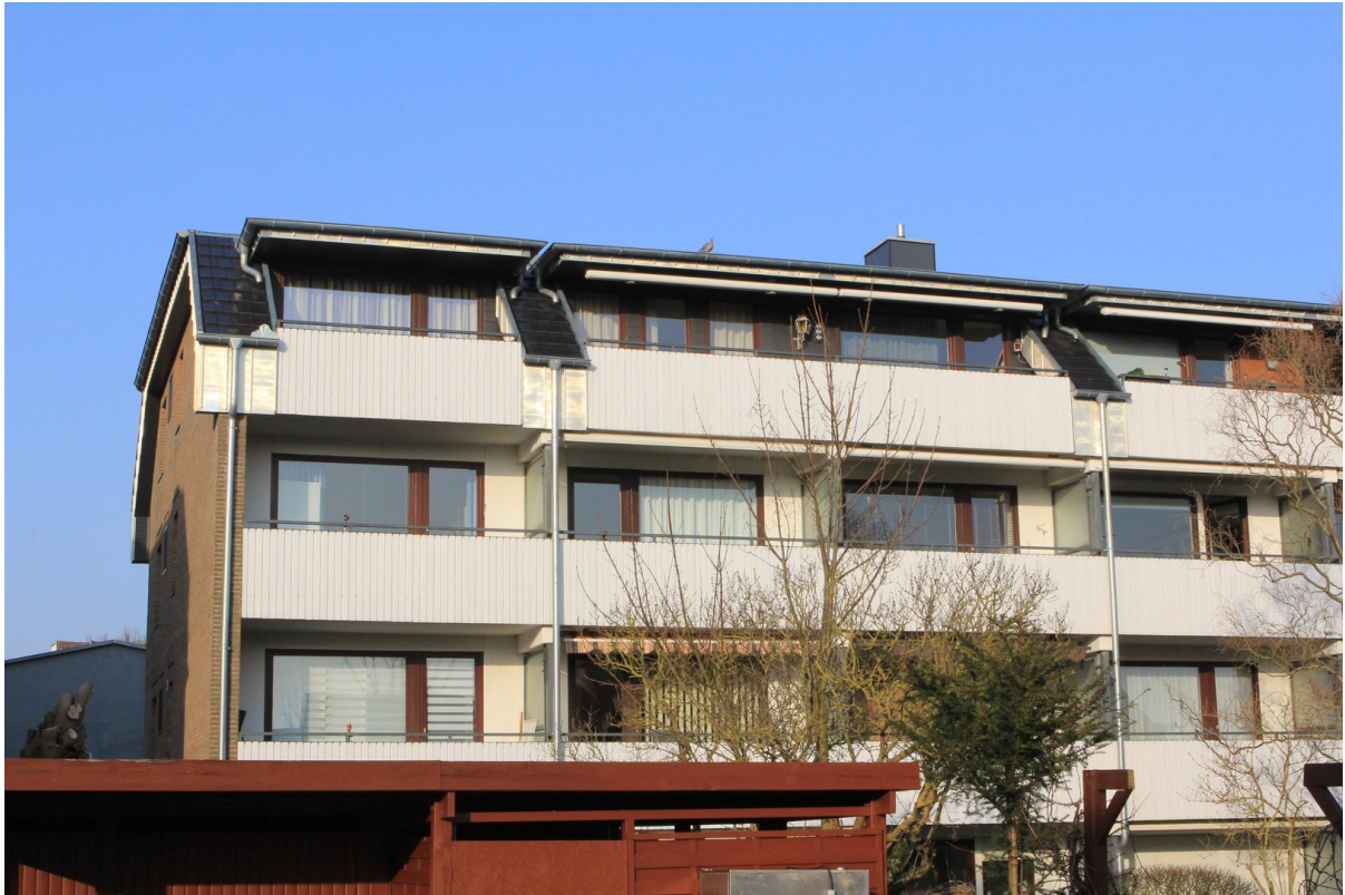
Wohnung oben links