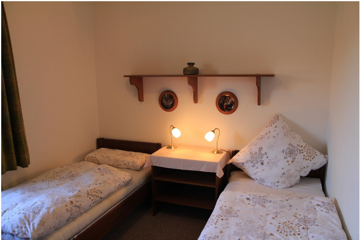
Schlafzimmer 2, Einzelbetten