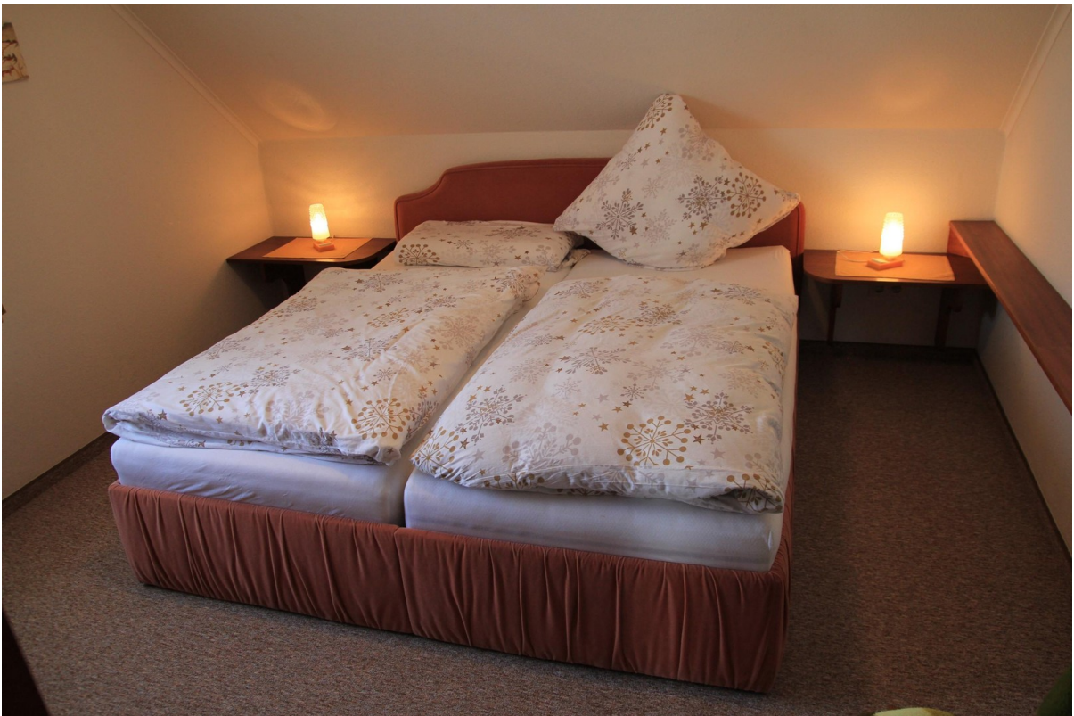
Schlafzimmer 1, Doppelbett