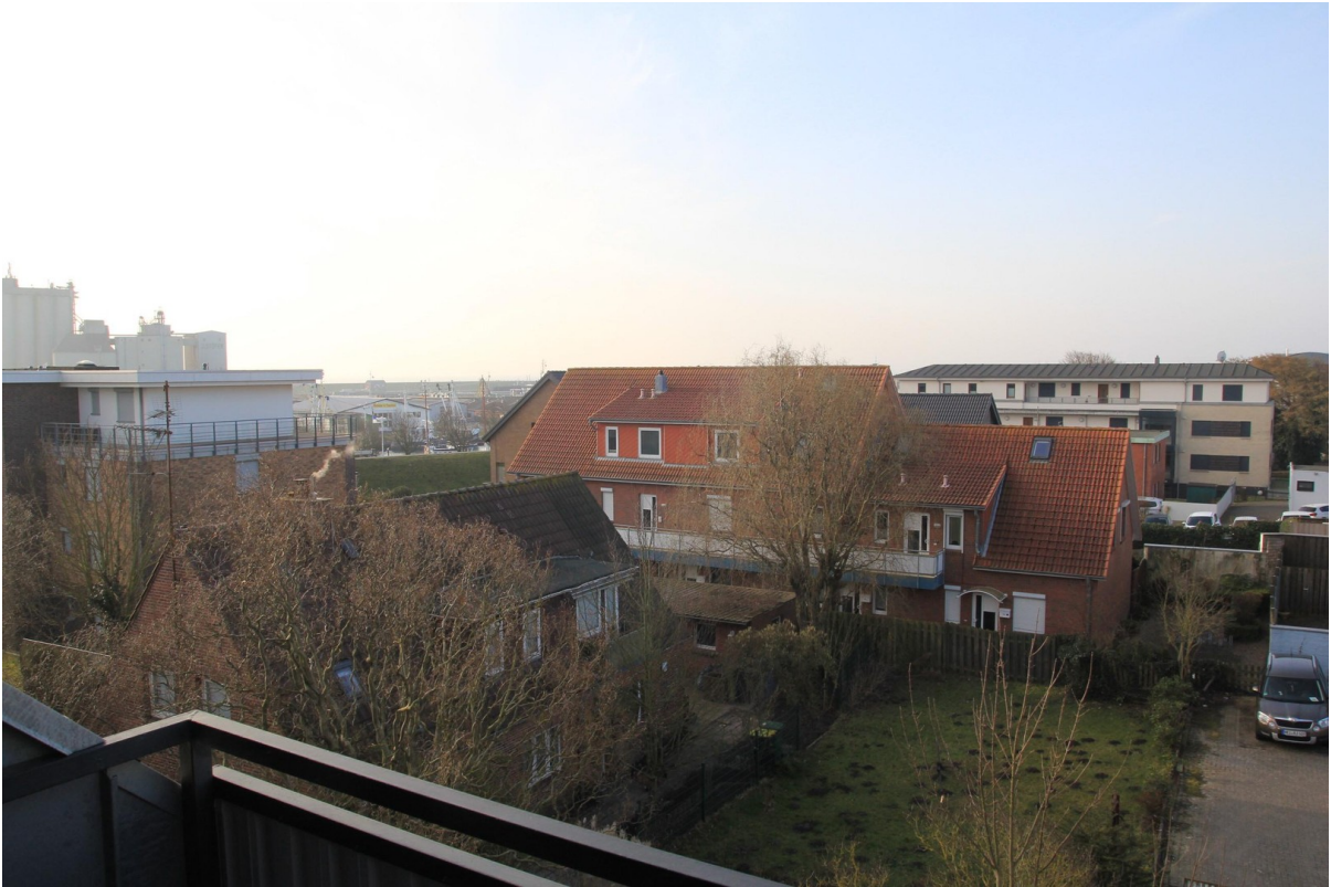
Blick in Richtung Deich