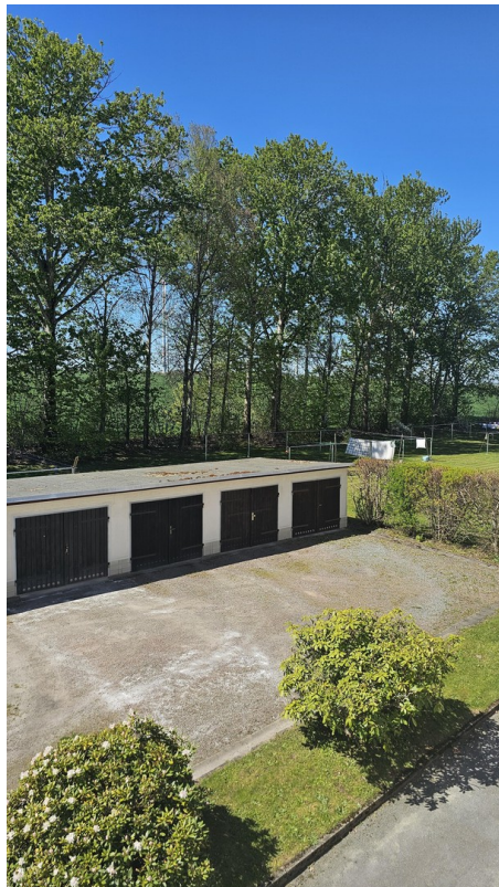
Blick aus dem Fenster