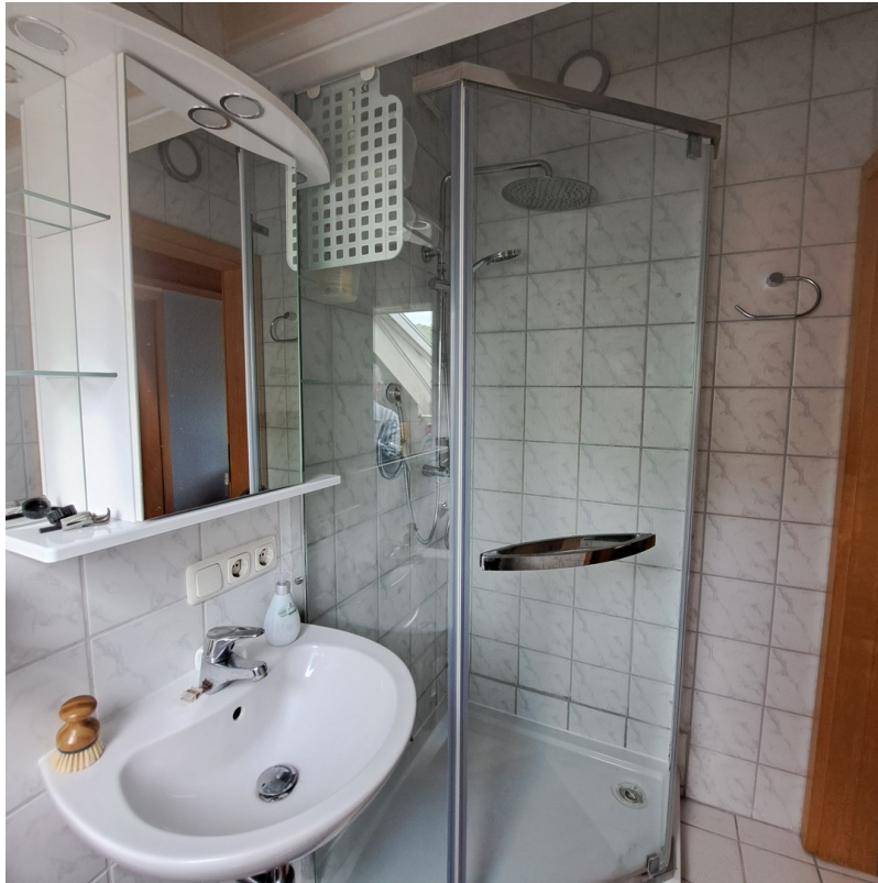
Dusch-Bad mit WC