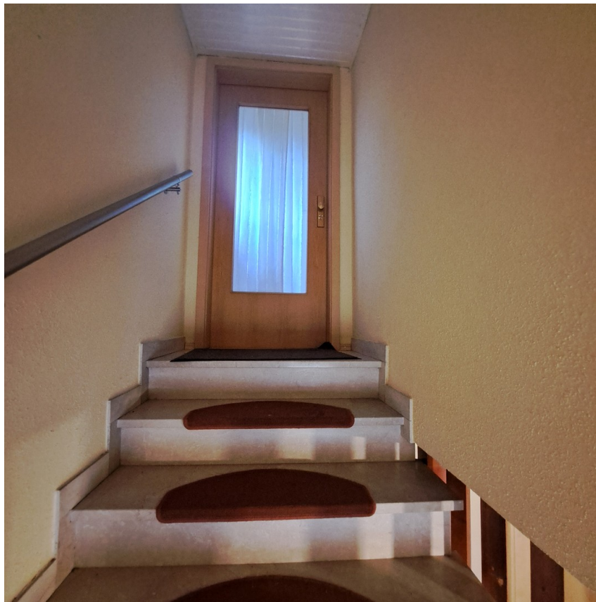
Treppenaufgang zur Wohnung