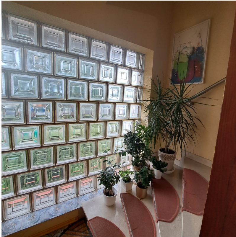
Treppenaufgang zur Wohnung