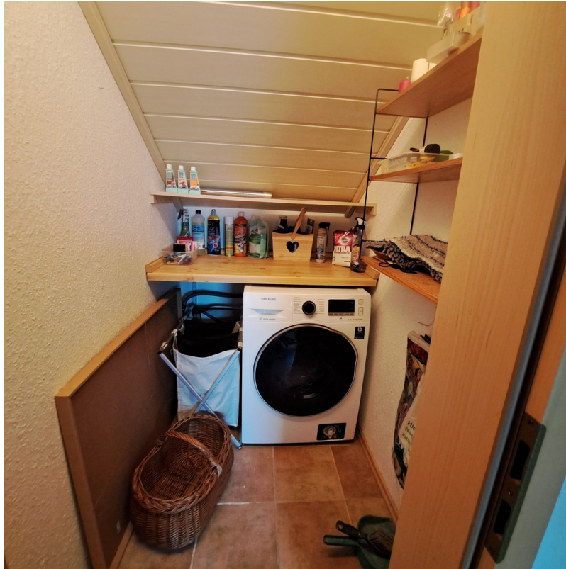
Wasch- bzw. Vorratsraum