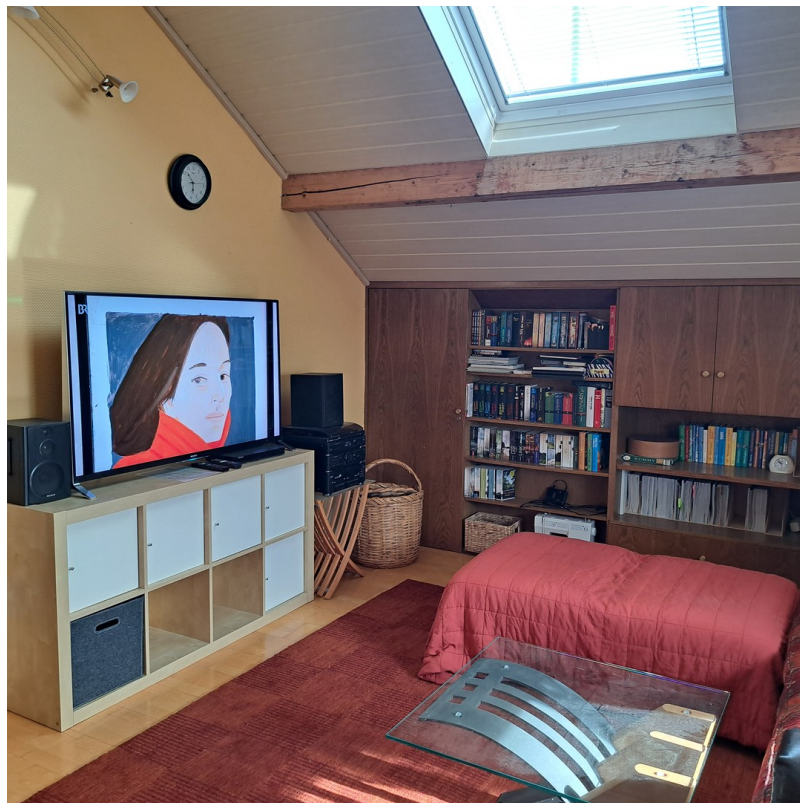
Wohnzimmer m. Einbauschränke li