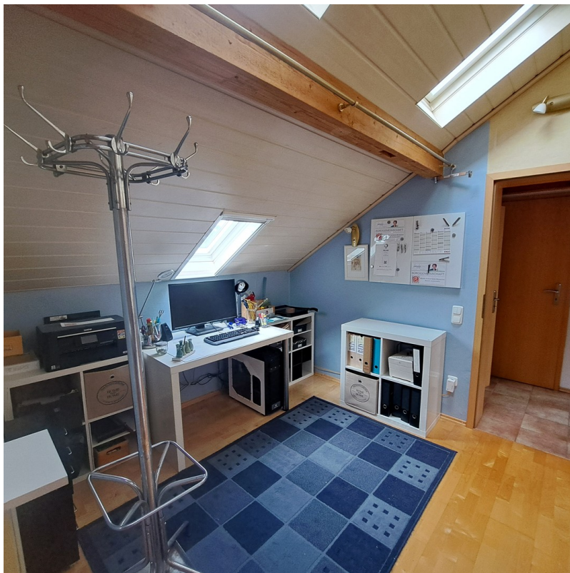
Heller Büroraum mit Durchgang