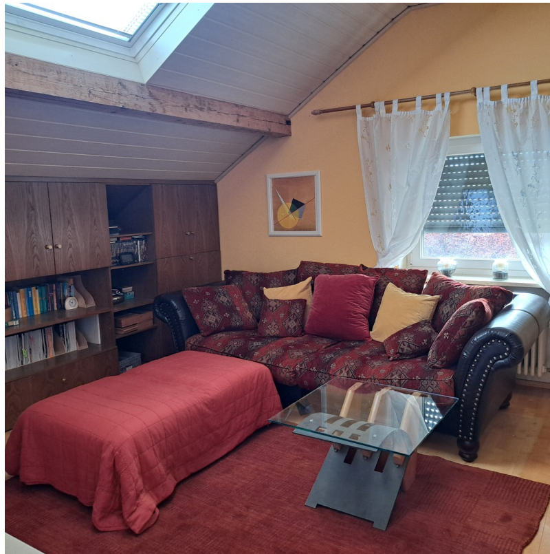
Wohnzimmer m. Einbauschränke li