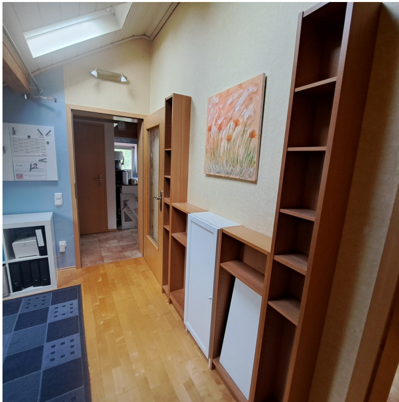
Heller Büroraum mit Durchgang