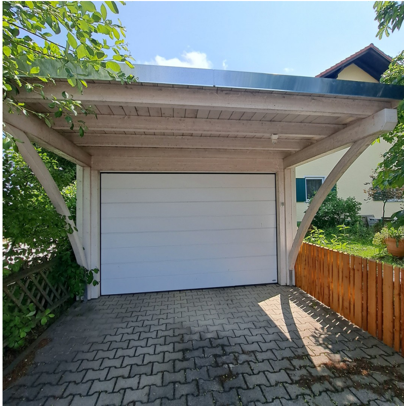
XL-Carport mit viel Stauraum