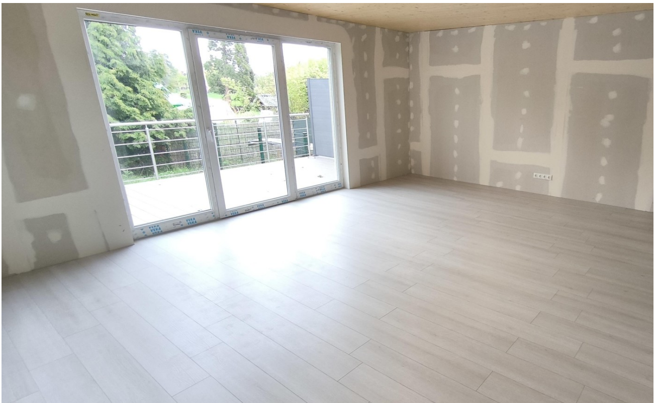
Helles und großes Wohnzimmer