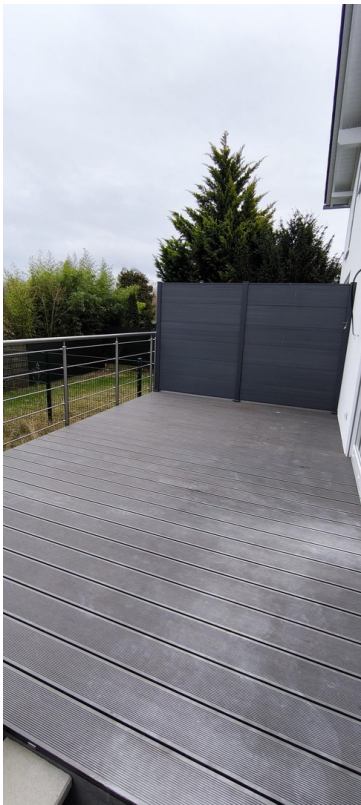
Terrasse, WPC und Edelstahlgel