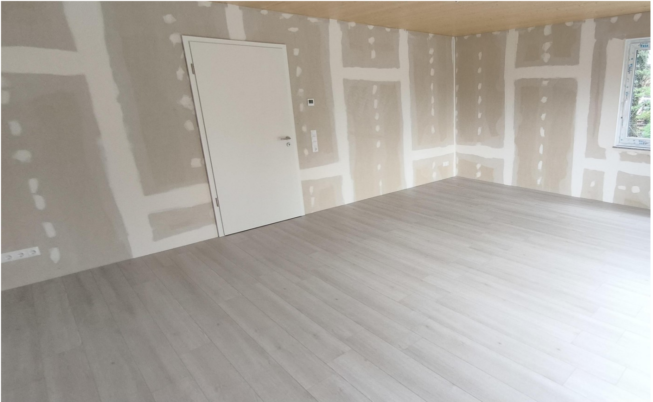
Wohnzimmer mit Seitenfenster