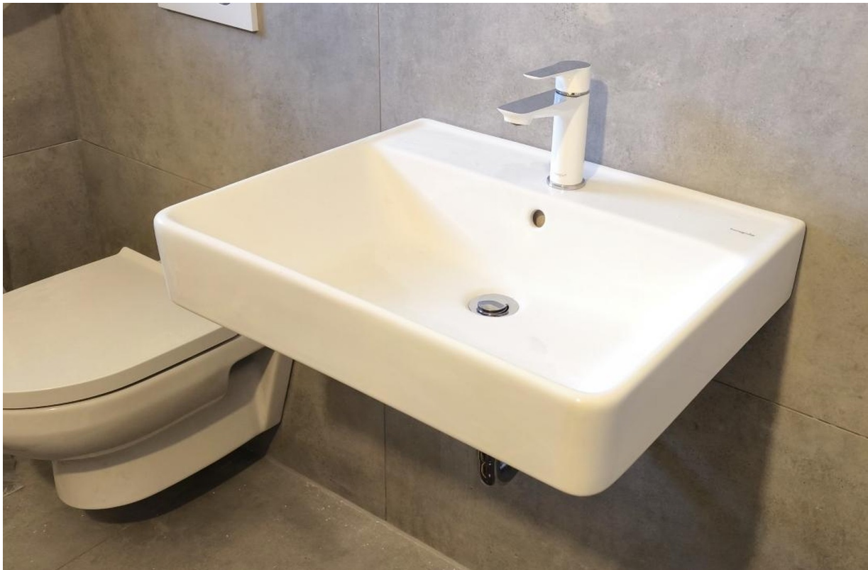
Extra großes Waschbecken