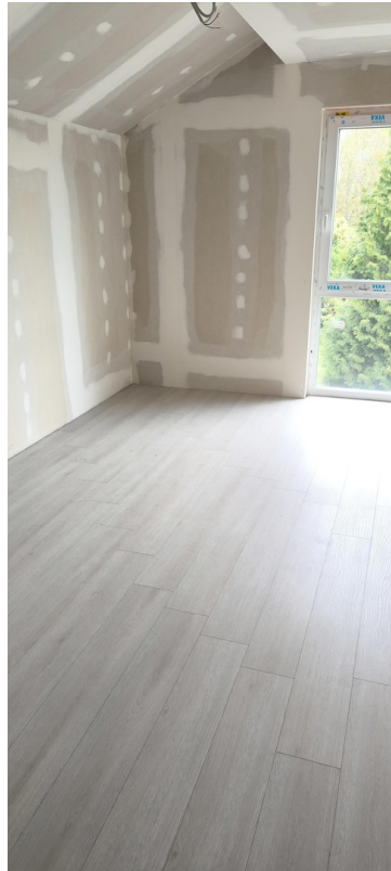
Bodentiefes Fenster KiZi