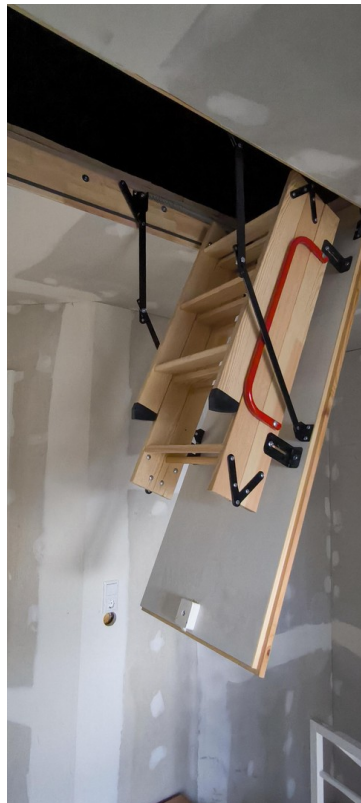
Zugang zum Dachboden