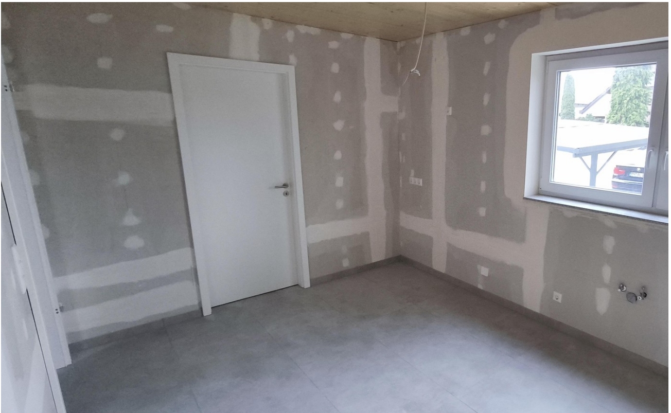
Küche, Zugang zu Abstellraum