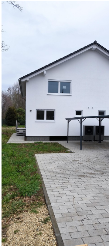
Parkplätze mit Carport