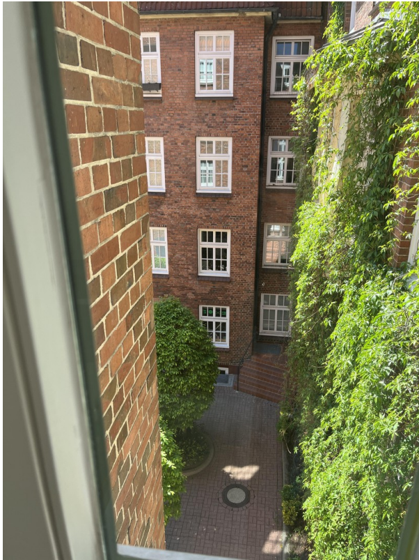
Blick aus Küchenfenster