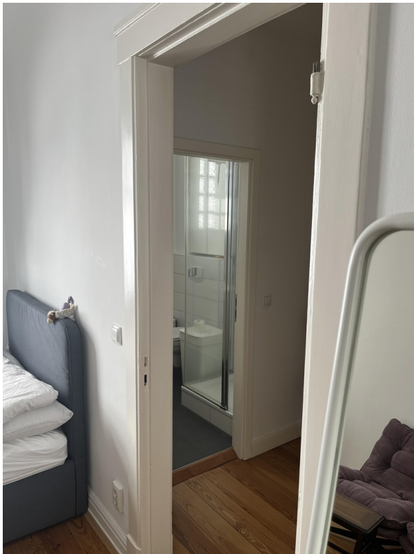
Blick Schlafzimmer - Bad