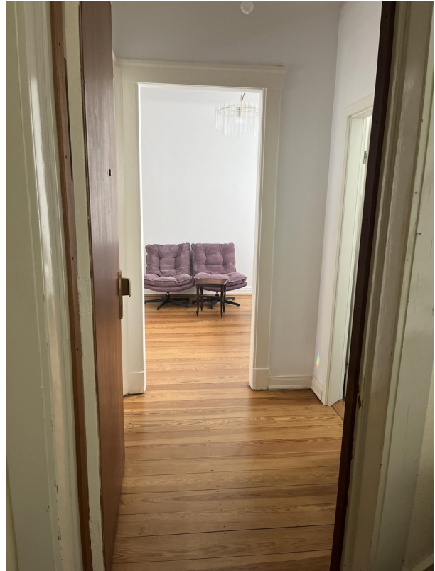
Blickachse Haustür - Schlafz.