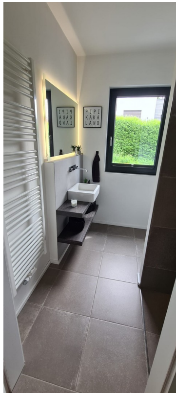
Gäste WC inkl. Dusche EG