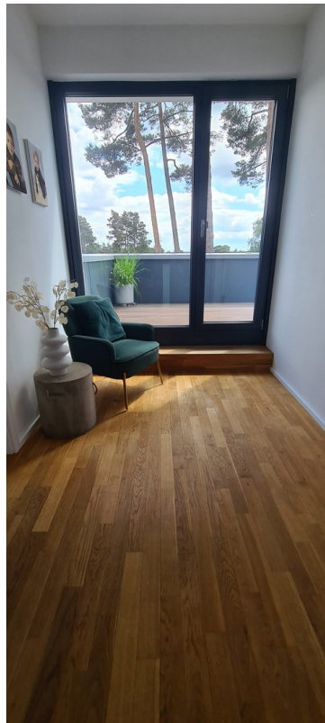
Ausgang Flur zur Dachterrasse