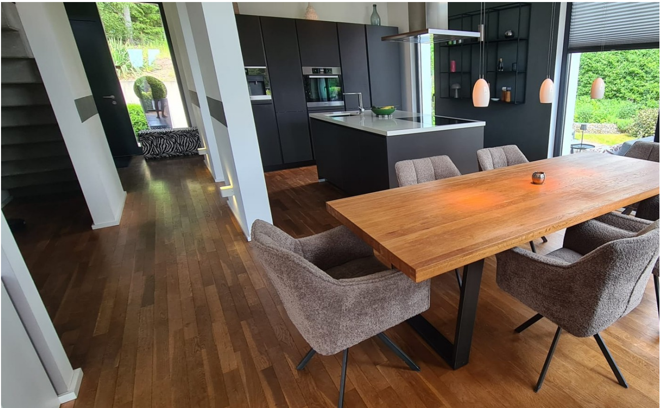
Blick in die Küche/Esszimmer