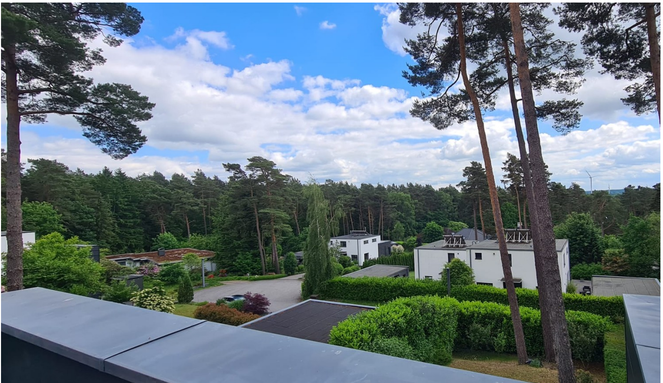
Blick von der Dachterrasse