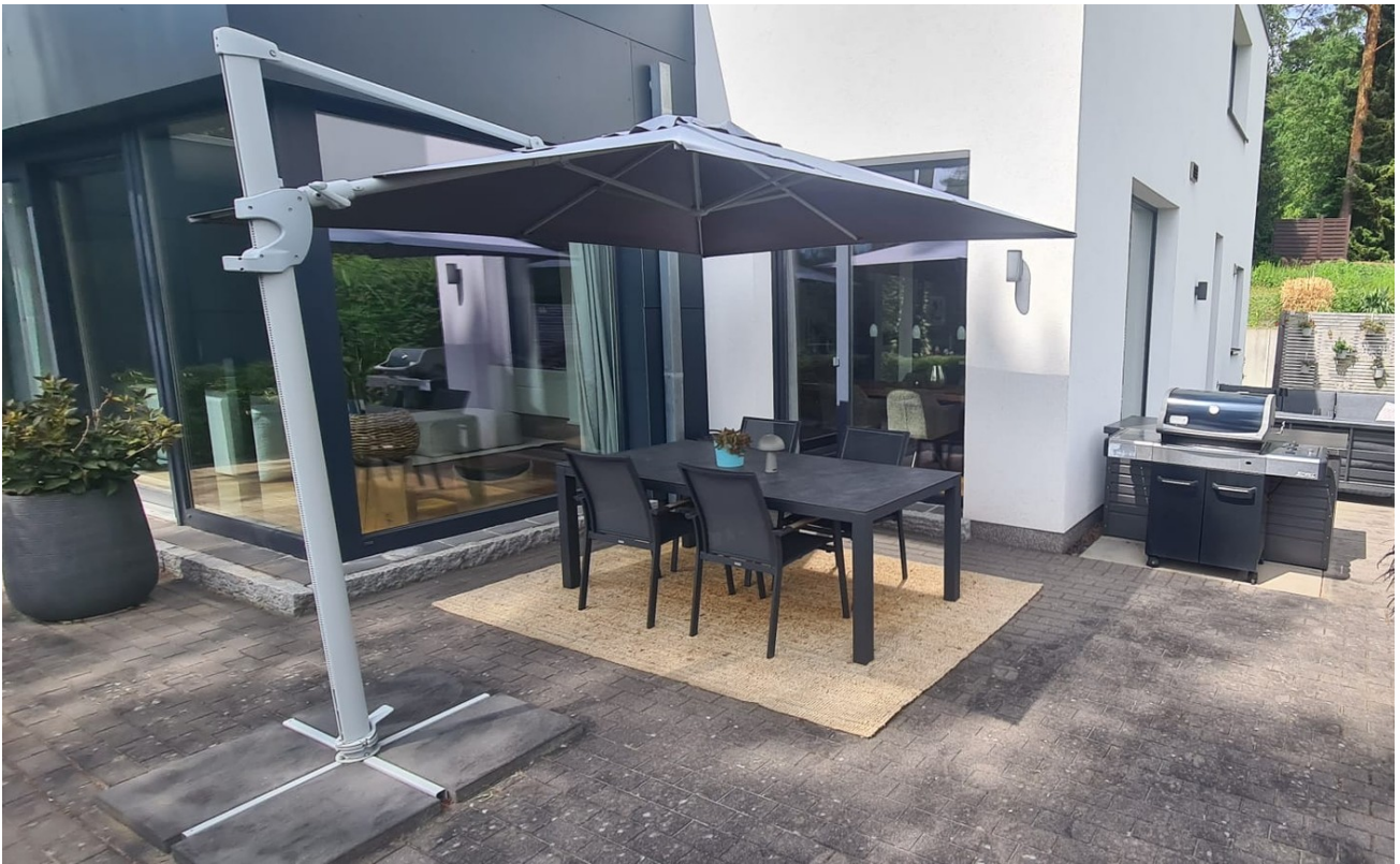
Hauptterrasse/ Terrasse Küche