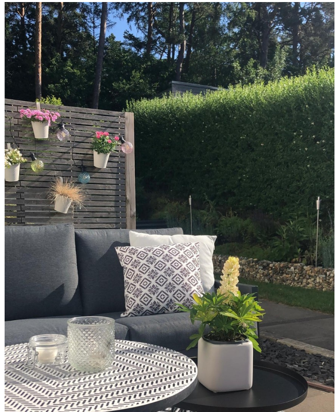
Seitliche Terrasse (Küche)