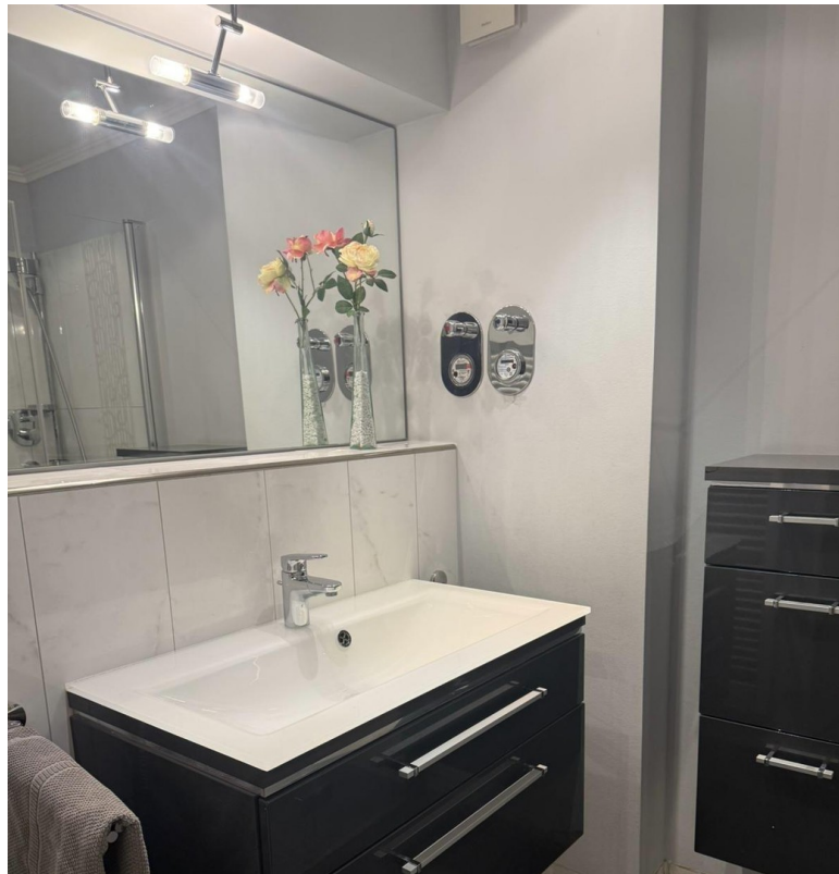
Waschtisch im Bad