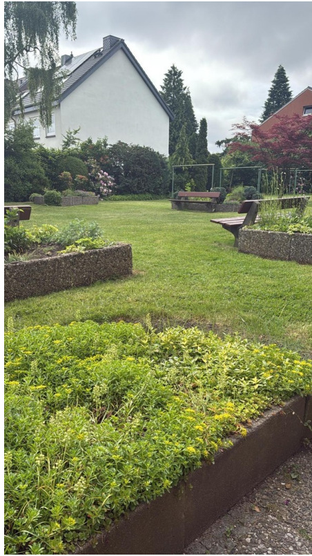
Außenanlage gemeinsame Nutzung