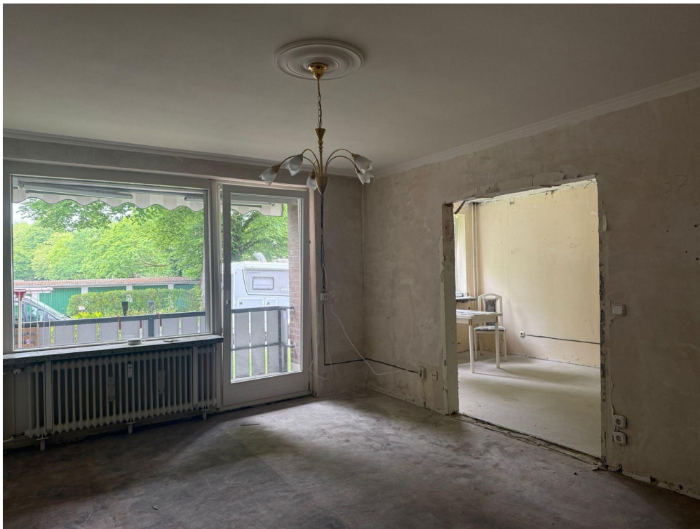
Wohnzimmer mit Durchbruch