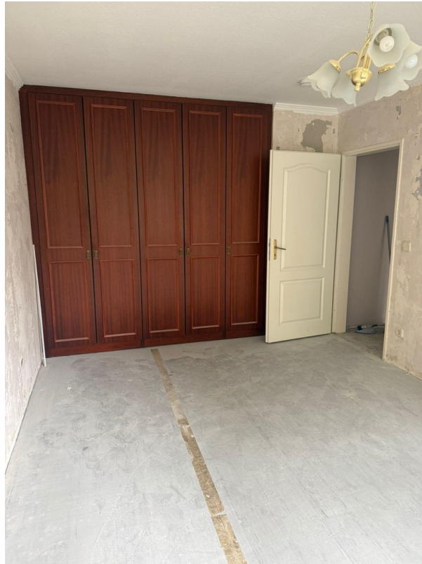
Einbauschränk im Schlafzimmer