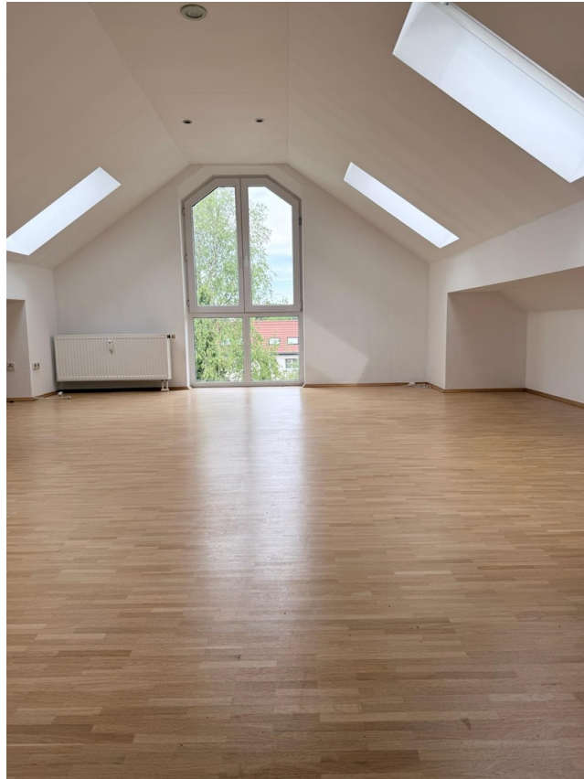
Galerie 1 von Treppe