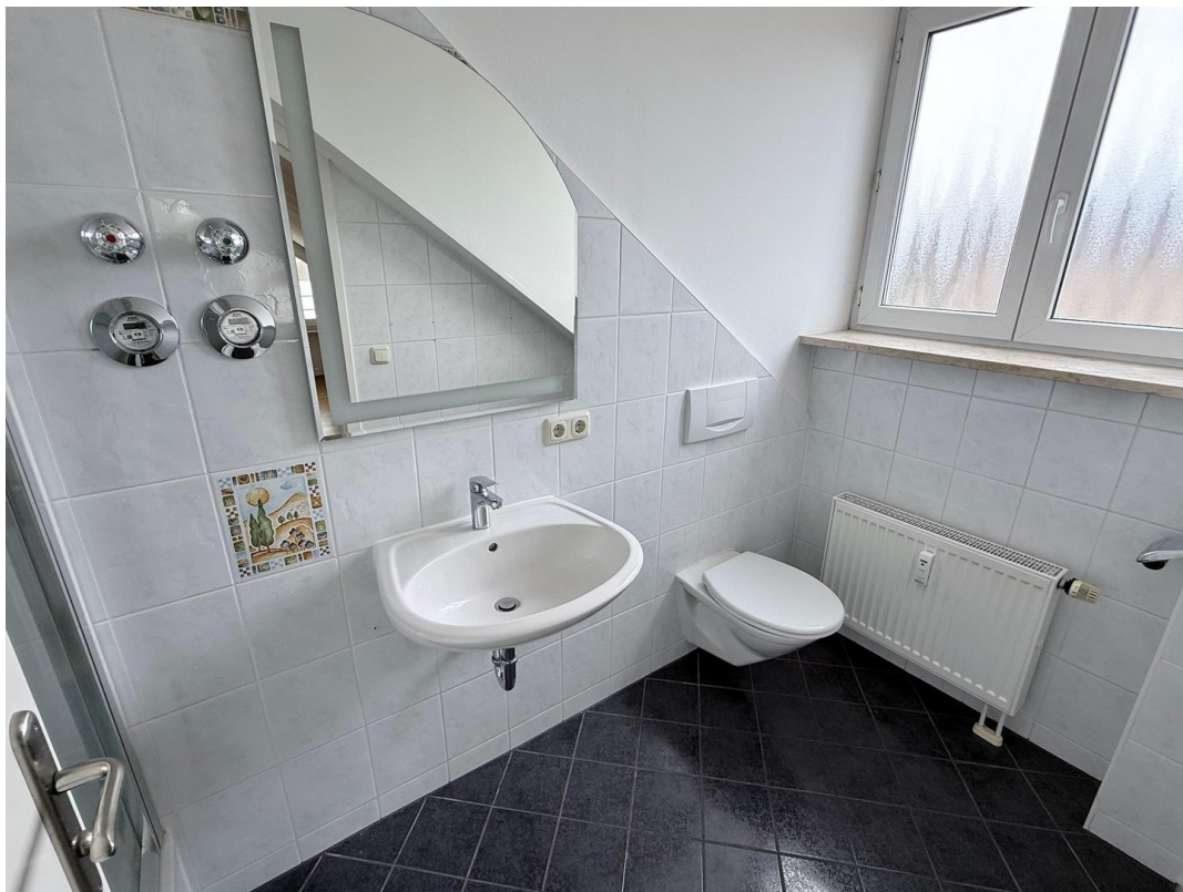
Bad en-suite Details