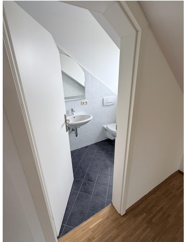
Bad en-suite Eingang