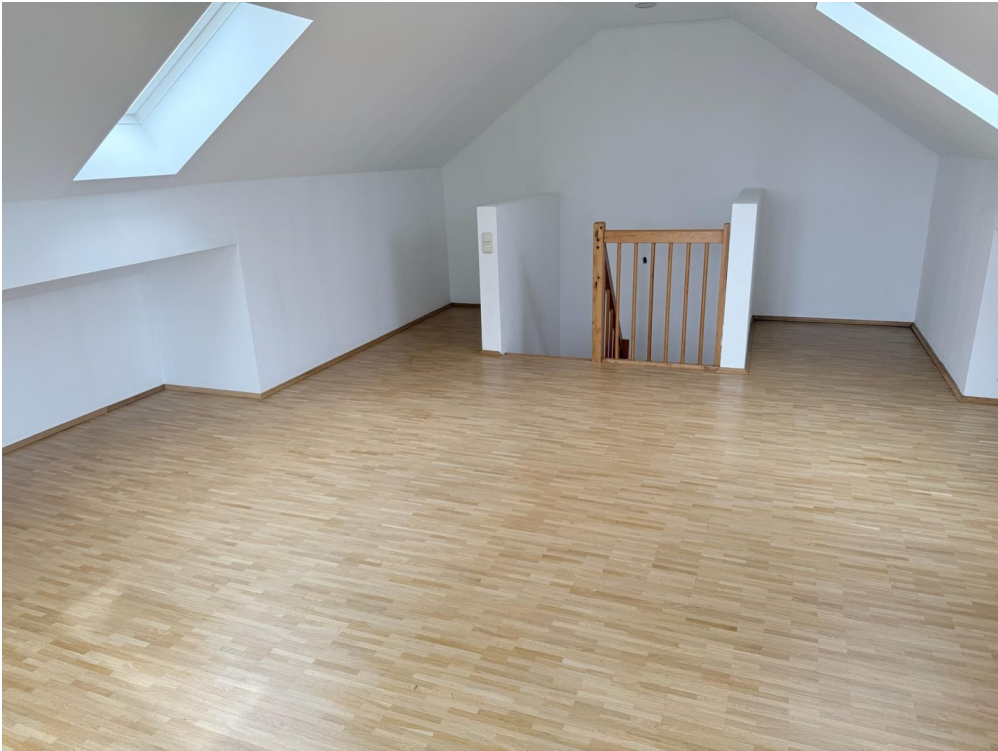
Galerie richtung Treppe