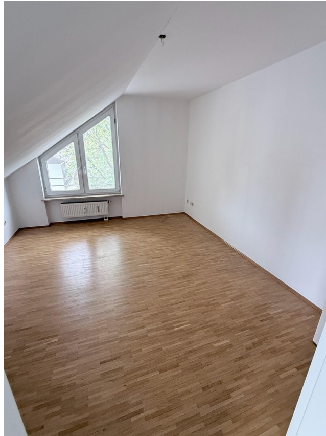
Schlafzimmer von Badtüre