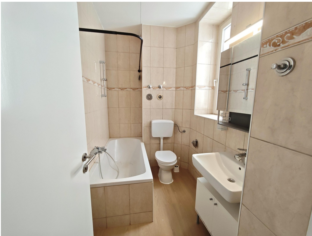
Bad mit Badewanne und WC